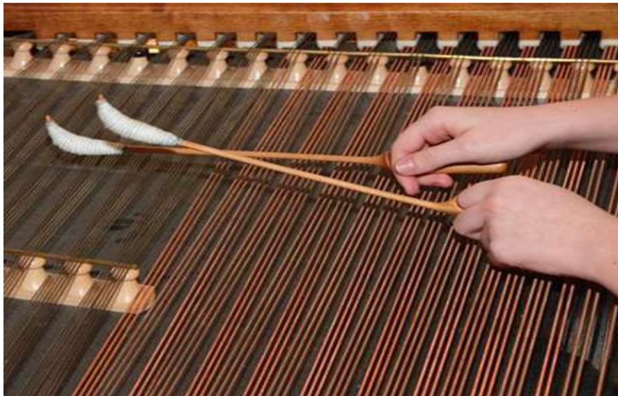
Fotografija 8 i 9: Cimbuje (cimbal)