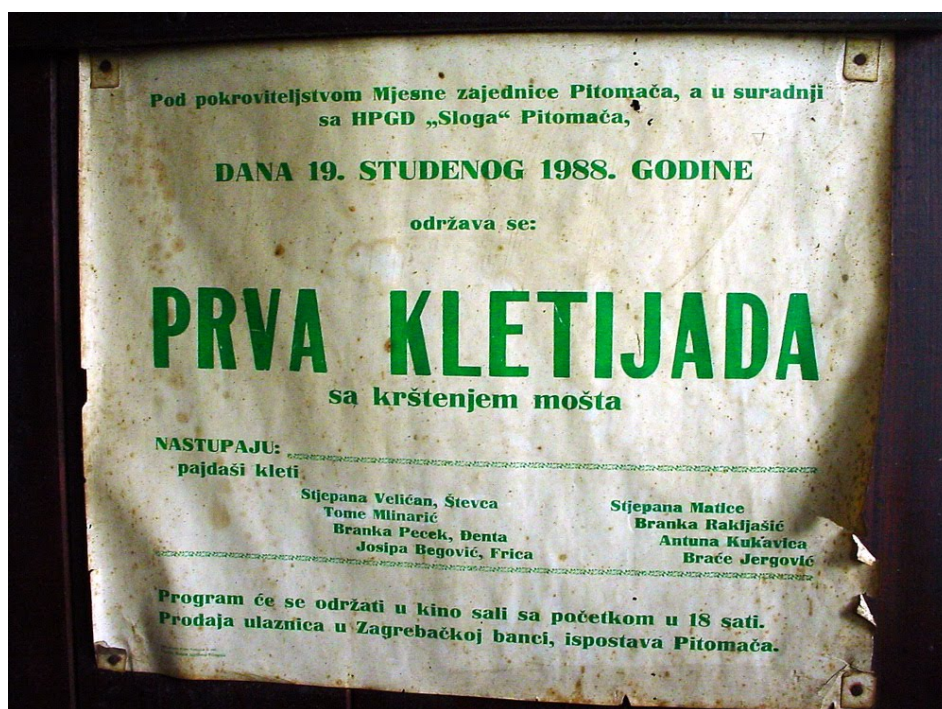
Fotografija 23: Plakat prve Kletijade održane 1988. godine u kino sali društvenoga doma u Pitomači

pučka priredba temeljena na običaju martinjskoga krštenja mošta koje su stari vinogradari od davnina obnašali na dan Svetoga Martina. 49