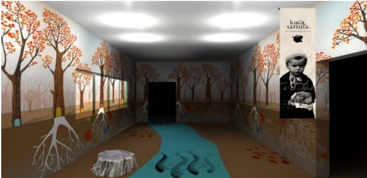
Slika 9. Kuća tartufa u Buzetu