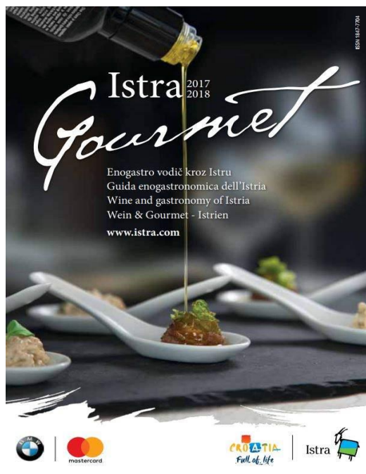
Slika 3. Naslovnica vodiča Istra Gourmet 2017/2018