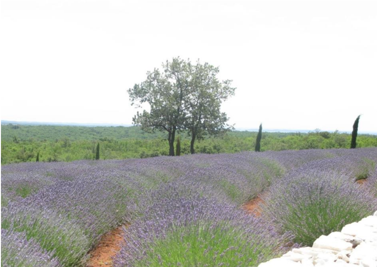
Slika 1. Histria Aromatica