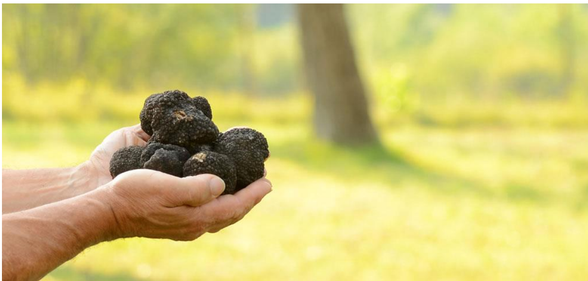
Slika 7. Crni tartuf