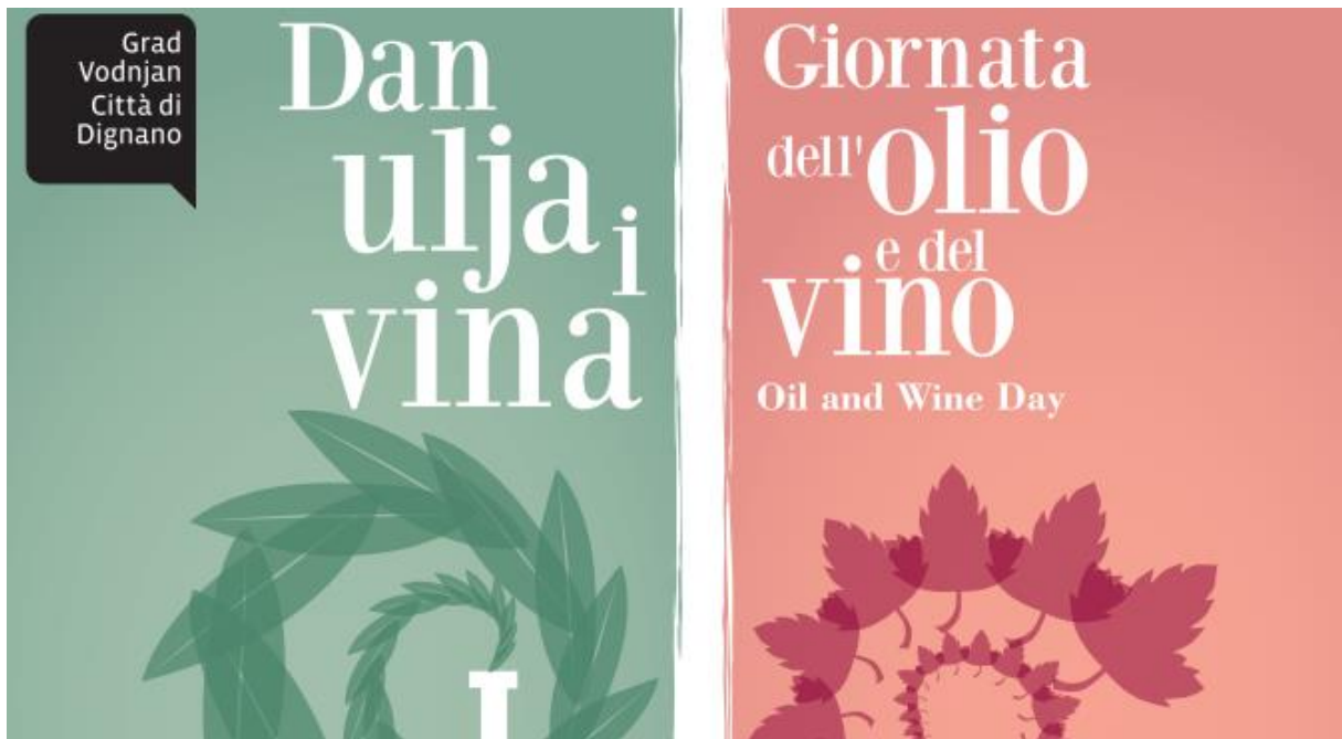
Slika 6. Dan ulja i vina

zaprimito 83 uzoraka maslinovog ulja i 35 uzoraka raznih vina. U kategoriji za maslinova ulja, 73 ih je nagrađeno zlatnom medaljom, dok je bilo samo 2 srebra i 5 bronci. Titulu ekstra djevičansko maslinovo ulje dobilo je 3 maslinova ulja 38 .