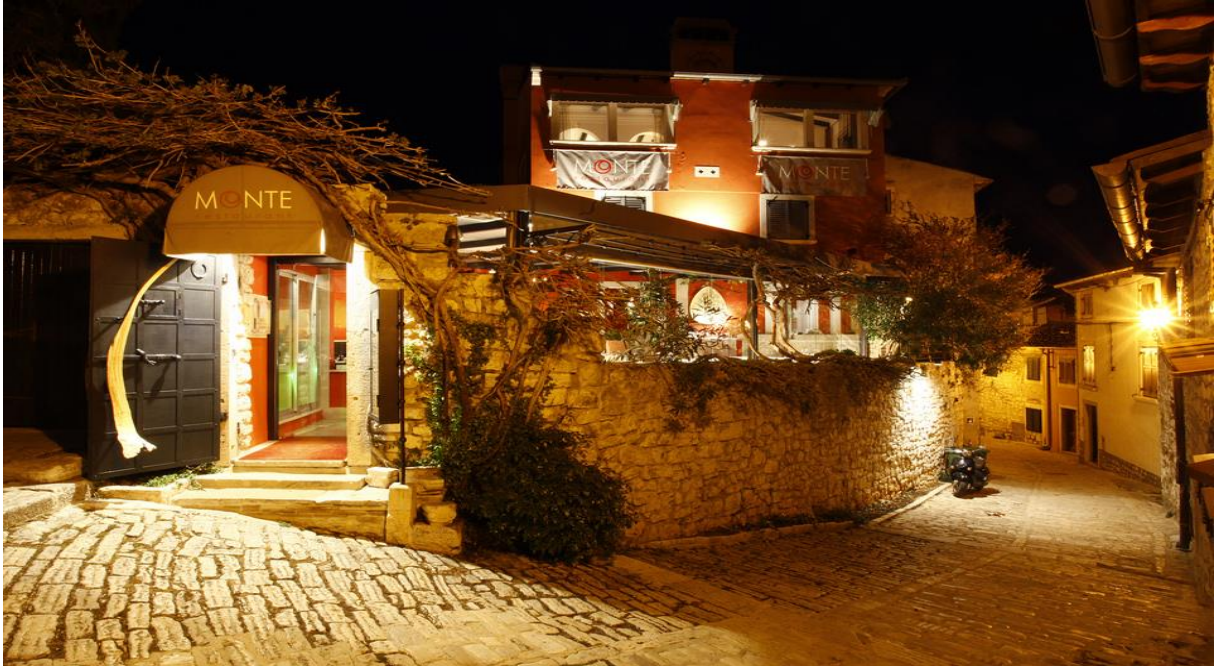
Slika 2. Restoran Monte u Rovinju

Michellinov gastronomski vodič je upravo ono što gosti cijene. To je potvrda same gastronomije, njen smisao, održavanja kvalitete, pažnja i ljubav prema namirnici te prema potrošaču.