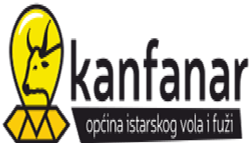
Slika 4. Logotip Općine Kanfanar