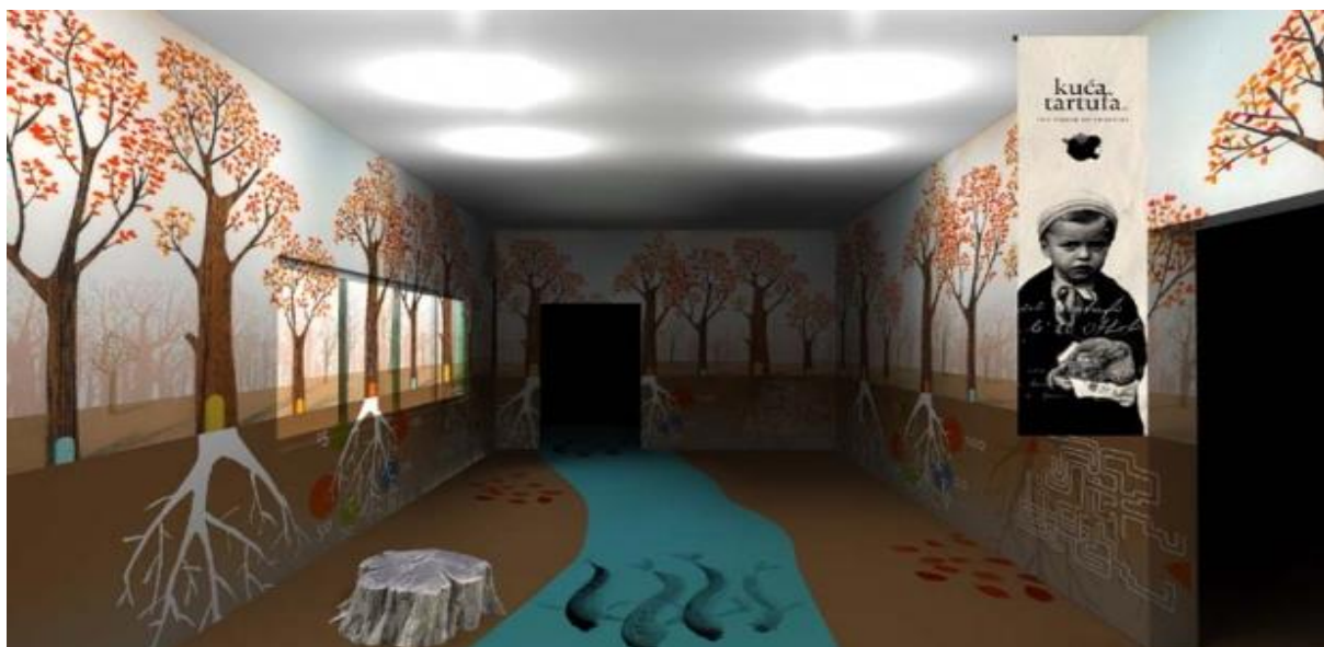
Slika 9. Kuća tartufa u Buzetu