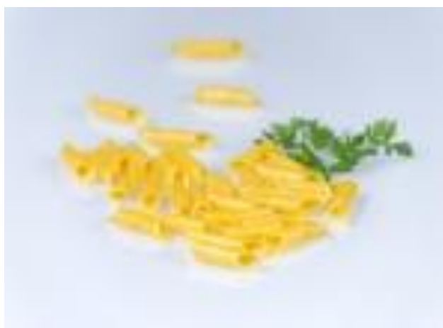
Slika 5. S fužima je doživljaj Istre potpuniji

Kanfanarska Jakovlja, kao jednu od glavnih atrakcija ističe Gastro show Fužijada. Osim u fužima s različitim umacima, posjetitelji mogu svake godine na Fužijadi navijati za jednu od natjecateljskih ekipa koje nastoji pripremiti „najbolji pijat fuži“. Ove su se godine natjecale ekipe kanfanarske osnovne škole, vrtića, DVD-a Kanfanar te jedinstvenog upravnog odjela Općine Kanfanar. Već tradicionalno, u Fužijadi sudjeluju i štićenici Down sindrom centra iz Pule, a ove godine je ponuda obogaćena i od strane udruge umirovljenika Općine Kanfanar s istarskim fritulama.