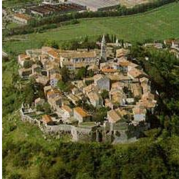
Slika 8. Buzet, grad istarskih tartufa