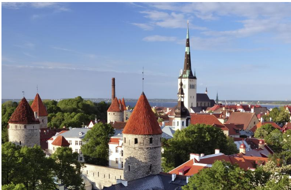
Slika 4. Grad Tallinn (Estonija)