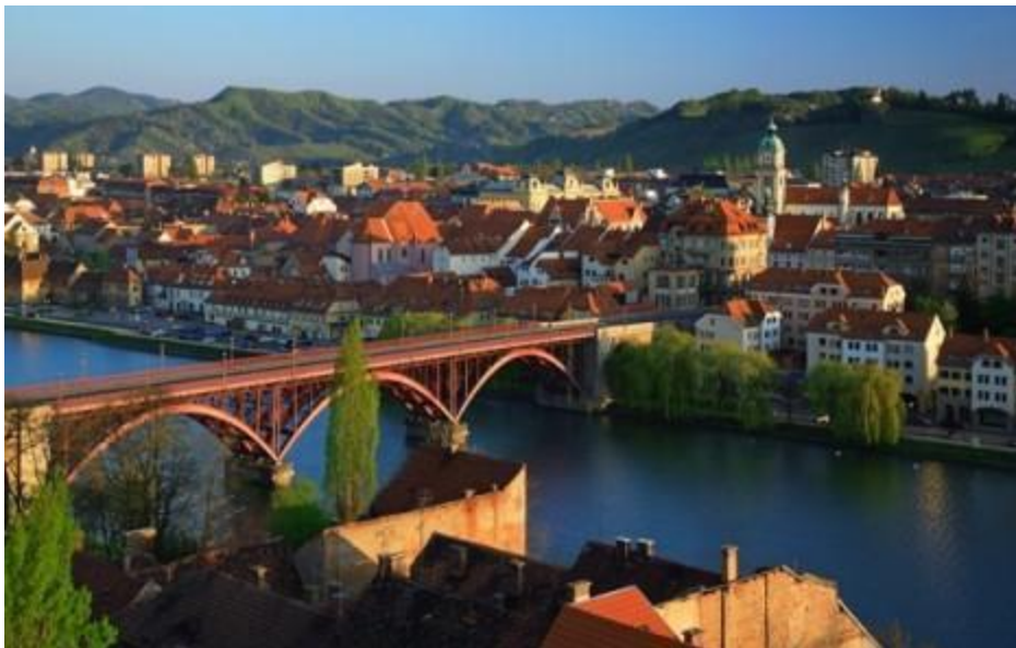
Slika 3. Grad Maribor (Slovenija)