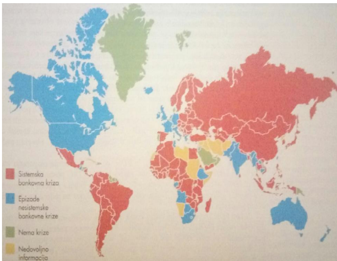
Slika 2.: Bankarske krize diljem svijeta od 1970. godine

Izvor: F. S. Mishkin, Ekonomija novca, bankarstva i finansijskih tržišta , Mate, Zagreb, 2010., str. 301.