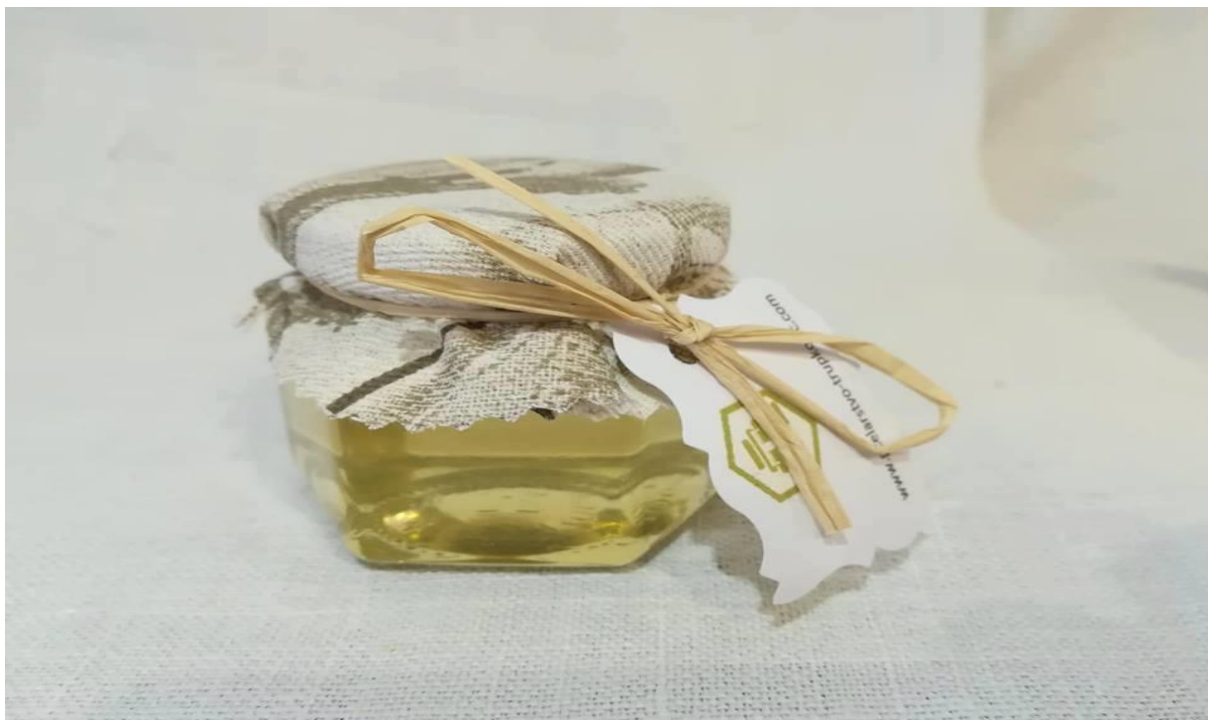
Slika 5. Poklon paket za poduzeća