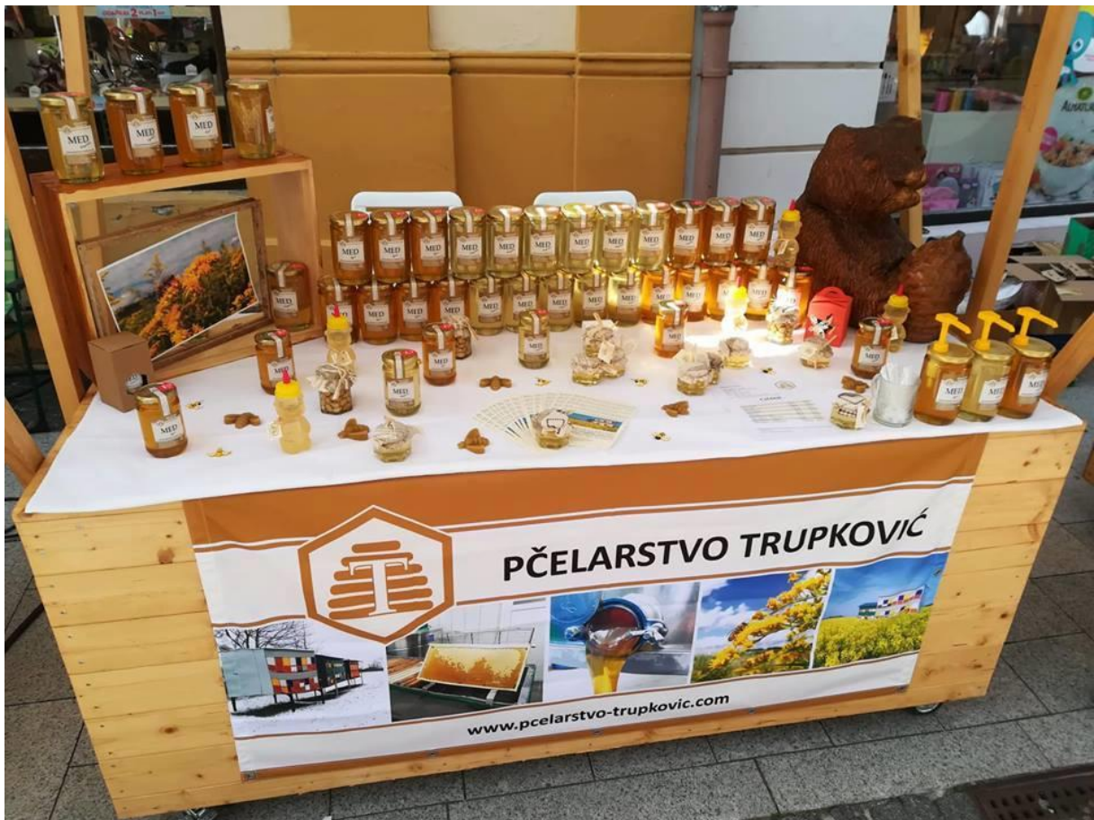
Slika 4. Sudjelovanje na manifestaciji Porcijunkolovo u Čakovcu, 2018. godine