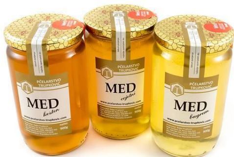
Slika 3. Vrste meda