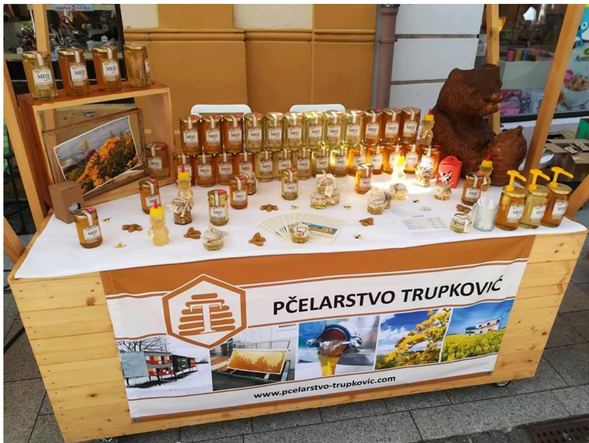
Slika 4. Sudjelovanje na manifestaciji Porcijunkolovo u Čakovcu, 2018. godine