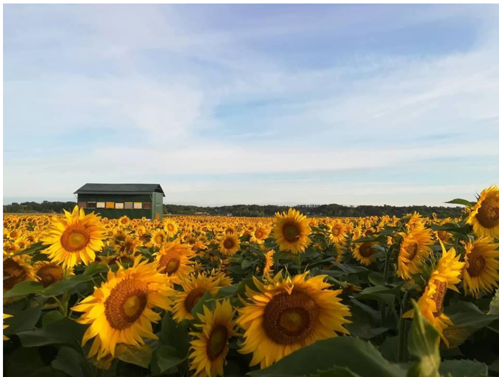
Slika 6. Prikaz košnica na polju suncokreta