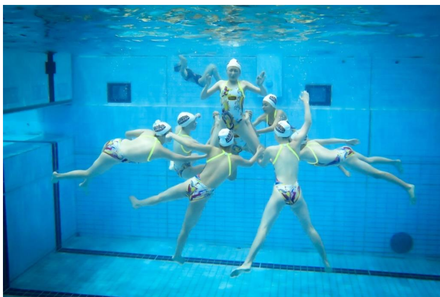
Slika 8. Pogled ispod površine vode