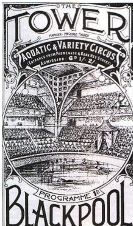
Slika 3. „Vodeni cirkus“ Blackwool Tower – oglasni poster iz 1894. godine (Izvor: https://www.smithsonianmag.com/history/synchronized-swimming-has-history-dates-back-ancient-rome-180960108/?no-ist (21.06.2018.))