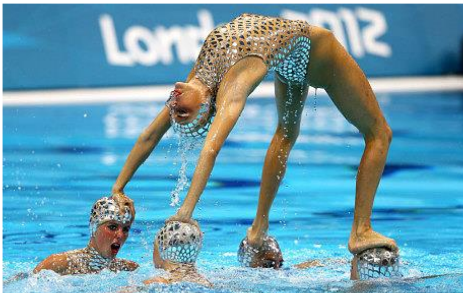
Slika 7. Izvedba u slobodnom stilu – tim Španjolske tijekom Olimpijskih igara 2012. godine (Izvor: https://www.telegraph.co.uk/women/11122002/Synchronised-swimming-now-for-children.html (12.06.2018.))

Na prikazu šest olimpijskih figura možemo vidjeti jedan od primjera kako je FINA 2017. godine standardizirala sport (preimenovavši ga u „umjetničko plivanje“) kako bi široj publici olakšala razumijevanje valorizacijskog (sudskog) procesa.