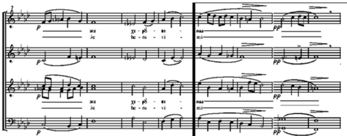
Slika 11. Melizimi na nenaglašeni slog u riječi heruvimi , posljednji slog -mi

Iako je u vokalnoj glazbi uobičajena praksa usklađivanja teksta i metrike, odstupanja koja su česta kod Mokranjca možemo opravdati utjecajem izvorne crkvene glazbe i upravo istoimenog napjeva koji se melodijski i ritmički bitno razlikuje od njegove skladbe dok je tekstualno identičan. Ako poslušamo izvorni napjev Heruvimska pjesma koji se pjeva tijekom liturgije, uočiti ćemo melizme u istim riječima na nenaglašenim slogovima. Neuobičajenu upotrebu melizama, na nenaglašenim slogovima riječi (najčešće zadnjem slogu) možemo vidjeti u slijedećim primjerima: