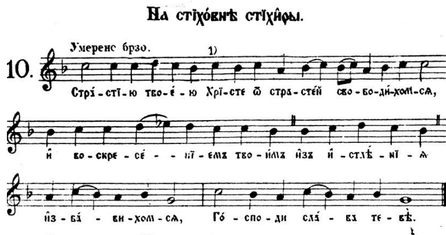
Slika 2. primjer Na stihovnij stihira (Stihire na stihovnij) 16

b) Kondak i ikos – po sadržaju srodne pjesme. Kondak ukratko ističe suštinu praznika dok ikos to čini dosta opširnije. Kondak zapravo predstavlja temu, a ikos izvršenje teme.