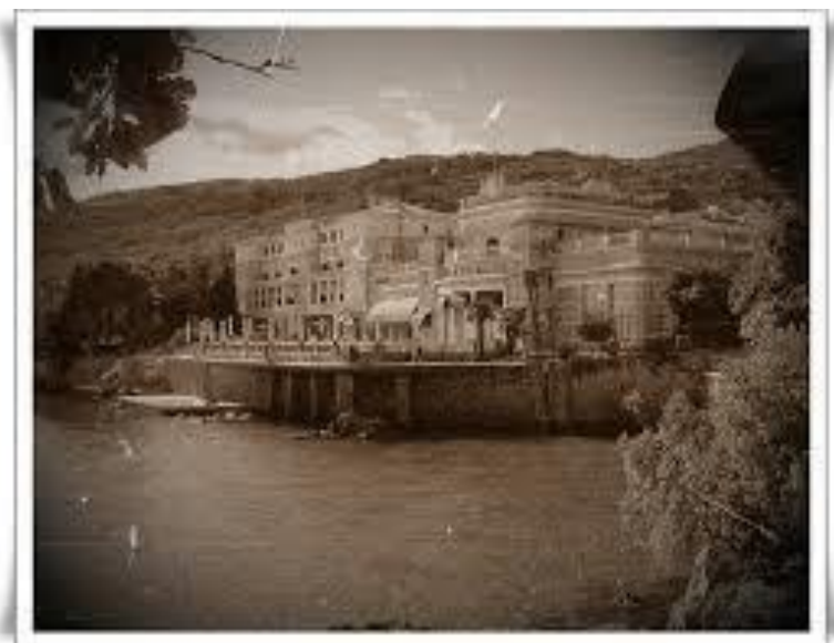
Slika 2. Hotel Kvarner - Opatija