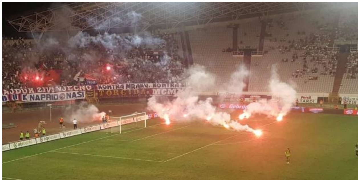
Slika 8. Torcida bakljadom prekinula utakmicu i nasiljem reagirala na loše rezultate