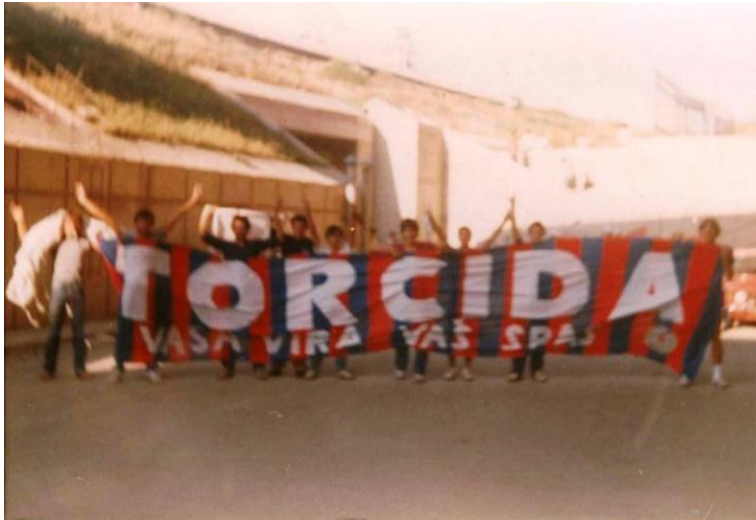
Slika 3. Torcida se obnavlja, 1981.

Izvor: http://www.torcida.hr/povijesna-cinjenica/torcida-se-obnavlja/