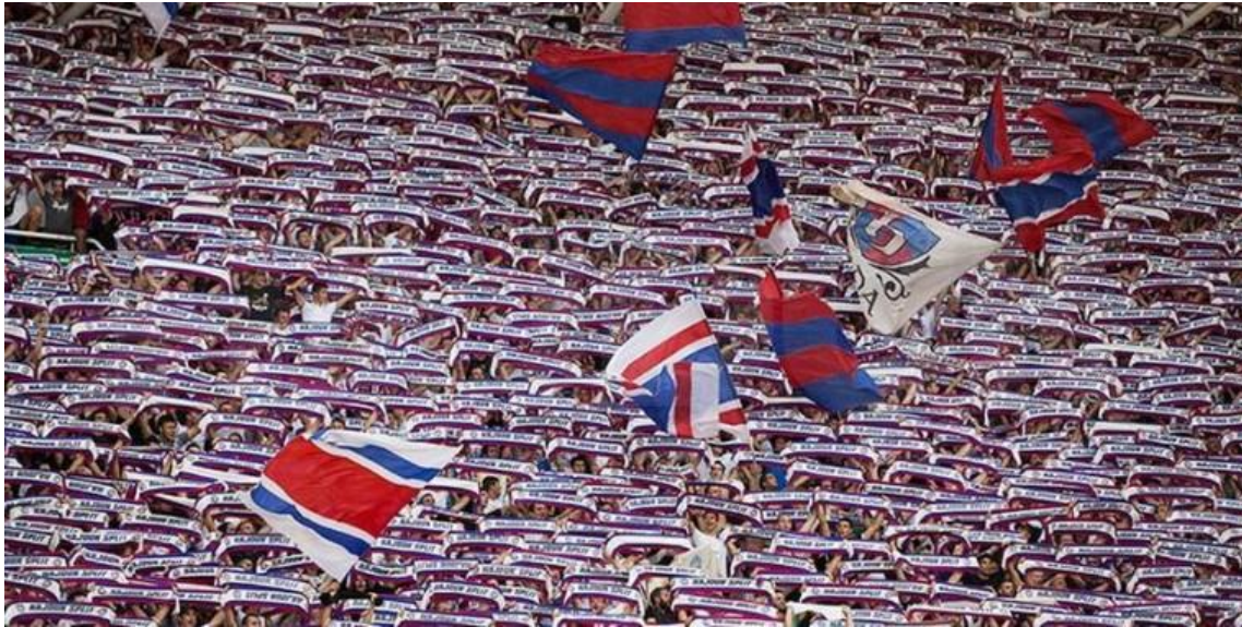
Slika 6. Torcida - šalovi