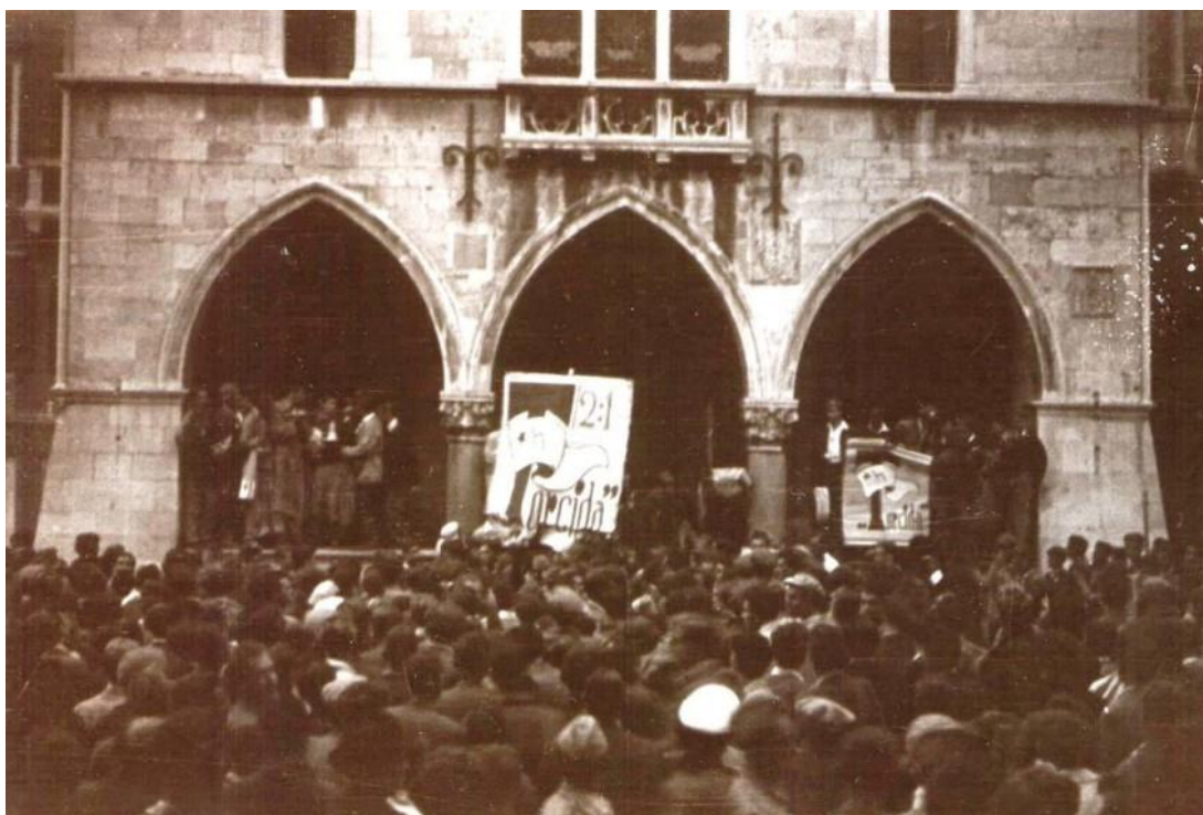
Slika 1. Osnivanje Torcide