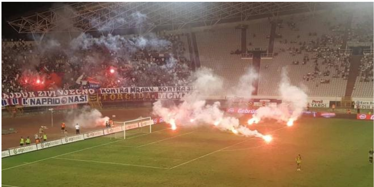
Slika 8. Torcida bakljadom prekinula utakmicu i nasiljem reagirala na loše rezultate