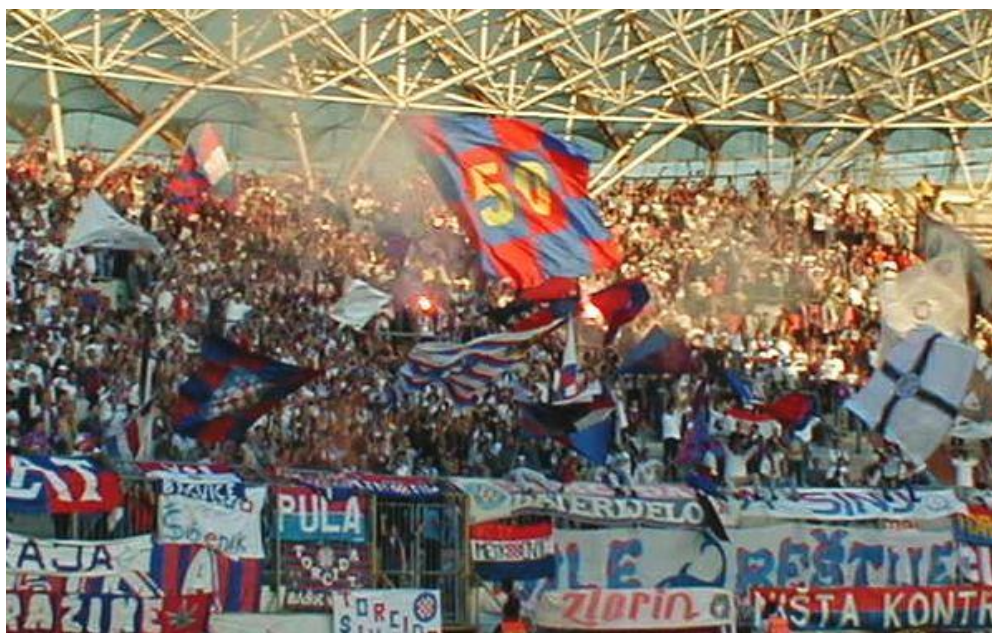
Slika 5. Torcida - navijačke zastave