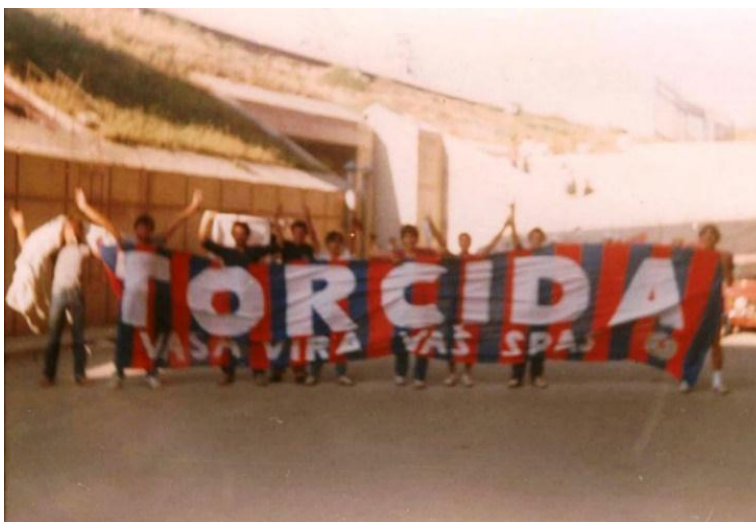
Slika 3. Torcida se obnavlja, 1981.