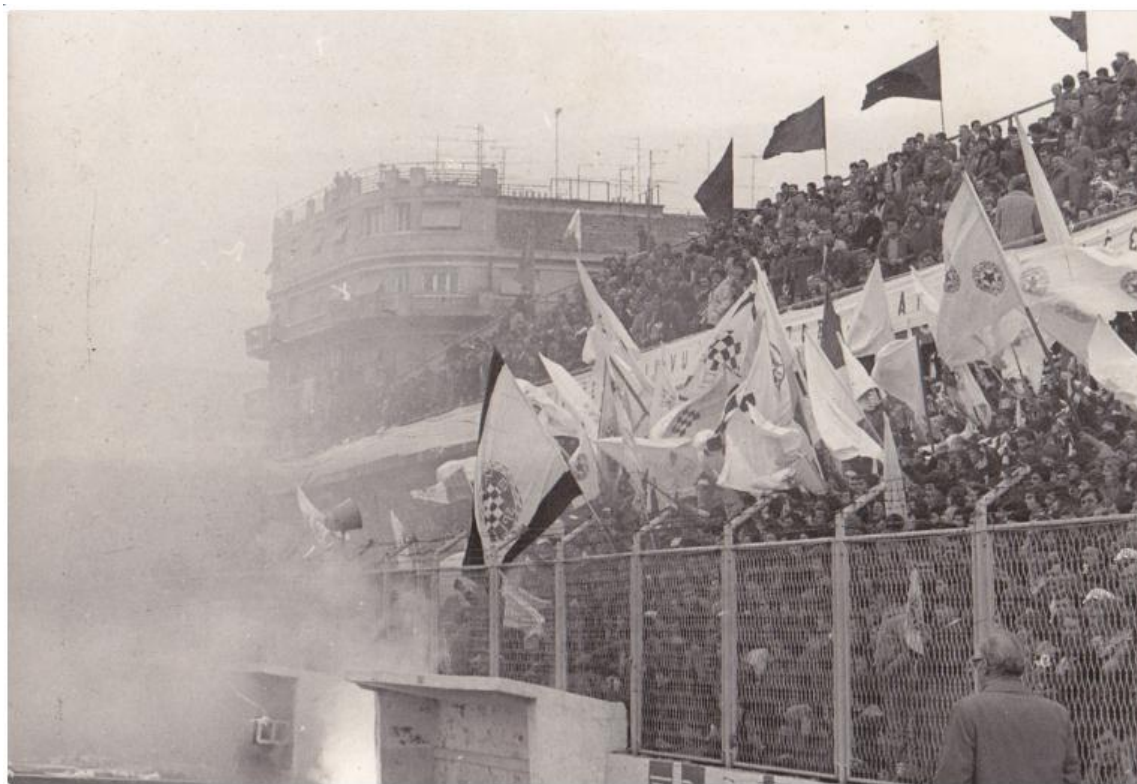
Slika 2. Nastavak djelovanja u ilegali