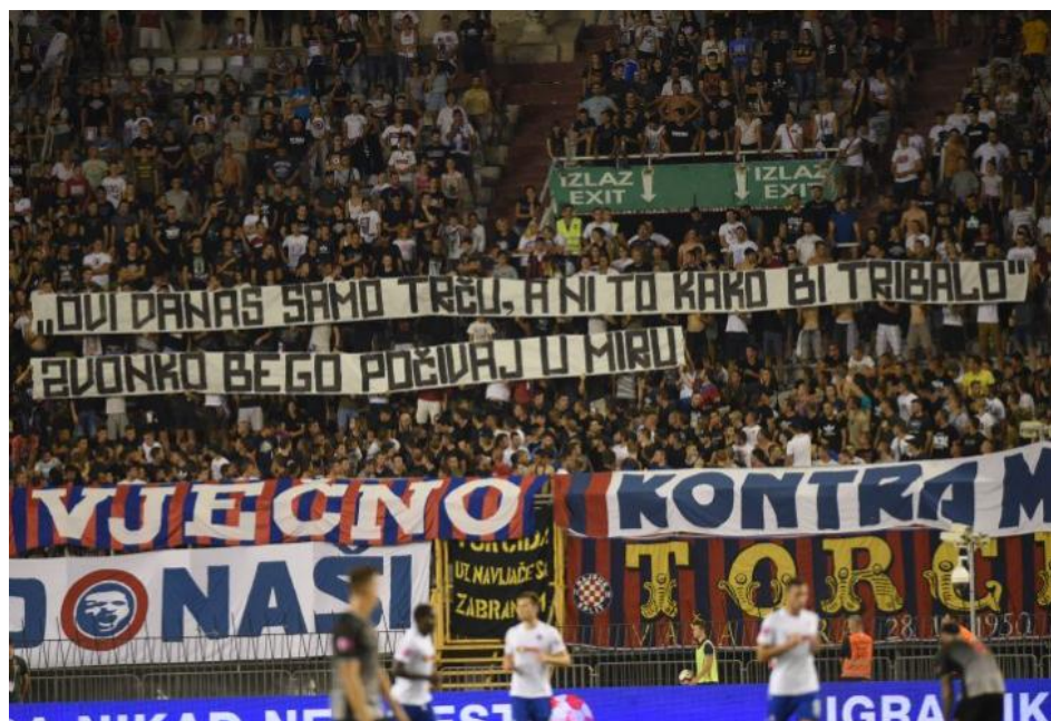
Slika 7 – transparent u spomen Zvonka Bege