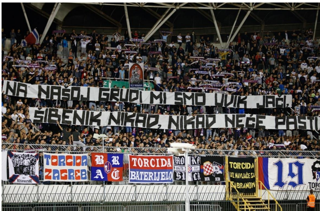
Slika 4. Transparenti – Torcida Šibenik