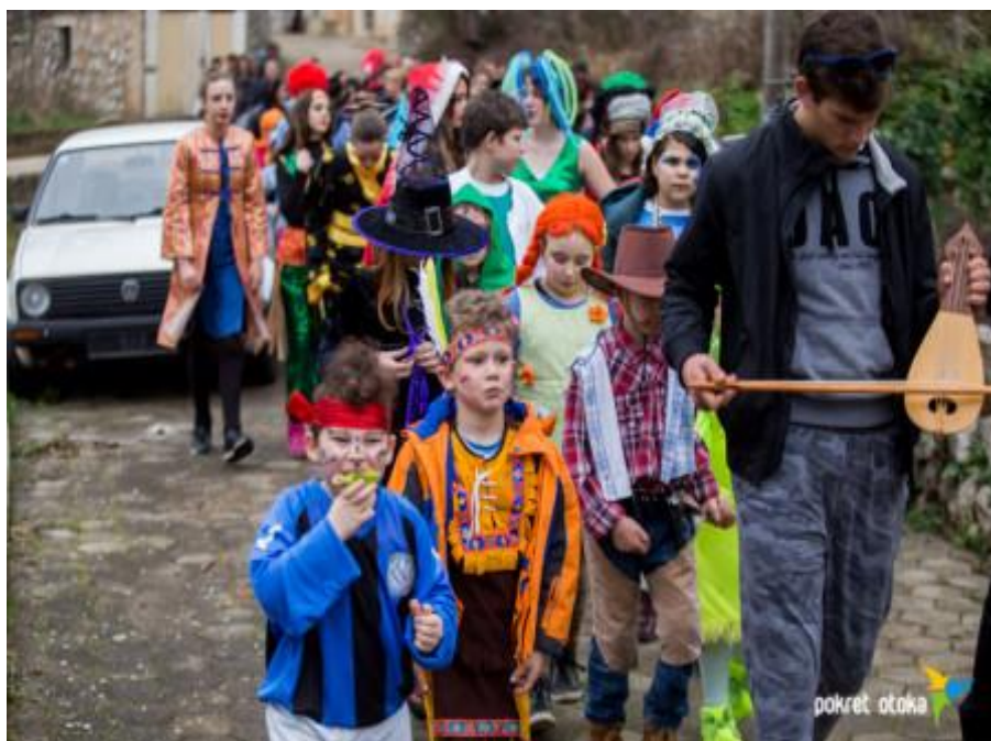
Slika 7: Povorka „malih maškara“