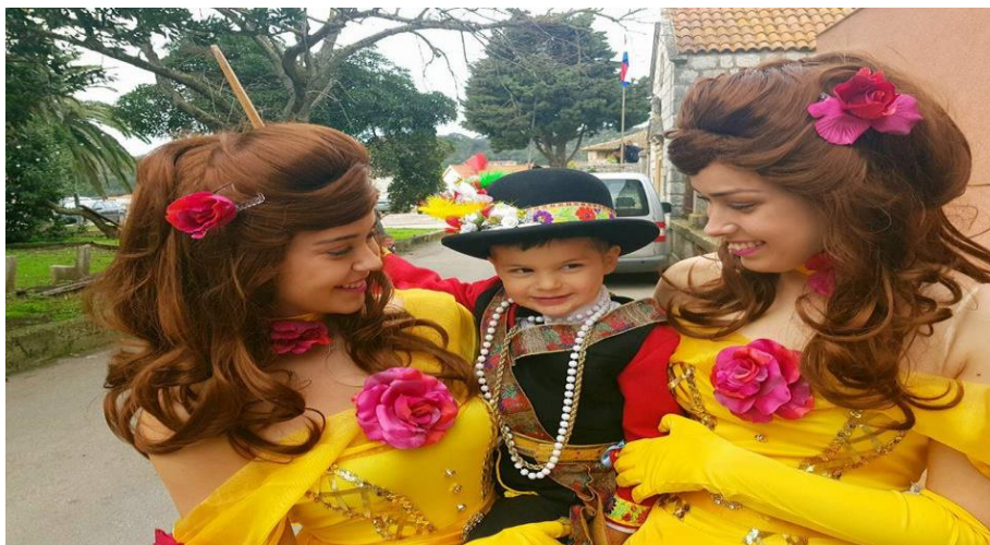
Slika 16: „Lijepa maškare“ i mali pokladar