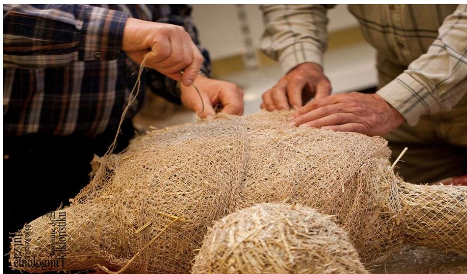
Slika 9: Izrada lutke Poklad