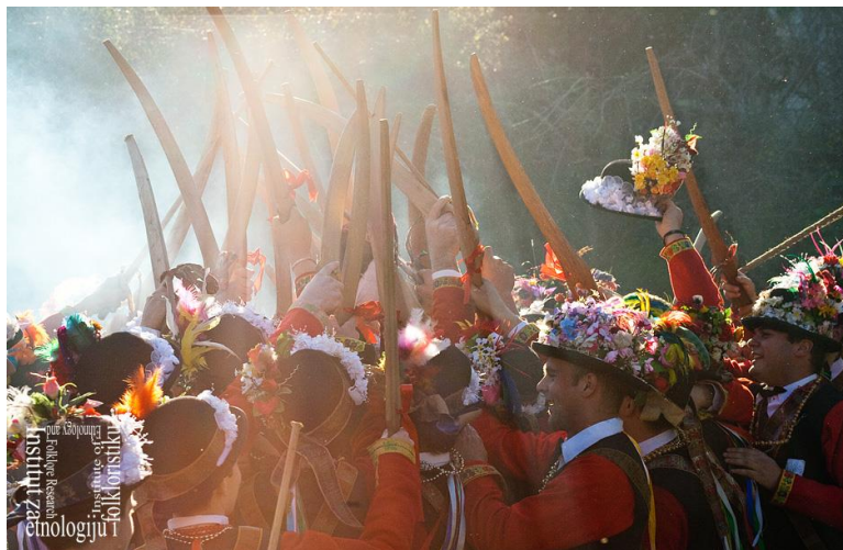
Slika 4: Culjanje, veljača 2009.