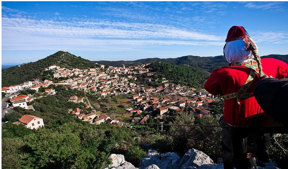
Slika 6: Spuštanje lutke Poklad niz „uzu“