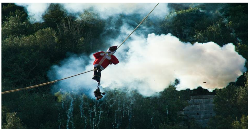
Slika 11: „Culjanje Poklada“