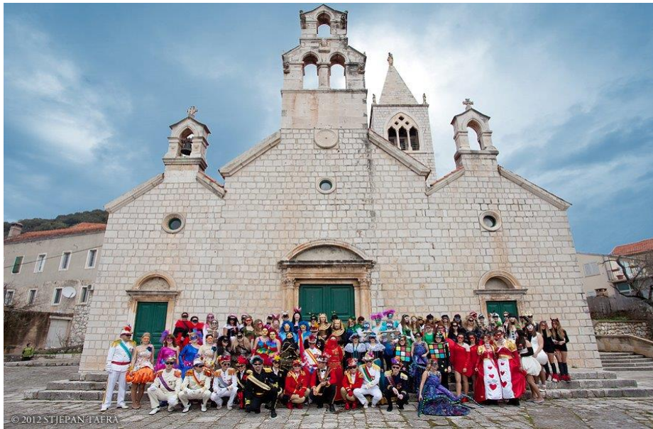
Slika 18: „Lijepe maškare“