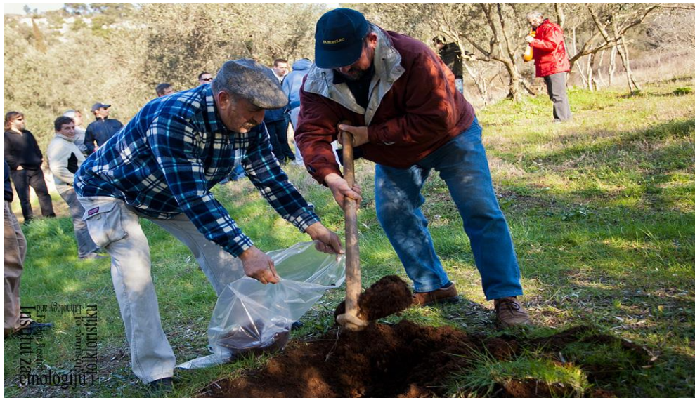
Slika 8: Kopanje prline