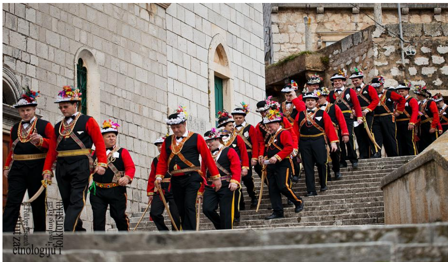
Slika 5: Povorka pokladara 2012.