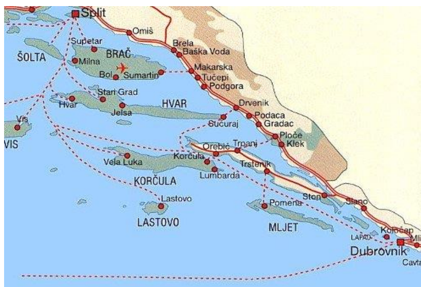
Slika 1: Geografski prikaz južnojadranskih otoka