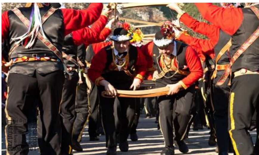
Slika 14: Lančani ples pokladara