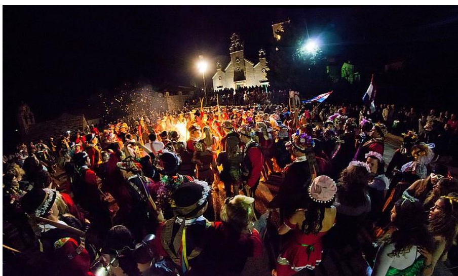
Slika 17: Završna svečanost na Dolcu