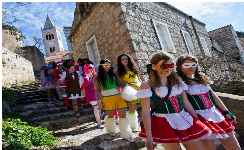
Slika 12: Povorka „lijepih maškara“