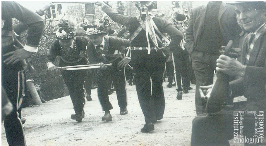
Slika 15: Stare slike lančanog plesa na Lastovu