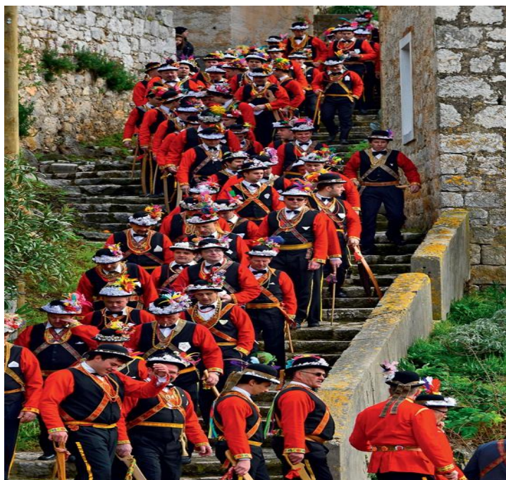
Slika 3: Povorka pokladara kroz mjesto Lastovo

Izvor: Mrežna stranica Pokreta otoka. Dostupno na: https://www.otoci.eu/event/lastovski-poklad-2018/ . Pristup: 11.09.2018.