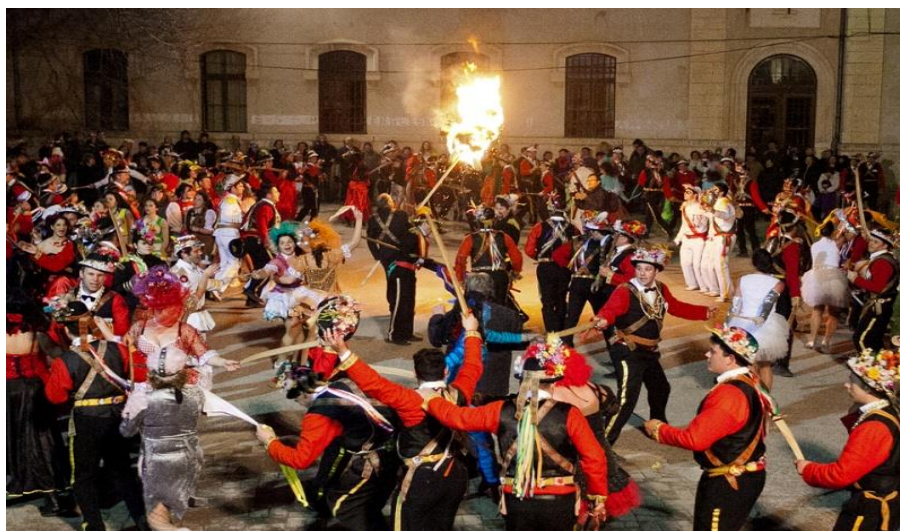
Slika 13: Završna svečanost na Dolcu