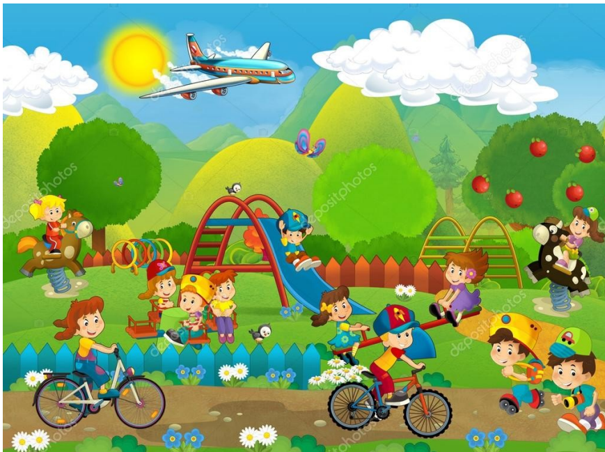
Slika 2: Predložak za provjeru razvoja jezika i govora

Prilikom istraživanja koristile su se fotografije mobitela, tableta, računala, televizije i slika dječjeg parka pomoću koje se određivao stupanj razvoja dječjeg govora. Prilikom opisa djece što vide na slici dječjeg parka korišten je diktafon. Za procjenu razvoja dječjeg jezika i govora u skladu s njihovim godinama koristila se tablica iz poglavlja 9.1. „Kalendar jezično-govornog razvoja prema Andrešić, Benc Štuka, Gugo Crevar, Ivanković, Mance, Mesec, Tambić (2010:11.)“.