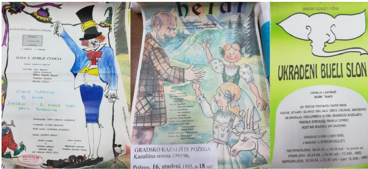
Slika 13. Plakati kazališnih predstava tijekom 1994. i 1995.