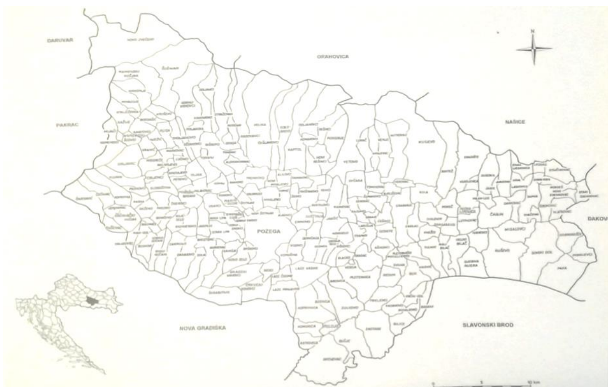
Slika 5. Karta općine Požega

6,6% udjela stanovništva. 19 Što se tiče broja naselja, općina Požega se sastojala od 209 naselja. Hrvati su bili većina u njih 132, Srbi u 66, a samo u jednom 1 naselju su etnička većina bili ostali. Naselja s relativnom većinom bilo je 7 od čega 4 srpska, 3 hrvatska, jedno naselje nije imalo većinsku prevlast neke etničke skupine i 2 su naselja bila bez stanovništva. Za razliku od najvećih naselja općine Pakrac, najveća naselja općine Požega su bila većinski hrvatska: Kutjevo 94,6%, Pleternica 94,2%, Požega 75,4% i Velika s 90,1% Hrvata. 20 Iz ovog dijela u brojkama već se može iščitati zašto na požeškom području sukobi nisu bili dugotrajni, dok je pakračko područje ostalo podijeljeno do Bljeska.