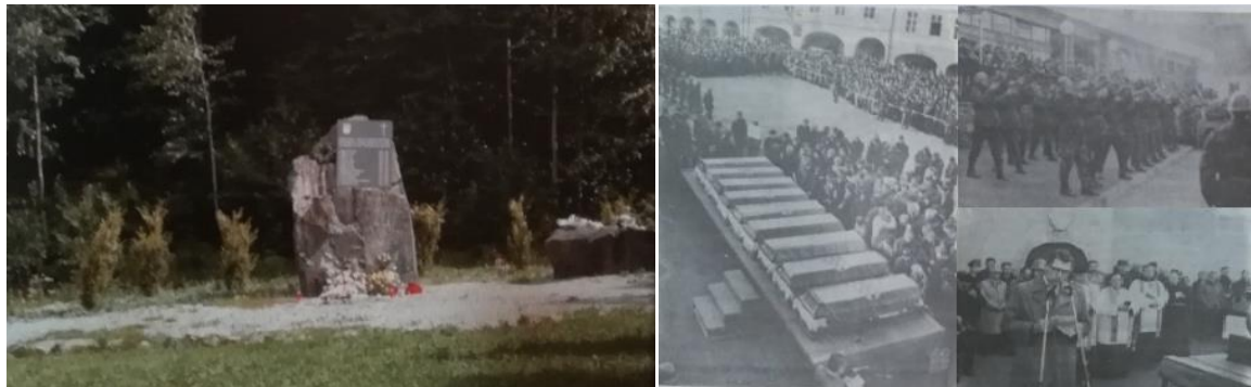
Slike 9. i 10. Prikaz današnjeg spomenika i posljednjeg ispraćaja poginulih na Papuku

Prosinac je za hrvatsku stranu na požeškom području krenuo s tragedijom. Dana 2. prosinca 11 hrvatskih redarstvenika upalo je u zasjedu kod „Baze“ na Papuku. „Baza“ je bila relejni centar JNA s odašiljačima, koji se nalazio na najvišem vrhu Papuka na 954metra nadmorske visine. Hrvatska vojska je „Bazu“ zauzela tijekom akcije „Papuk-91“ 13. studenog i od tada su ga vojnici 123. brigade čuvali u smjenama. Toga dana 2. prosinca 11 je redarstvenika krenulo na smjenu. Na putu do „Baze“ zapali su u klopku i dok je pomoć stigla svi su izginuli. Danas se na tome mjestu nalazi spomenik poginulim braniteljima. Od 11 poginulih devet je bilo pripadnika 123. brigade i dva pripadnika Odreda veze Glavnog stožera HV-a Samobor. Devetorici pripadnika 123. požeške brigade pripremljen je veliki posljednji ispraćaj na požeškom Trgu Svetog Trojstva od strane 123. brigade i općinskog poglavarstva. 77