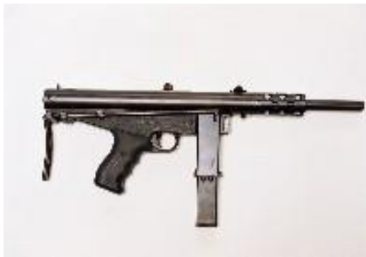
Slika 12. Puška Pleter 91

Za vrijeme sukoba na požeškom, ali i području drugih okolnih općina dolazi do zastoja gospodarstva. Rat ja na požeškom području krenuo 19. kolovoza taman u vrijeme kada kreću vršidbe poljoprivrednih zemljišta. Gospodarstvo požeštine uvelike se temeljilo na poljoprivredi i drvanoj industriji. Prema izvještaju PPK Kutjevo, ipak većina obrađenih površina bila je pobrana. Neobrani su ostali uglavnom dijelovi sjeverozapadnog dijela općine gdje su se nalazila srpska naselja te naselja na prvoj crti udara. 84 Šume općine, ali i ostalih dijelova Hrvatske postale su opasne pa se u industriji pojavio nedostatak trupaca za obradu. Pleternička drvna firma Oroplet je svoju drvenu industriju zamijenila izradom oružja za slabo naoružane snage HV-a. Puška Pleter 91 rađena je po uzoru na francusku pušku Vignerom M 2, bila je rafalni tip naoružanja namijenjen za blisku borbu sa spremnikom od 32 metka. 85