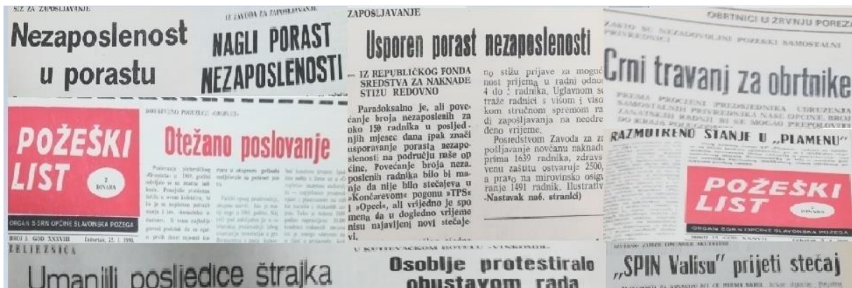
Slika 6. Naslovi iz novina o stanju u gospodarstvu