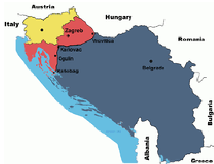
Slika 2. Prikaz karte Velike Srbije

U periodu između ovih proglašenja u Hrvatskoj je započeo rat između ranije sukobljenih tabora koji će trajati sve do hrvatskih operacija Bljesak i Oluja koje su se odvijale u počecima svibnja i kolovoza 1995. godine. Ipak glavni cilj sukoba sa srpske strane nije postao samo prostor na kojemu su Srbi bili većinski narod nego uz pomoć JNA uspostava granice Velike Srbije. Sam je Vojislav Šešelj, jedan od glavnih urednika plana Velike Srbije, jednom prilikom izjavio „amputirat ćemo Hrvatsku. Znači sve teritorije zapadno od linije Karlobag-Ogulin-Karlovac- Virovitica. Sve što je s ove strane linije to je Srbija, a ono što je sa zapada ne znam, niti me interesuje“. 17 Šešelj je predložio nove granice Srbije koje su prikazane na slici 2.