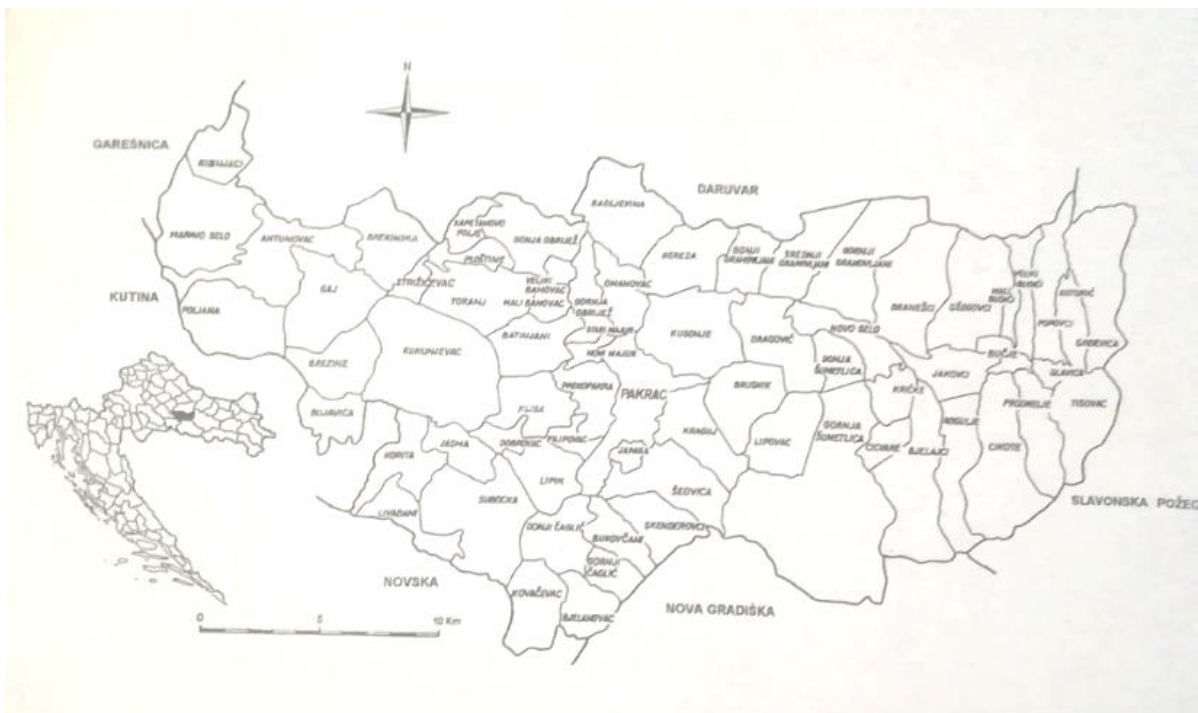
Slika 4. Karta općine Pakrac

Općina Pakrac je brojala 27 589 stanovnika od kojih je 12 813 bilo Srba, Hrvata je bilo 9 896, Jugoslavena 1 346 i ostalih 3 534. U postocima je to 46,4% Srba, 35,9% Hrvata, dok su ostali zauzimali 17,6% udjela u stanovništvu. Još jedna bitna stavka ovog područja je raspodjela naselja po većinskoj etničkoj pripadnosti. Općina Pakrac brojala je 68 naselja u kojima su Srbi bili većina u njih 46, dok Hrvati u njih 15, ostale su nacionalnosti bile većinske u pet naselja dok su najveća naselja Pakrac i Lipik bili etnički relativno većinski srpska naselja. 18