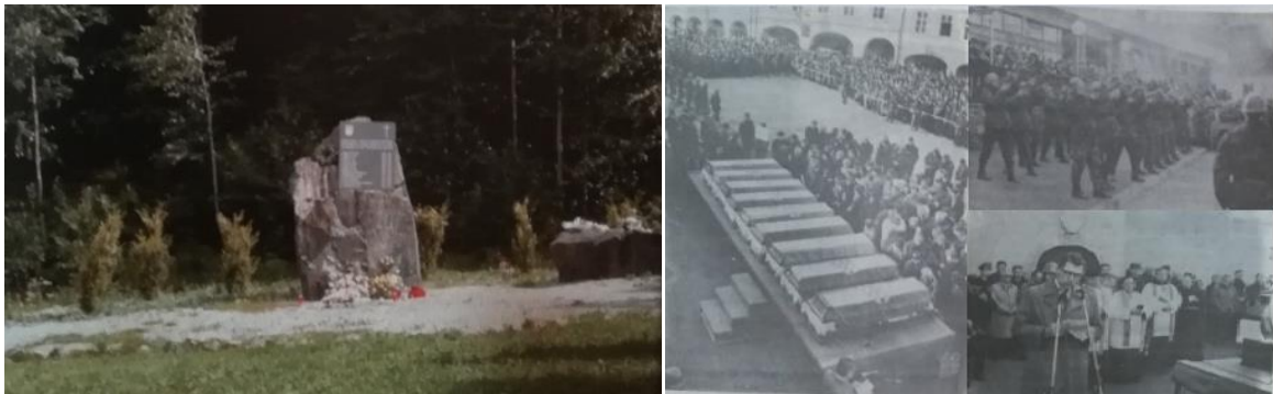
Slike 9. i 10. Prikaz današnjeg spomenika i posljednjeg ispraćaja poginulih na Papuku

Prosinac je za hrvatsku stranu na požeškom području krenuo s tragedijom. Dana 2. prosinca 11 hrvatskih redarstvenika upalo je u zasjedu kod „Baze“ na Papuku. „Baza“ je bila relejni centar JNA s odašiljačima, koji se nalazio na najvišem vrhu Papuka na 954metra nadmorske visine. Hrvatska vojska je „Bazu“ zauzela tijekom akcije „Papuk-91“ 13. studenog i od tada su ga vojnici 123. brigade čuvali u smjenama. Toga dana 2. prosinca 11 je redarstvenika krenulo na smjenu. Na putu do „Baze“ zapali su u klopku i dok je pomoć stigla svi su izginuli. Danas se na tome mjestu nalazi spomenik poginulim braniteljima. Od 11 poginulih devet je bilo pripadnika 123. brigade i dva pripadnika Odreda veze Glavnog stožera HV-a Samobor. Devetorici pripadnika 123. požeške brigade pripremljen je veliki posljednji ispraćaj na požeškom Trgu Svetog Trojstva od strane 123. brigade i općinskog poglavarstva. 77