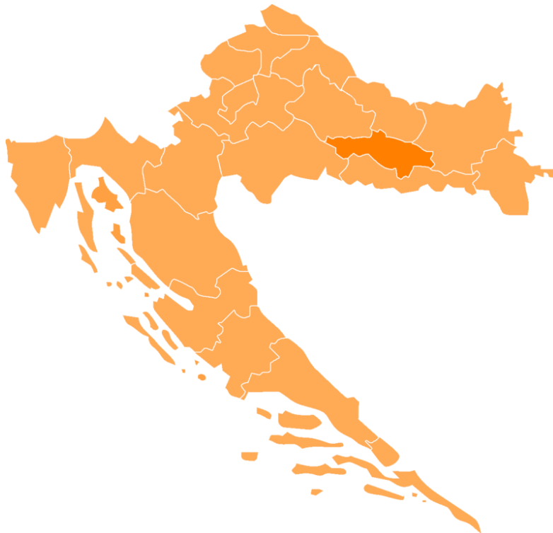
Slika 3. Smještaj Požeško-slavonske županije

Požeško-slavonska županija smjestila se u samom središtu Slavonije (slika 4). Okružena je s četirima gorama– Psunj, Krndija, Dilj gora i Požeškom gorom – te planinom Papuk. Gore koje okružuju županiju su prirodna barijera koja dijeli Slavoniju na istočni i zapadni dio. Zlatno strateško pravilo u ratovanju je držati gore i šume pa su tako i ove gore unutar ravne Slavonije za rata bile jedna od najvažnijih strateških lokacija. Tko je kontrolirao brda kontrolirao je i putove koji su išli s obje strane padina te doline i imao je položaj za stacioniranje topovskih snaga zbog većeg dometa, odakle bi se onda lakše moglo gađati dalje protivničke položaje. Važnost brdskih položaja na ovome području znala je i JNA koja je po brdima izgradila brojne manje vojne radio centre i manje vojne baze. Većinu tih objekata je do Božića 1991. zauzela Hrvatska vojska. Nakon predaja vojarni u Požegi i Bjelovaru, brojne je šumske objekte napustila JNA koja je prije i za vrijeme povlačenja sa sobom odnijela veći dio opreme koji se nalazio po centrima.