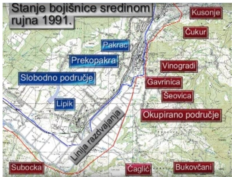
Slika 8. Prikaz bojišta u općini Pakrac u rujnu 1991.godine

Tijekom 16. i 17. kolovoza veliki broj srpskih obitelji odlazi iz grada. Nakon njihova odlaska u kuće ulaze naoružani pobunjeni Srbi koji su imali izrađenu taktiku za napad na grad. Uvečer 18. kolovoza srpske snage počinju s opsadom grada tražeći predaju policijske postaje. Budući da policija odbija predati postaju, pobunjenici 19. kolovoza ujutro u 5 sati počinju s minobacačkim i puščanim napadom na Postaju i ostale važnije zgrade u gradu. Policiji se u obrani Postaje i grada priključuju naoružani građani i zajedno odbijaju napad pobunjenika koji se povlače na istočni dio grada – Kalvariju, Vinograde i Gavrinicu – odakle su imali savršeni položaj za svakovrsne oružane napade raznim naoružanjem, od minobacača, snajpera do strojica. Uvečer u pomoć policiji dolaze specijalci iz Bjelovara i Zagreba. Vidjevši dolazak specijalaca, pobunjenici se povlače u okolna srpska sela odakle nastavljaju s minobacačkim napadima na Pakrac i Prekopakru. Tijekom 21. kolovoza intenzivne borbe lagano prestaju i specijalci odlaze iz grada na druga ratom zahvaćena područja. 54