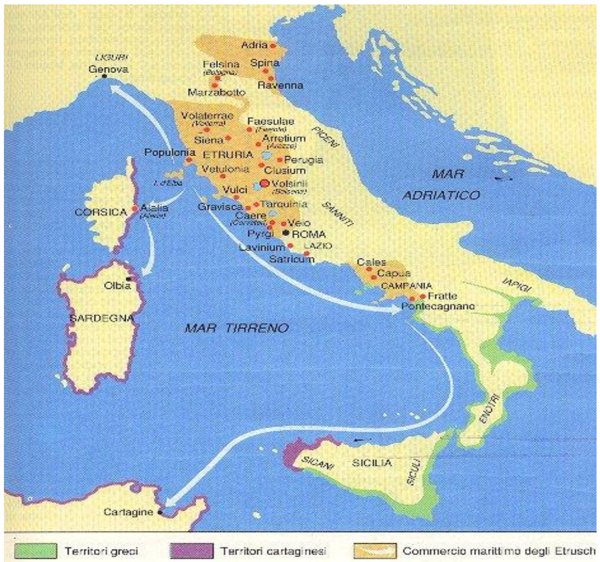
Slika 1. Karta etrušćanskih gradova (preuzeto 25.11.2018)

Na sjevernom dijelu Italije, područje današnje pokrajine Emilia-Romagna spada pod treću zonu koju su naseljavali Etrušćani. Kako je veliki dio poluotoka bio močvarno područje, to se tlo koristilo za proizvodnju poljoprivrednih proizvoda, jer je bilo bogato plodnim tlom i nalazilo se uz Padsku nizinu. Kasnije tamo nastaju dva najvažnija etrušćanska trgovišta, a to su Spina i Adria o kojima će kasnije biti više rečeno.