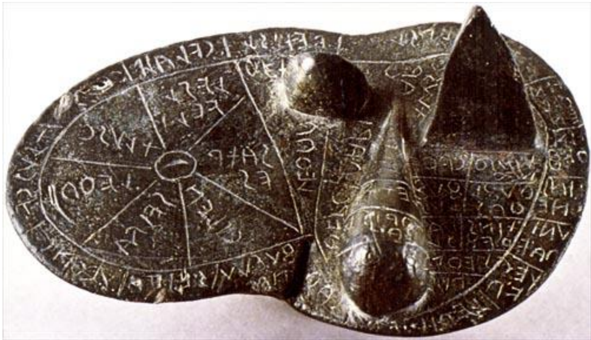
Slika 3. Disciplina Etrusca (preuzeto 25.11.2018.)