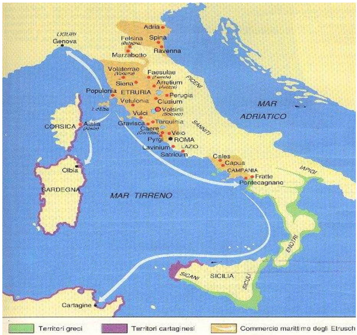
Slika 1. Karta etrušćanskih gradova (preuzeto 25.11.2018)

Na sjevernom dijelu Italije, područje današnje pokrajine Emilia-Romagna spada pod treću zonu koju su naseljavali Etrušćani. Kako je veliki dio poluotoka bio močvarno područje, to se tlo koristilo za proizvodnju poljoprivrednih proizvoda, jer je bilo bogato plodnim tlom i nalazilo se uz Padsku nizinu. Kasnije tamo nastaju dva najvažnija etrušćanska trgovišta, a to su Spina i Adria o kojima će kasnije biti više rečeno.