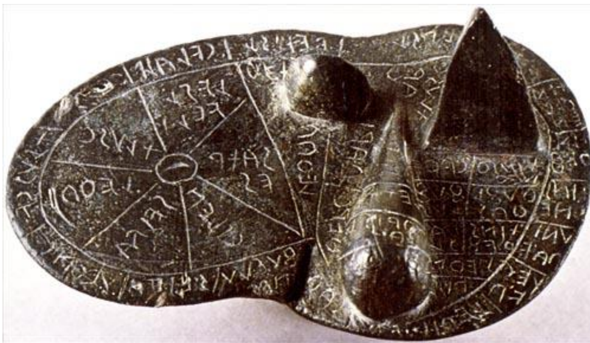
Slika 3. Disciplina Etrusca (preuzeto 25.11.2018.)