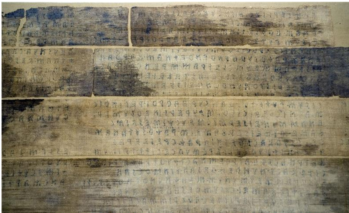
Slika 2. Zagrebačka lanena knjiga (preuzeto 25.11.2018.)