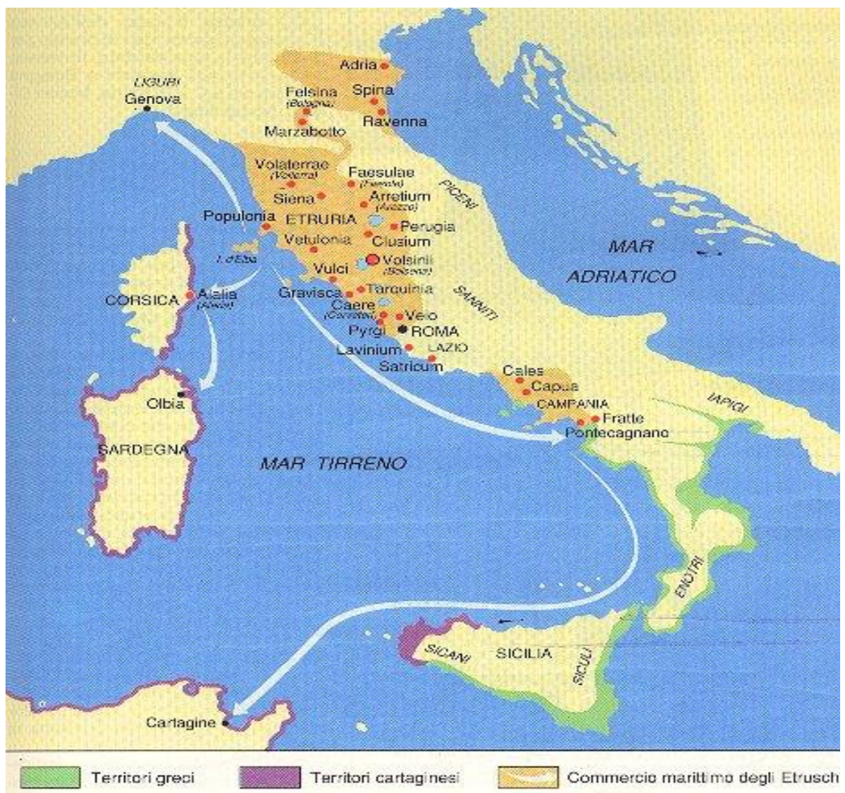
Slika 1. Karta etrušćanskih gradova (preuzeto 25.11.2018)

Na sjevernom dijelu Italije, područje današnje pokrajine Emilia-Romagna spada pod treću zonu koju su naseljavali Etrušćani. Kako je veliki dio poluotoka bio močvarno područje, to se tlo koristilo za proizvodnju poljoprivrednih proizvoda, jer je bilo bogato plodnim tlom i nalazilo se uz Padsku nizinu. Kasnije tamo nastaju dva najvažnija etrušćanska trgovišta, a to su Spina i Adria o kojima će kasnije biti više rečeno.