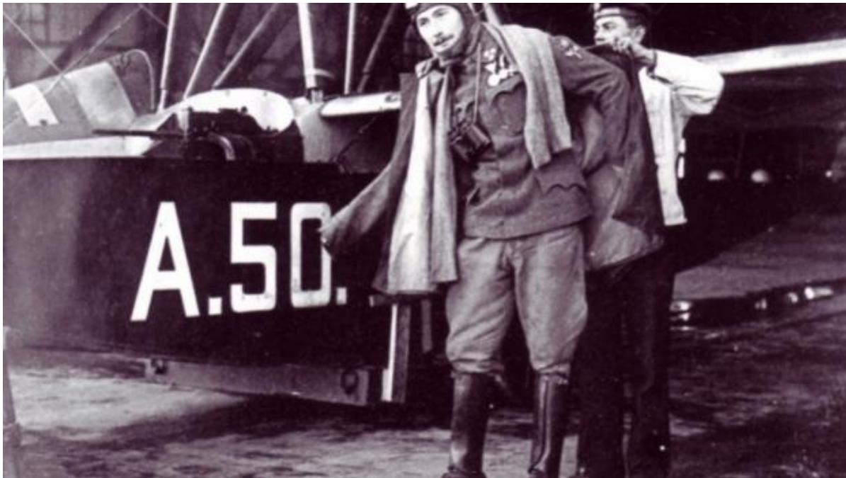
Slika 4. Viktor Klobučar - Rukavina od Bunića

Izvor: http://www.regionalexpress.hr/site/more/pomorski-arsenal-u-puli-1856.-1918.-20.-dio , posjećeno 16. rujna 2018.