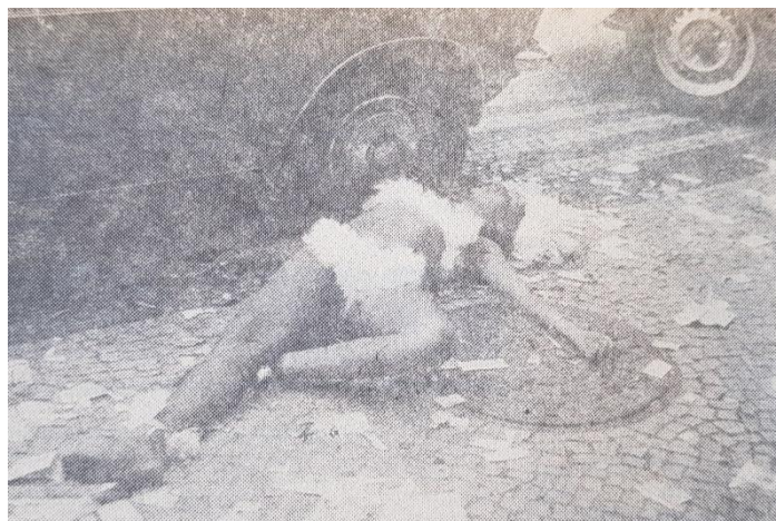
Slika 4. Karnevalska plesačica usnula na golom asfaltu Izvor: „Tamna strana Rio-karnevala“, Vikend , 25.3.1977., 28.

U časopisu „Vikend“ često se mogla pronaći reportaža ili interesantan članak o ljudima, prostorima i običajima dalekim Jugoslaviji, no nisu svi pisali o tim krajevima kao bajkovitim, prekrasnim mjestima bez mana. Tako se 1977., primjerice, govori o karnevalu u Rio de Janeiru. Naslov članka koji prekriva čitavu stranicu glasi „Tamna strana Rio-karnevala“, a u tekstu se detaljno govori o problemima koji prate karneval, o onome što se događa iza kulisa inače zabavne priredbe. Konkretnije, članak navodi kako je 1977. godine na karnevalu u Rio de Janeiru poginulo 245 osoba, dok je hospitalizirano njih čak 28.000. Usto, reporter javlja o neopisivom smradu i prljavštini iz sporednih ulica, nedostatku javnih zahoda, ljudima koji spavaju po pločnicima te sirotinji koja se iz favela spušta na karneval kako bi na barem tih nekoliko dana zaboravila na jad života. Međutim, čim se karneval privede kraju, svi se oni vraćaju u svoja sirotinjska naselja, jednako jadni i siromašni kao i ranije. Jedini koji su se među njima makar privremeno usrećili su oni koji su džepove napunili tuđim nakitom, novcem i ostalim ukradenim ili pronađenim predmetima. 50 Na slici 4 je prikazana karnevalska plesačica kako spava ili leži u nesvijesti na karnevalu u Rio de Janeiru.