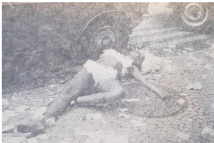
Slika 4. Karnevalska plesačica usnula na golom asfaltu

U časopisu „Vikend“ često se mogla pronaći reportaža ili interesantan članak o ljudima, prostorima i običajima dalekim Jugoslaviji, no nisu svi pisali o tim krajevima kao bajkovitim, prekrasnim mjestima bez mana. Tako se 1977., primjerice, govori o karnevalu u Rio de Janeiru. Naslov članka koji prekriva čitavu stranicu glasi „Tamna strana Rio-karnevala“, a u tekstu se detaljno govori o problemima koji prate karneval, o onome što se događa iza kulisa inače zabavne priredbe. Konkretnije, članak navodi kako je 1977. godine na karnevalu u Rio de Janeiru poginulo 245 osoba, dok je hospitalizirano njih čak 28.000. Usto, reporter javlja o neopisivom smradu i prljavštini iz sporednih ulica, nedostatku javnih zahoda, ljudima koji spavaju po pločnicima te sirotinji koja se iz favela spušta na karneval kako bi na barem tih nekoliko dana zaboravila na jad života. Međutim, čim se karneval privede kraju, svi se oni vraćaju u svoja sirotinjska naselja, jednako jadni i siromašni kao i ranije. Jedini koji su se među njima makar privremeno usrećili su oni koji su džepove napunili tuđim nakitom, novcem i ostalim ukradenim ili pronađenim predmetima. 50 Na slici 4 je prikazana karnevalska plesačica kako spava ili leži u nesvijesti na karnevalu u Rio de Janeiru.