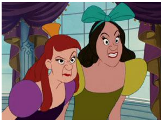
Slika 4. Polusestre Anastasia i Drizela

Disney je i u ovom slučaju polusestre prikazivao prizorima i njihovim djelima, a na početku ih je ukratko predstavio: „Njegova druga žena bila je iz dobre obitelji i imala je dvije kćeri Pepeljuginih godina. Zvale su se Anastazija i Drizela. (...) Obiteljsko bogatstvo su potrošile tašte i sebične polusestre“ (Disney 1950).