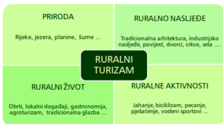
Slika 1: Koncept ruralnog turizma

Prema Svjetskoj turističkoj organizaciji, ruralni turizam temelji se na prirodnim resursima, ruralnom nasljeđu, ruralnom načinu života i ruralnim aktivnostima, odnosno, aktivnostima u ruralnom prostoru: