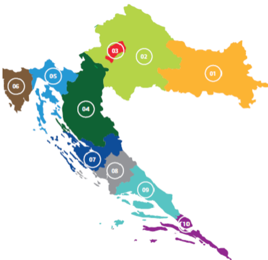
Slika 3. Podjela Hrvatske po regijama s aspekta ruralnog turizma