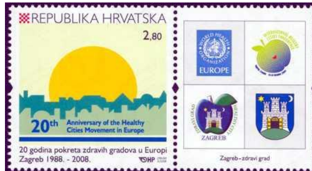
Slika 2. Primjer komercijalne marke