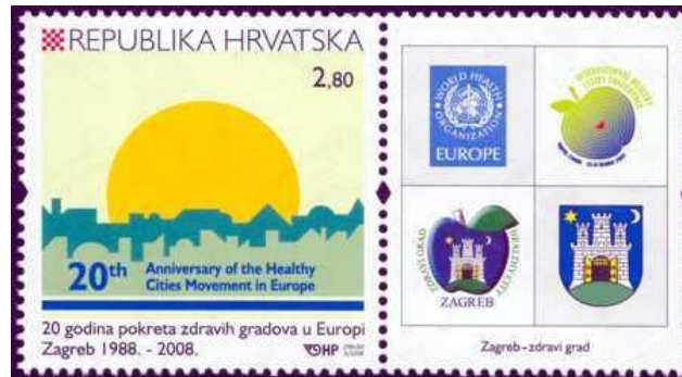
Slika 2. Primjer komercijalne marke