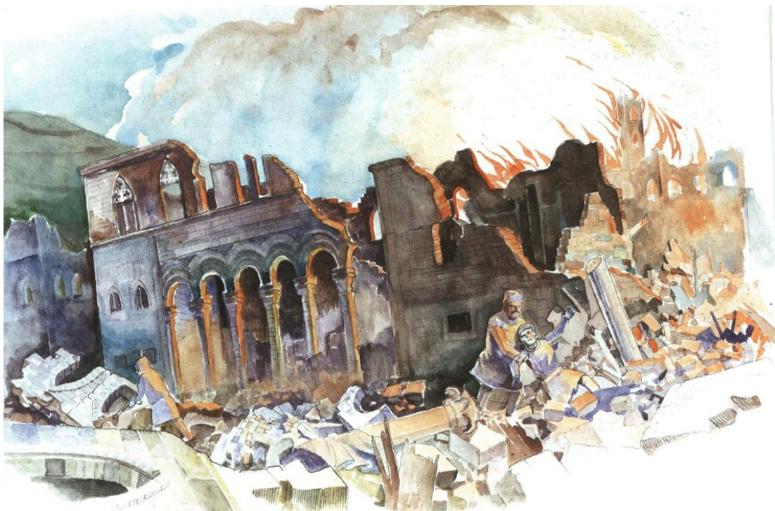
Slika 3.: Potres u Dubrovniku 1667. godine

Dubrovnik je 1667. zahvatio i veliki potres (slika 3.) koji je uzrokovao brojne štete.