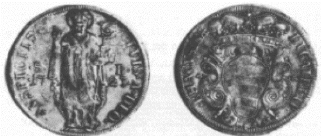
Slika 2.: Dubrovački dukat