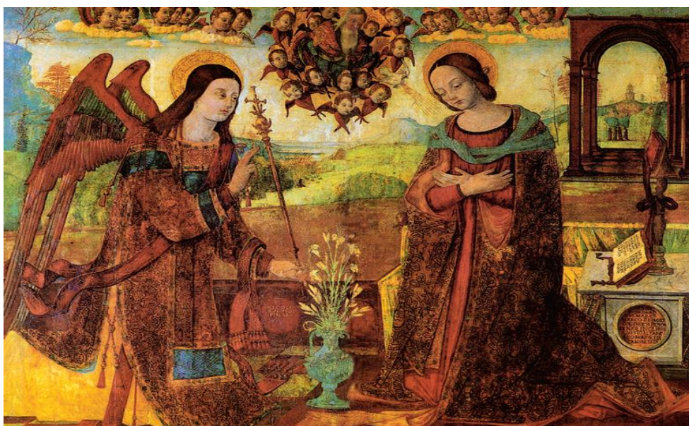
Slika 5.: Navještenje , Nikola Božidarević