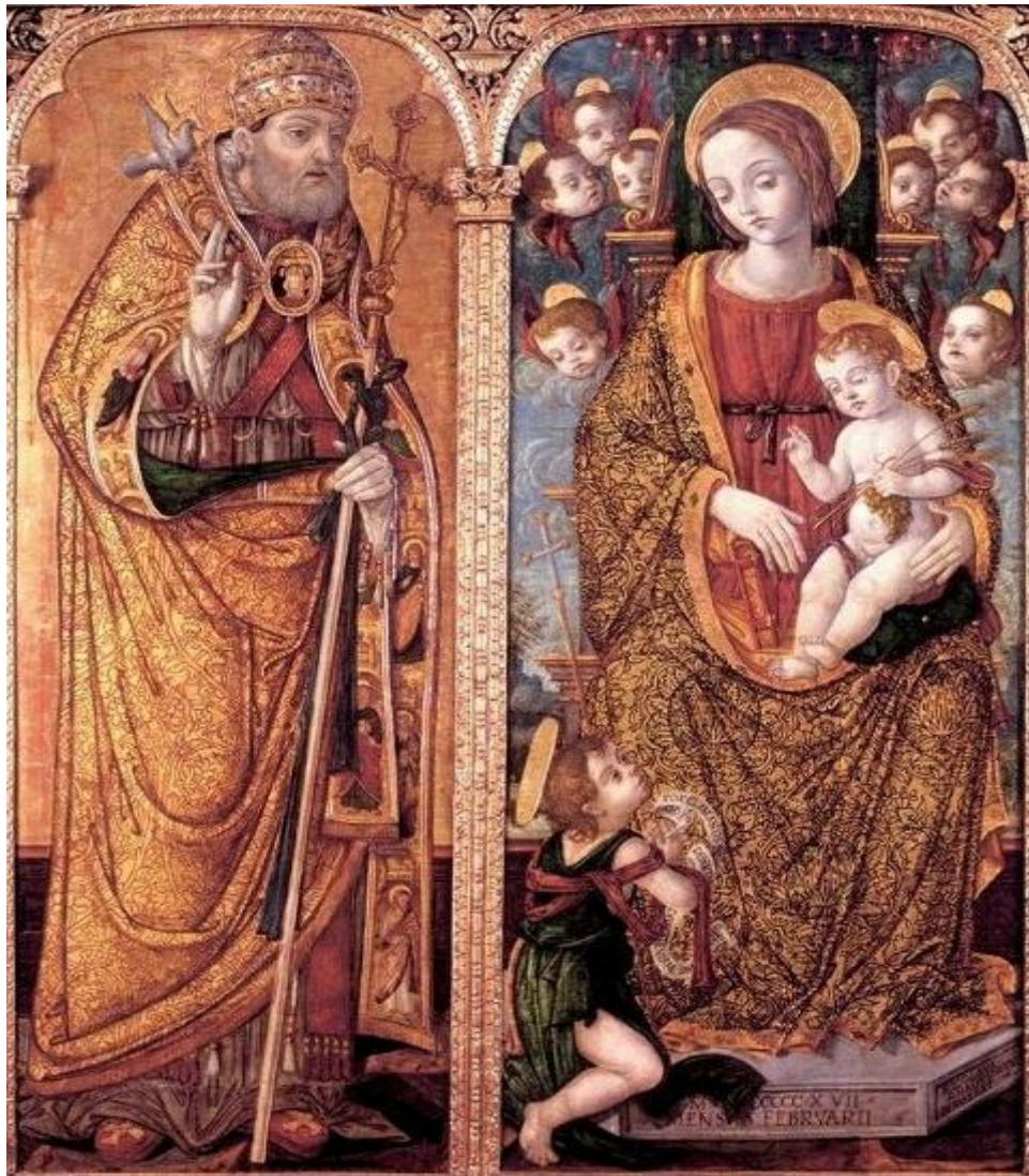
Slika 6.: „Detalj poliptiha iz crkve Gospe na Dančama“ u Dubrovniku, Nikola Božidarević