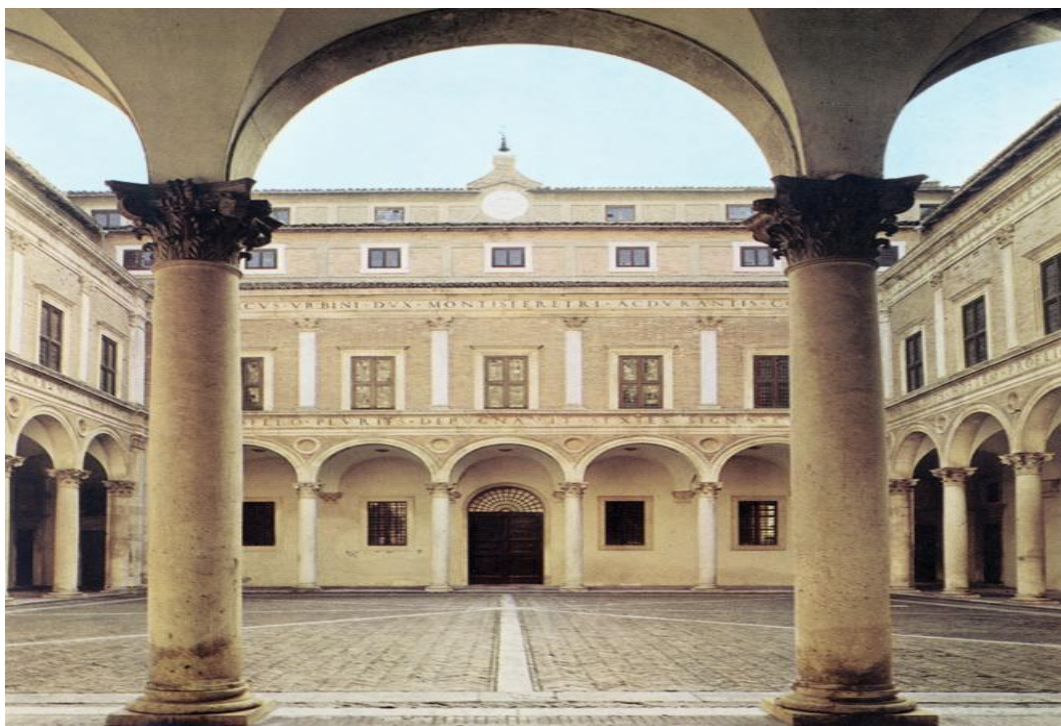
Slika 4.: Dvorište vojvodske palače u Urbinu (1455.-80.), Lucijan Vranjanin