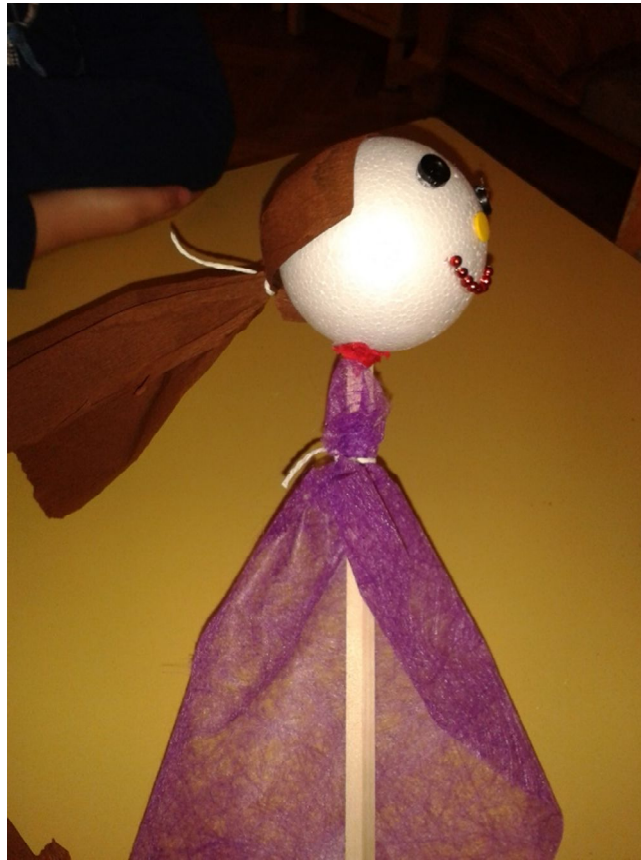
Slika 9 P.L. 5 godina, štapna lutka