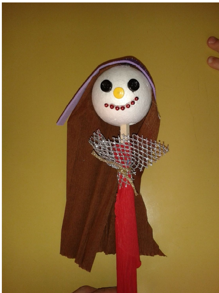
Slika 10 V.K. 5 godina, štapna lutka