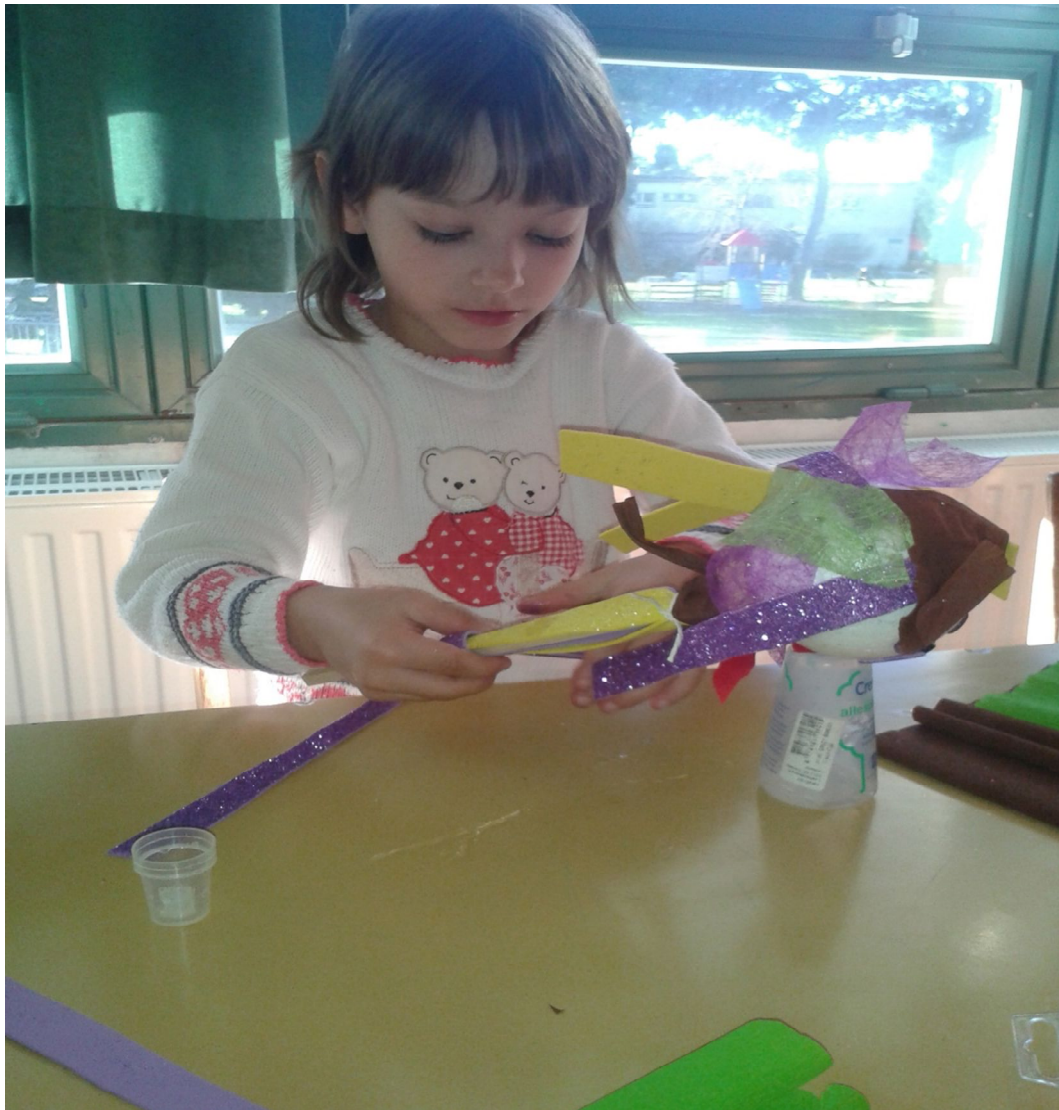
Slika 12 H.S. 4 godine, štapna lutka