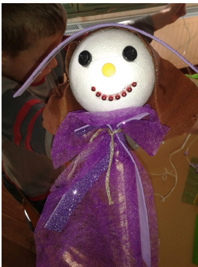
Slika 8 A.P. 5 godina, štapna lutka

Tijekom izrade lutaka prevladavala je vesela atmosfera, djeca su se trudila napraviti što bolje i ljepše lutke. Lijepljenje sitnih detalja kao što su nos, oči i kosa zahtijevalo je preciznost i razvijenu finu motoriku šake, nekoj djeci to je predstavljalo problem pa su tražila moju pomoć.