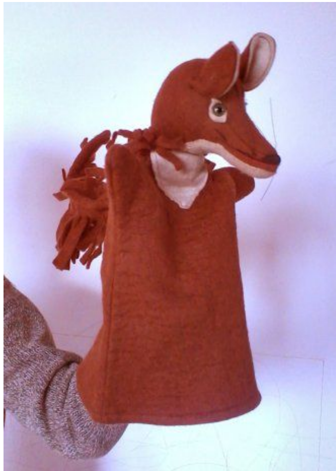
Slika 1. Ginjol

Sudbina ove lutke nastaje i nestaje u trenutku kad navučena na ruku lutkara poput rukavice progovara sebi svojstvenim jezikom, jezikom lutke što ga razumiju svi ljudi, jer osjećaju da to biće bez identiteta koje započinje svoj život na pozornici u jednom trenutku opravdati svrhu svog postojanja.