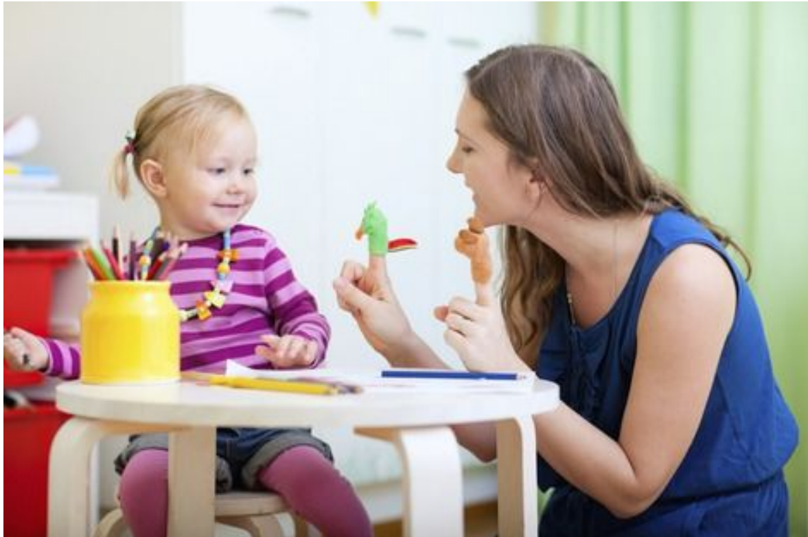
Slika 6. Odgajatelj i dijete