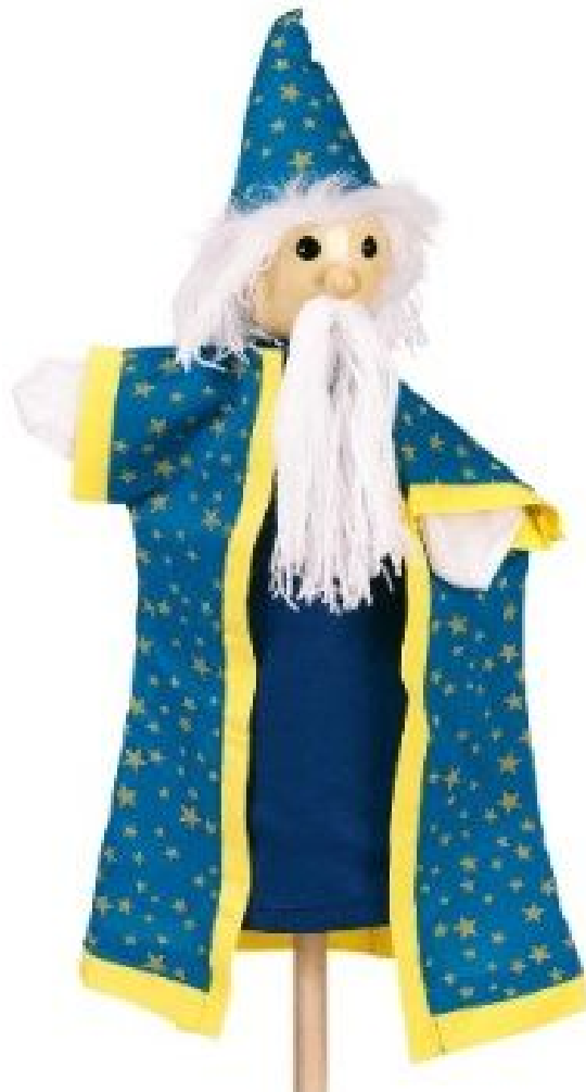
Slika 4. Javajka

( http://www.tportal.hr/kultura/kazaliste/83208/Dolaskom-Obrazcovljevog-kazalista-brisemo-povijesnu-nepravdu.html 26.8.2015. )