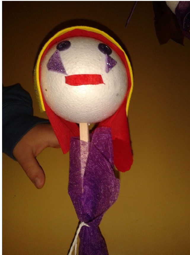
Slika 16 S.P. 4 godine, štapna lutka