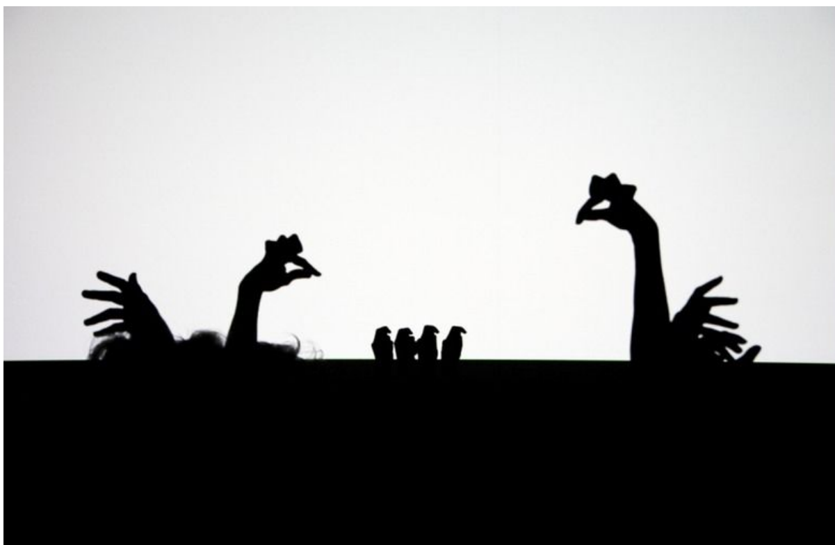
Slika 3. Lutka sjena