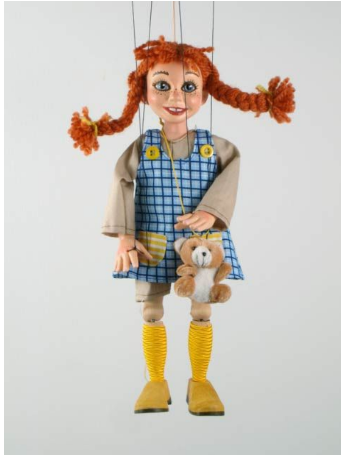
Slika 5: Marioneta

Naziv marioneta za lutku na koncima prvo se javio u Italiji. U Veneciji se slavio veliki praznik po nazivom Festa delle Marie , a održavao se kao uspomena na događaj kada su tršćanski mladići zarobili 12 djevojaka, ali su ih Venecijanci uspjeli osloboditi. Na taj bi dan svake godine kroz grad nosili 12 djevojaka u svečanoj odjeći, s godinama ih se zamijenilo velikim drvenim lutkama koje su se zvale Marie de lengo , odnosno „drvene Marije“, a male kopije tih lutaka trgovci su prodavali pod nazivom marionete. (Županić – Benić, 2009.)