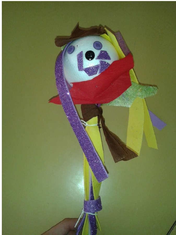
Slika 15 E.H. 4 godine, štapna lutka