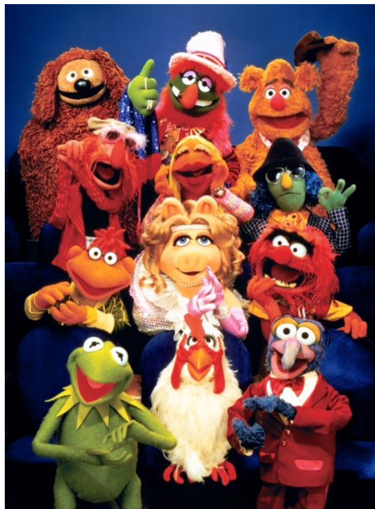
Slika 2. Zijevalica ( Muppet show )

Zijevalica je ručna lutka koja se poput ginjola animira navlačenjem na ruku, ali ona za razliku od ginjola otvara i zatvara usta. Upotrebljava se kad je kod karaktera najizraženiji govor ili kada govor nosi veliku poruku. Zijevalicu također odlikuju različite karakterne osobine. Njome prikazujemo i ljudske i životinjske likove, kao i različita izmišljena bića. (Županić – Benić, 2009.).