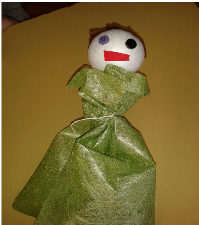
Slika 11 M.L. 5 godina, štapna lutka