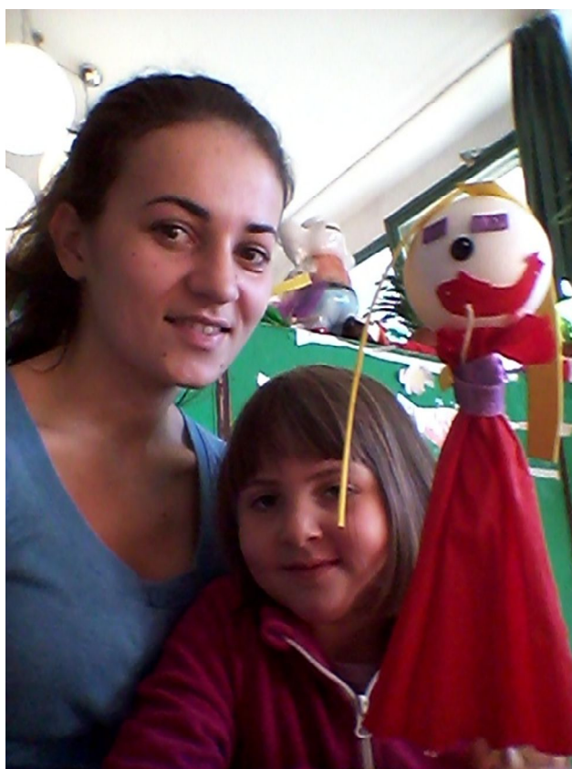
Slika 14 N.D. 5 godina, štapna lutka