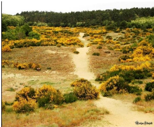
Slika 3: Đurđevački pijesci

rijedak primjer to područje proglašeno 1995. godine park-šumom. Proces pošumljavanja bio je otežan pa dijelom Pijesaka prevladava pješčarska flora, biljke koje su se same udomile ili su se tijekom procesa pošumljavanja raširile. Zbog ljudskog djelovanja njihov broj je s godinama sve manji. Da bi se ovaj jedinstven prostor, ne samo u Hrvatskoj nego i šire očuvao 1962. godine proglašen je zaštićenim kao geografsko-botanički rezervat. Glavni je cilj bio održati i sačuvati zajednicu trava, mahovina i lišajeva koji prevladavaju samo na tom području. Uz biljke veliki je i broj životinja koje su specifične za to područje, poput kukaca, paučnjaka i preko 300 vrsta leptira.