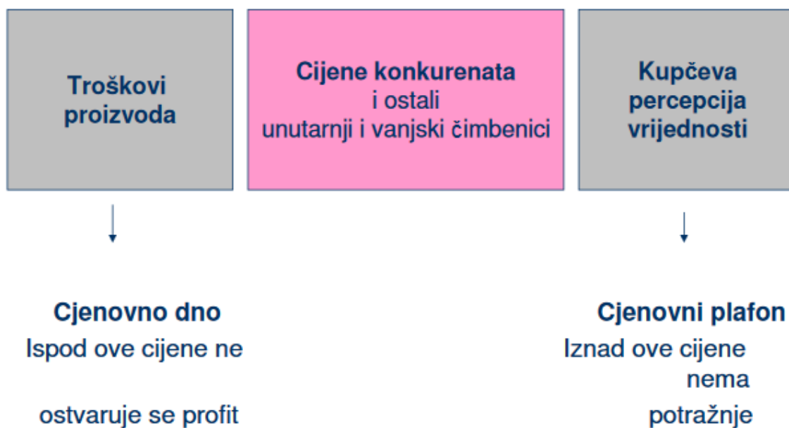
Slika 1. Vodeći elementi koji utječu na određivanje cijena