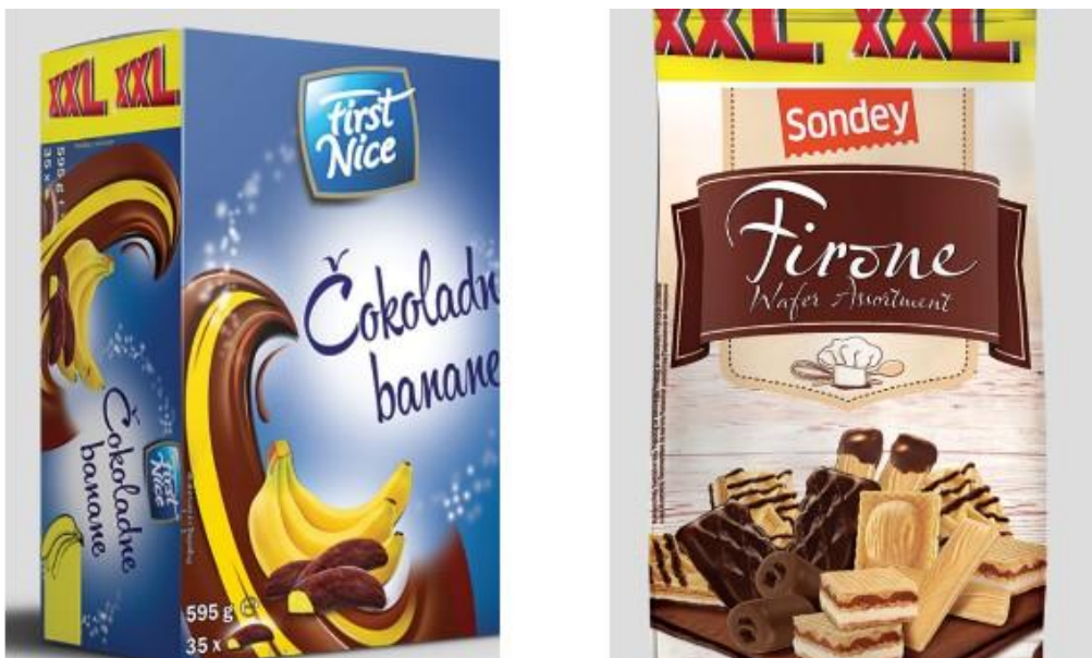
Slika 7. Velika pakiranja