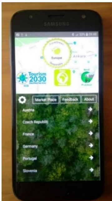
Slika 3. Aplikacija Travel Green Europe