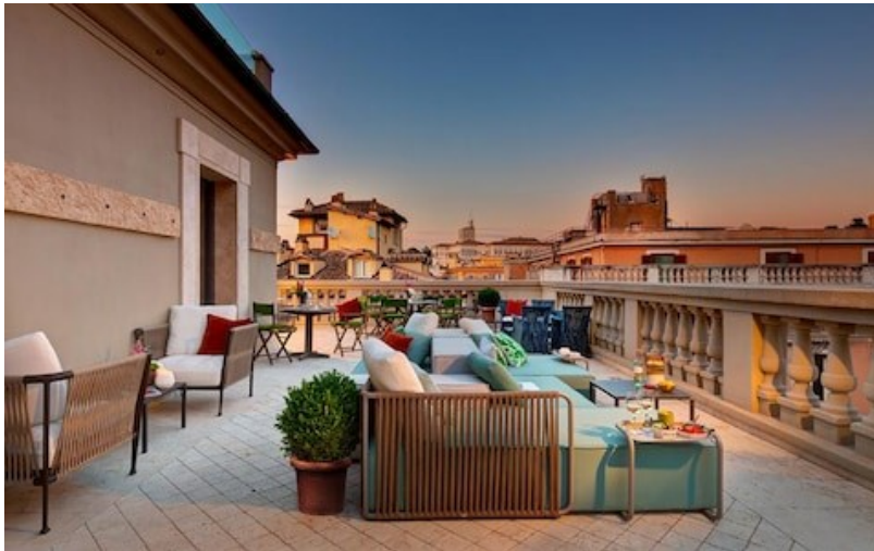
Slika 4. Dizajniran smještajni kapacitet za city break klijente