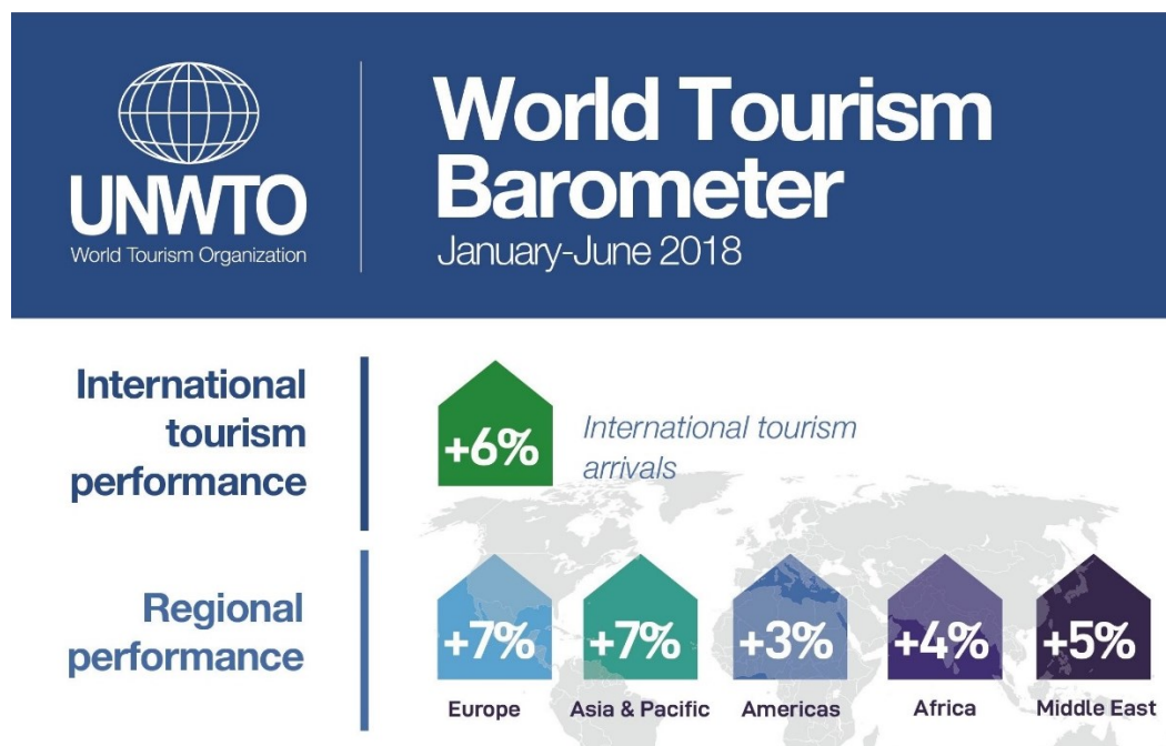
Slika 5. Statistika međunarodnih turističkih dolazaka (01 - 06.2018.)

Izvor: WYSE travel confederation, International tourism maintains strong momentum, dostupno na internetskoj stranici https://www.wysetc.org/2018/10/international-tourism-maintains-strong-momentum/