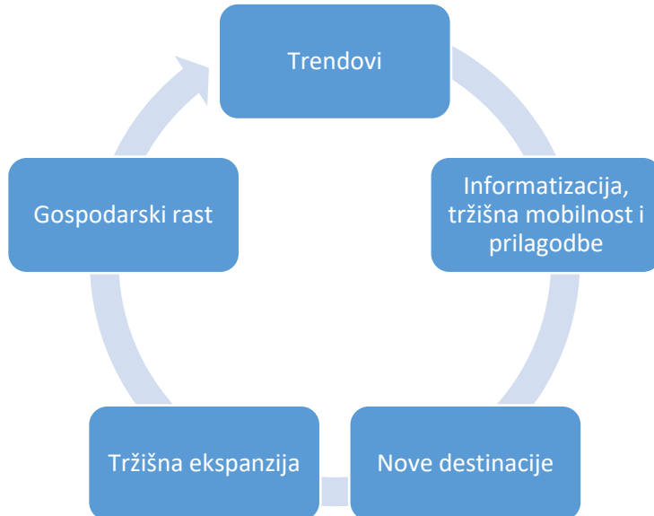
Shema 1. Uzročno - posljedične veze u međunarodnom turizmu

Izvor: Vlastita izrada autora na temelju postavljenih hipoteza