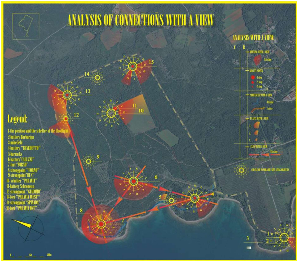
Slika.4. Prikaz rute turističkog obilaska mreže vojnih utvrdi u okolici područja Bala