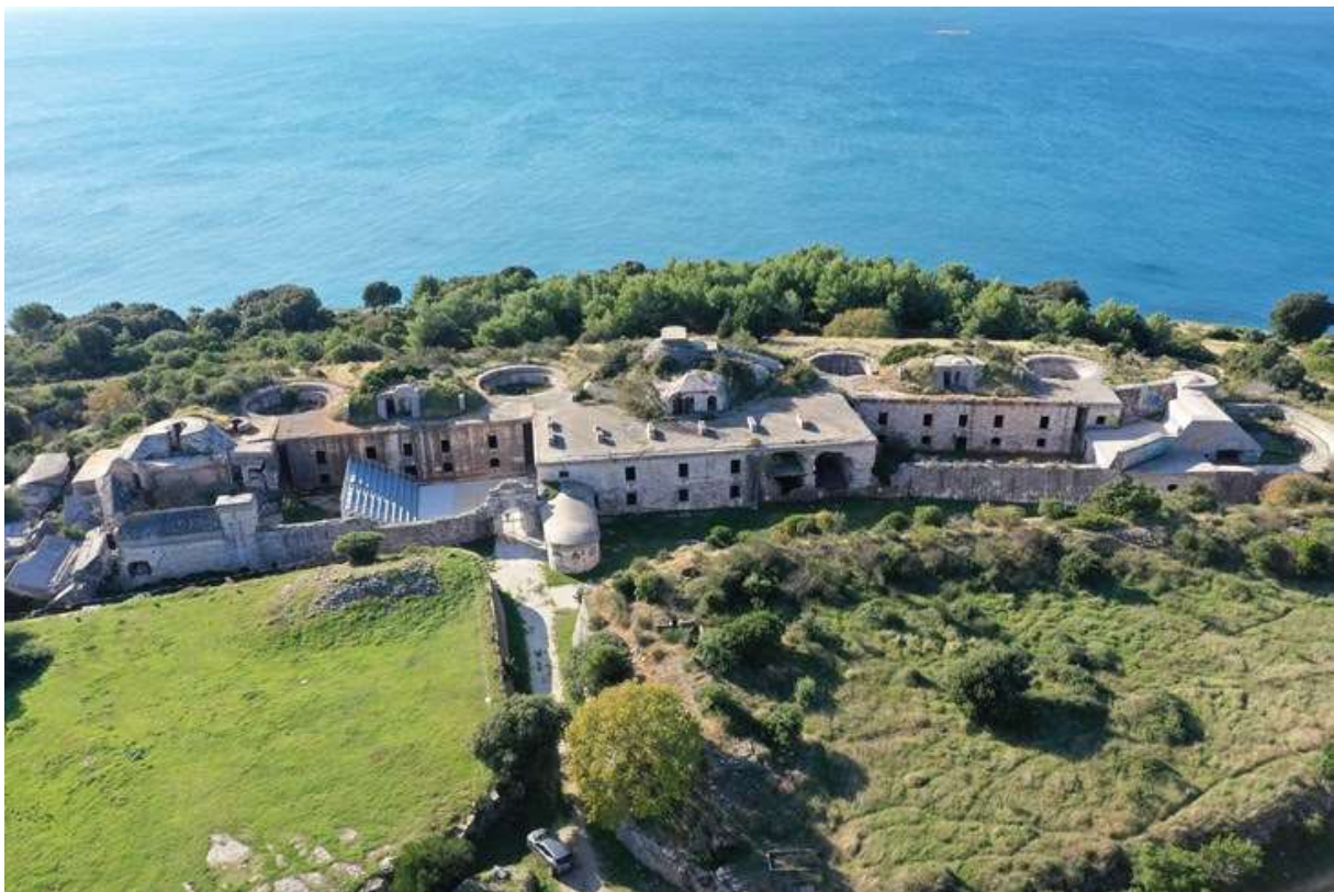
Slika 2. Tvrđava Fort Forno, Bale

Glavno mjesto događanja su Bale, prostor i područje poznato po pronalasku kostiju od dinosaurusu, odnosno gradić kojeg su pohodile horde i horde osvajača različitog podrijetla, kulture, jezika i običaja. Isti su s druge strane svojim boravkom u njemu zauvijek ostavljali djelić sebe i time izgradili i svoj povijesni i kulturološki pečat. Bale su destinacija iznimne i bogate prošlosti ali i prostor u kojem se osjeća duh prohujalog vremena, koji i dalje tu obitava.