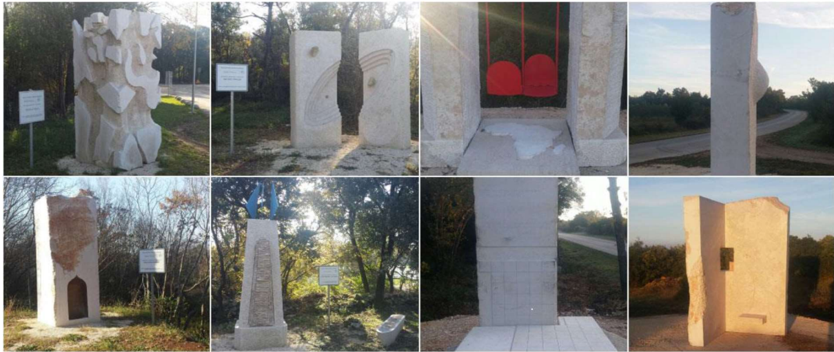
Slika 6. Skulpture postavljene na cesti prema kampu Mon Perin