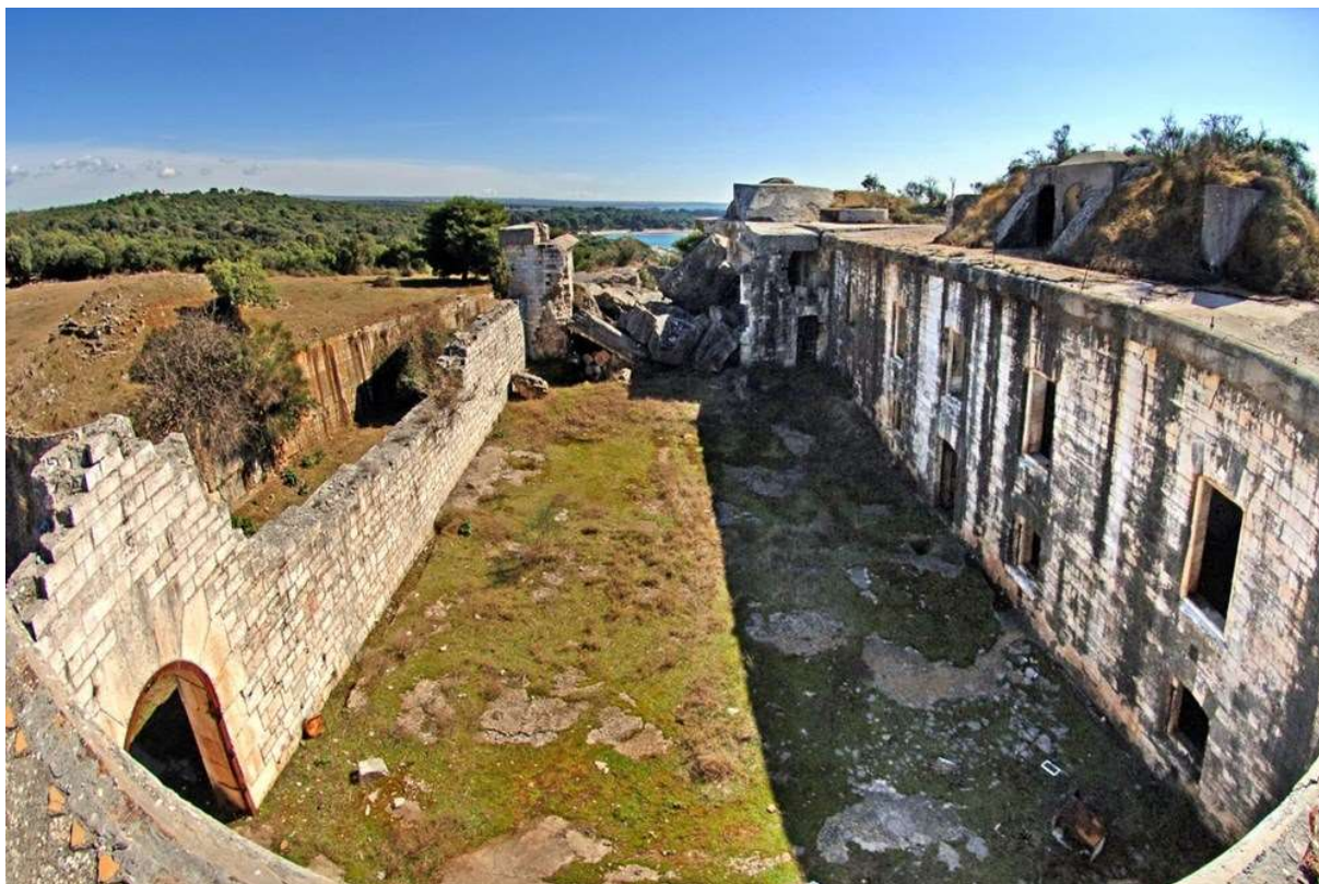
Slike 5.1. i 5.2. Tvrđava San Benedetto, Bale