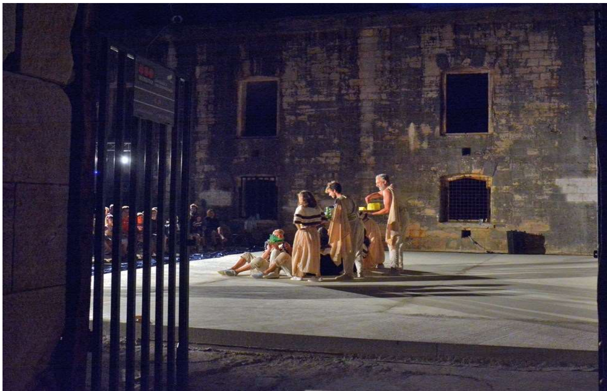
Slike 3.1., 3.2., 3.3. Predstava „Istarske priče“, Utvrda Fort Forno, Bale