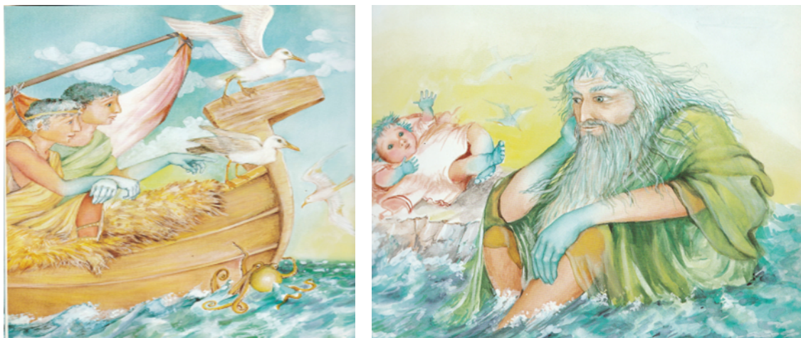
Slika 2. Motiv – braća, nono Borej i beba

Osvrnuvši se na ilustracije u priči Burrra, valja malo detaljnije reći nešto o tome. U prvom tzv. segmentu ove priče, pod nazivom „Kako je Bura dobila ime“, ilustrativno je prikazan starogrčki bog vjetera koji puše prema moru – Boreas. Budući da se u okviru ovoga segmenta priče spominju još i Boreasova dva sina – mornara na brodu „Argos“, ilustrativno su prikazana i ta dva sina koja sjede na spomenutom brodu. Jednom od ta dva sina rodila se kćer Bura, koja je ime dobila po svom nonotu Boreju, pa je ispod teksta prikazana ilustracija bebe.