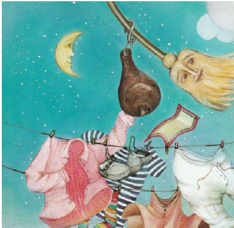
Slika 4. Bura ima metlu