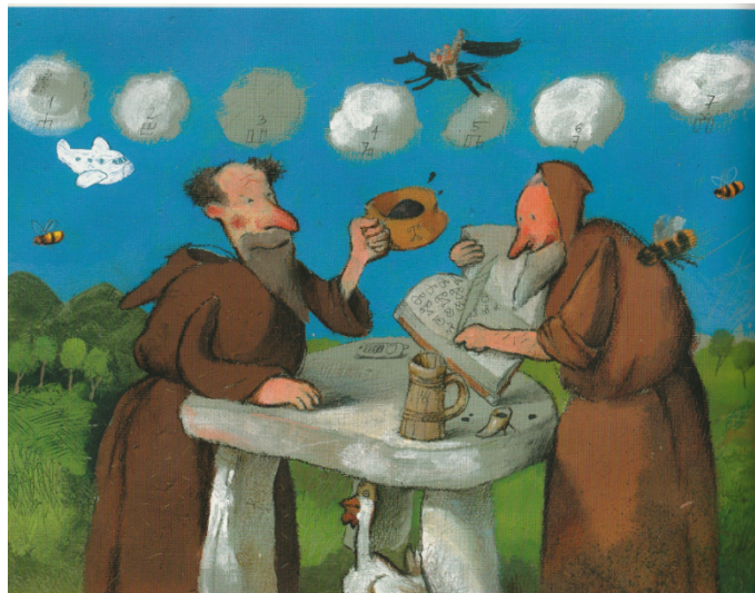
Slika 10. Dvojica časnih staraca

Tamo su dvojica časnih staraca, umačući guščja pera u crnilo – a onda i kruh u vrčve vina – listala debele, zakovicama optočene knjige.