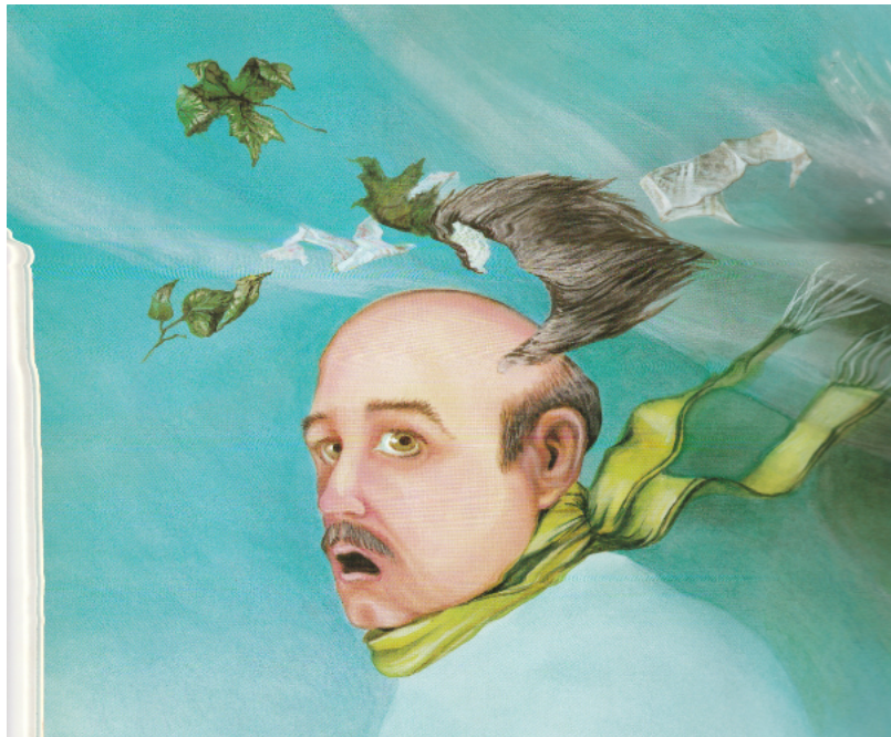
Slika 3. Bura podiže periku