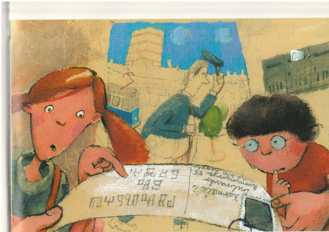
Slika 8. Poštar i njegova torba, brat i sestra čitaju razglednicu

Nadalje, osvrnuvši se na likovnost u priči „Mali glagoljaši“, valja napomenuti da ilustracije u potpunosti prati tekst odnosno priča. Primjerice, na početku se spominje poštar i njegova velika torba, a zatim kako brat i sestra gledaju i čude se tekstu na razglednici koju im je poštar dostavio.