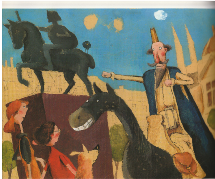
Slika 9. Zvonimir jaše na konju dok brat i sestra gledaju u njega