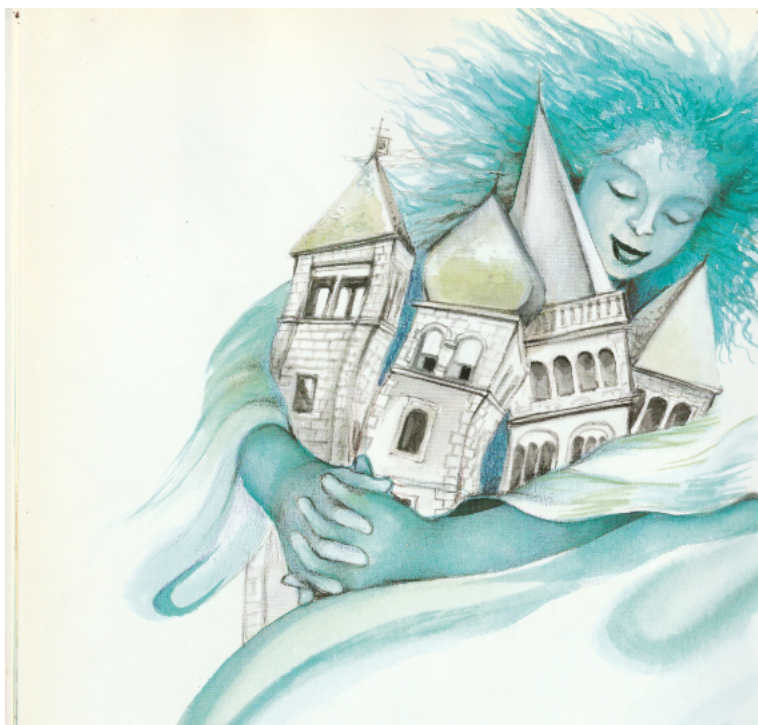
Slika 5. Četiri zvonika na Rabu

Osim ilustracije koja prikazuje Senj i snagu bure koja se tamo može doživjeti, idući ilustrativni prikaz u priči jesu četiri zvonika na Rabu, koje je bura stisnula i obgrlila. Dalje se prikazuje kako bura starijoj ženi podiže haljinu, dok se oko nje nalaze razbacane padele (lonci).