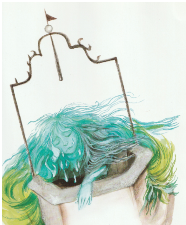
Slika 6. Bura plače iznad Bunara

Prikazana je i Istra, Hum, simbolično su prikazane i ovce i tunel Učka. Djeci će se možda „probuditi“ emocije kada ugledaju ilustraciju na kojoj Bura plače iznad bunara u Pazinu jer ne može u njega, budući da je tamo Jama.