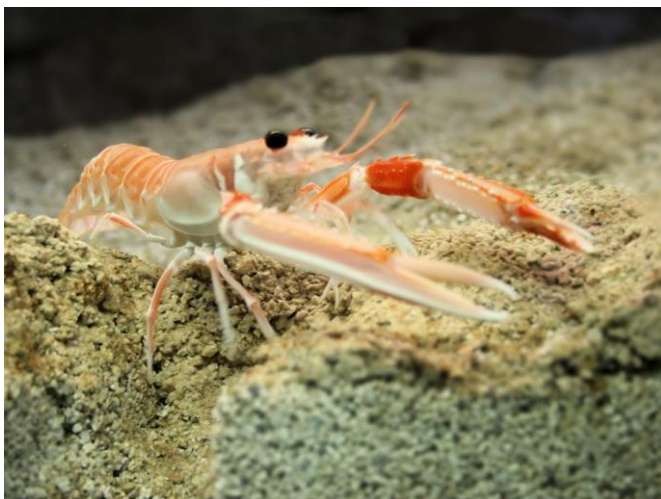
Slika 18 – Škamp