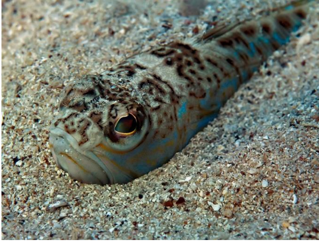
Slika 30 – Pauk bijelac