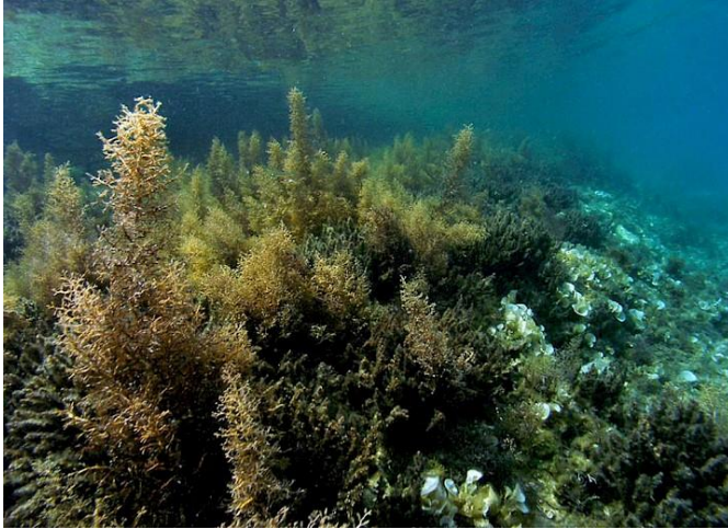
Slika 38 – Cystoseira spp.