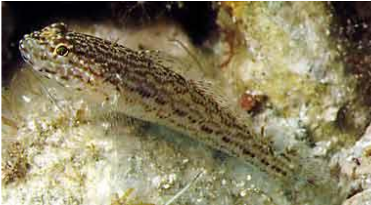
Slika 29 – Glavočić bjelčić

Glavoč bjelčić je riba s gotovo ovalnom repnom perajom. Prva i druga leđna peraja su otprilike jednake visine, a između njih se nalazi razmak. Oči su velike i nalaze se na tjemenu glave. Riba je žuto-smeđe, žuto-sive ili prljavo bijele boje. Na glavi i tijelu ima od 3 do 4 reda smečkastih točkica, a tamnija se pruga proteže i po glavi i prelazi preko očiju. Može narasti do 10 centimetara (Turk, 2011). Stanovnik je plitkog infralitorala, pa ju često možemo vidjeti kako slobodno pliva u plićaku naših plaža.