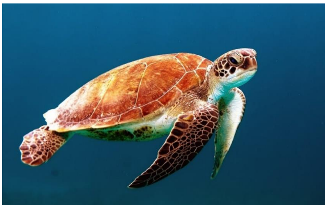
Slika 33 – Glavata želva