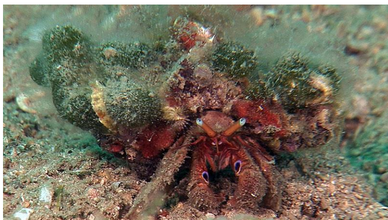
Slika 20 – Rak samac

U tog su raka kliješta otprilike jednakih dimenzija. Lijeva su malo jača. Oči mu se nalaze na stapkama, a antene su duge koliko i kliješta. Životinja je boje hrđe ili opeke, stapke su narančaste, oči svjetlomodne, a antene crvene. Može narasti do 3 centimetra. Rak samac skriva svoj stražnji, meki dio tijela u prazne kućice puževa. Najčešće se nalazi na dubinama između 15 i 30 metara, osobito na muljevitom dnu (Turk, 2011).