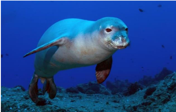
Slika 35 – Sredozemna medvjedica

Sredozemna medvjedica pripada među najveće vrste tuljana. Može narasti do 2,5 metra. Ima svojstvenu veliku okruglu glavu s kratkom njuškom i velikim okruglim očima. Na njuški se nalaze dugi brkovi. Nema uške. „Tijelo je zdepasto, na leđima sivo-smeđe, a na trbuhu prljavobijele boje s nekoliko većih mrlja.“ (Turk, 2011:518). Sredozemna medvjedica je zbog specifičnih prebivališta, manjka hrane i prenaseljenosti obala Sredozemlja jedna od najugroženijih vrsta sisavaca na svijetu.