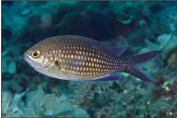
Slika 27 – Crnej

bijela. Peraje su crne. Crnej može narasti do 14 centimetara. Najčešće živi iznad livada posidonije ili na rubu podmorskih stijena (Turk, 2011).