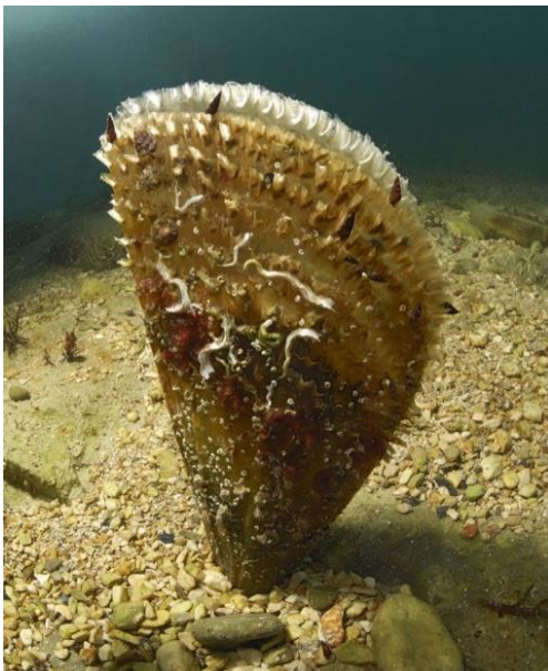
Slika 11 - Periska

Periska je najveći jadranski školjkaš koji može narasti i više od 70 centimetara. Ima oblik bedra. Ljuštura su krhke i prekrivene s otprilike 20 radijalnih ljuskastih lamela koje su više izražene u mladih školjkaša. Ljuštura je smeđecrvenkaste boje, a na donjem je dijelu svjetlija. Unutrašnjost ljuštura je glatka, svjetlucave crvenkaste boje (Turk, 2011). Periska živi zabodena u muljevito-pješčano dno na dubini većoj od 3 metra. Periska je zaštićena zakonom, zato ju ne skupljamo.