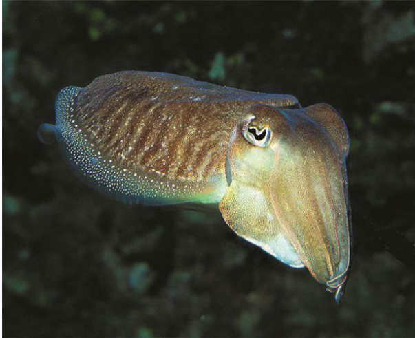
Slika 14 – Sipa

godine masovno pojavljuje u gornjem infralitoralu, a u drugoj se seli u dublju vodu. Najčešće se zadržava na pješčanom dnu.