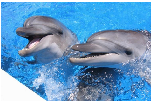
Slika 34 – Dobri dupin

Dobri dupin ima uglavnom kratku i tupu njušku („kljun“), koja u pojedinih primjeraka može biti i veoma izražena. Glava je obla, a tijelo zdepasto. Većina tijela je pepeljasto sive boje, katkad smečkastosive boje. Mladunci su prilikom rođenja dugi oko 1 metar, odrasli mužjaci do 3,5 metra, a ženke su malo manje. Odrasli mužjaci teže oko 250 kg. Najčešće se hrane glavonošcima i ribom. Prilikom lova često upotrebljavaju grupnu strategiju. Sporazumijevaju se i orijentiraju pomoću eholokacije (Turk, 2011). Zadržavaju se u blizini obala, a na otvorenom moru se rijetko pojavljuju. Te su životinje prilagodljive i pitome, pa se dobro prilagođavaju zatočeništvu.