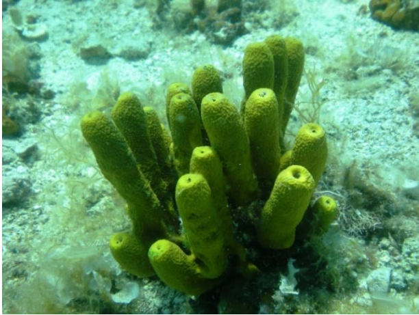
Slika 1 – Promienjiva sumporača