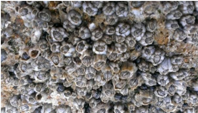
Slika 17 – Obični brumbuljak

Brumbuljak je predstavnik supralitoralnog i mediolitoralnog pojasa. Može preživjeti dulja razdoblja bez neposrednog kontakta s vodom. Pojedini račić može narasti do 1 centimetar. Njegov oklop je sastavljen od šest pločica. Unutarnje pločice imaju četiri zuba, a boja pločica je prljavobijele do sive boje (Turk, 2011).