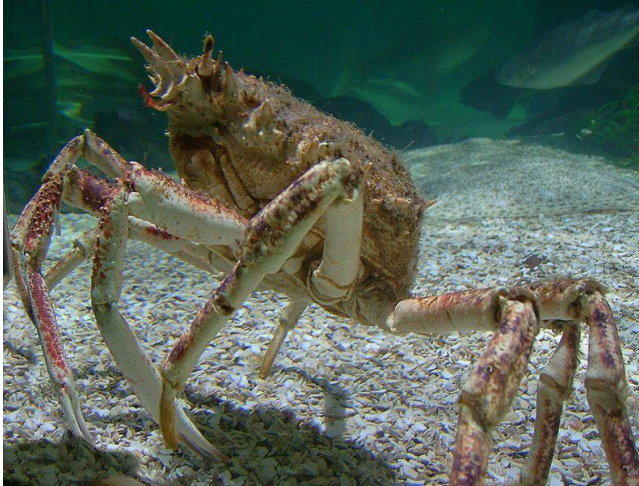
Slika 21 – Račnjak