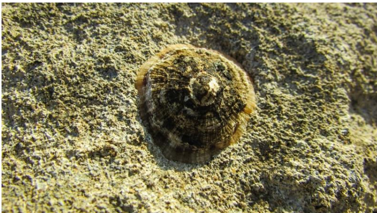
Slika 7 - Priljepak

Priljepak je puž s kućicom koja izgleda poput slamnatog šešira. Ispod kućice su utroba i veliko stopalo preobraženo u plosnati organ za prijanjanje. Pomoću njega priljepak čvrsto prijanja uz podlogu, a rubovi kućice prijanjaju uz stijenu. Priljepci su uglavnom zelenkaste, sivozelene, smečkaste ili prljavobijele boje. Priljepci imaju u promjeru oko 4 cm, a visina njihove kućice je oko 1 cm. Oni su karakteristični stanovnici stjenovitih obala. Naseljavaju mediolitoral, katkad čak i supralitoral. Veoma se sporo kreću po podlozi i pritom se hrane algama. Najviše ih je na obalama koje obilno zaljevaju valovi. Oblik kućice omogućuje im da ostanu prilijepljeni uz stijenu čak i tijekom vrlo jakih valova. „Kad priljepak ostane na suhome, rubovi kućice potpuno se pripijaju uz stijenu i tako štite meki dio životinje od isušivanja.“ (Turk 2011:223).