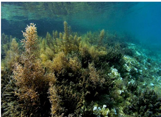
Slika 38 – Cystoseira spp.