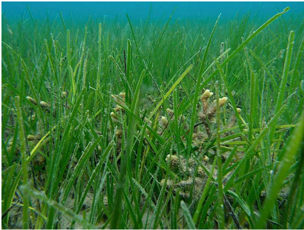
Slika 41 – Čvorasta morska resa

Biljka Cymodocea nodosa ima 15-40 centimetara duge te 3-4 milimetara široke, svijetlo do tamnozeleno listove. Listovi su trakasti, uski sa 7-9 paralelnih žila i na vrhu nazubljenih rubova. Stabalce se razvija paralelno uz morsko dno, debljine 3-4 mm, savitljivo i glatko. Na stabalcu su karakteristični gusto formirani „čvorovi“. Korijen je debljine tek nekoliko milimetara. Ova biljka živi na pjeskovitom i muljevitom dnu, od površine mora do 10 metara dubine. U ljetnim mjesecima često ju možemo vidjeti u plićaku ili nasukanu na morsku obalu ( http://zastitamora.net/podmorje/morske-vrste/angiospermae-morske-cvjetnice/cymodocea-nodosa/ ).