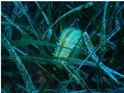
Slika 40 – Oceanski porost

Oceanski porost karakteriziraju tamnozeleni, trakasto uski listovi dužine između 30-140 centimetara i širine do 1 centimetra. Rastu u snopićima od 5-8 listova. Oceanski porost jedan je od najdugovječnijih organizama sredozemlja te može živjeti dulje od 1000 godina. Gradi velike podmorske livade do oko 40-ak metara dubine, na pjeskovitu morskome dnu, koje su po bioraznolikosti najbogatije zajednice čitavog Jadrana. Posidonia oceanica i njene livade istinske su morske šume koje imaju čitav niz iznimno važnih ekoloških funkcija: pročišćavanje morske vode, sudjelovanje u ciklusu kruženja hranjivih soli u moru, stabilizacija morskog dna, ublažavanje djelovanja valova i erozije obalnih područja. Proizvode i do 14 litara kisika na dan po metru kvadratnom zbog čega je opravdano možemo nazvati i plućima mora. U jesen stari listovi otpadaju i nerijetko dolaze na plaže gdje se skupljaju u velikim količinama. Odumiranjem livada posidonije ugrožene su i druge biljne i životinjske vrste koje ondje žive, stoga njihova zaštita ima neprocjenjivu važnost ( http://zastitamora.net/edukacija/objave/njezino-velicanstvo-posidonia-oceanica/ ).