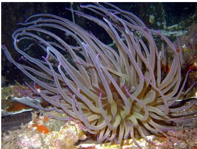
Slika 5 - Vlasulja