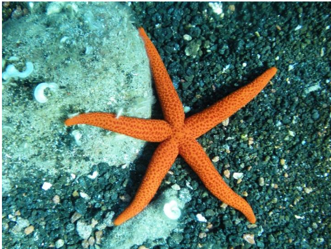
Slika 25 – Crvena zvjezdača

Crvena zvjezdača ima razmjerno malu središnju ploču s pet, rjeđe 6 ili 7 debelih i valjkastih krakova. Bodlje su neznatne i usađene u kožu. Crvena zvjezdača je narančaste boje ili boje opeke i može narasti do 25 centimetara. Živi na dubinama od 5 do 200 metara na svim vrstama kamenitog dna (Turk, 2011).