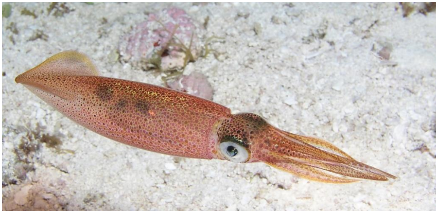
Slika 16 – Lignja

Lignja ima karakteristično strjeličasto tijelo i slabo očuvan unutarnji skelet. Peraja joj je ušiljena. Životinja ima osam kratkih šiljastih lovki na kojima se nalaze prijanjaljke. Lignja je crvenkaste boje s manjim svjetlijim točkicama. Može narasti do 50 centimetara. Tijekom zime često se pojavljuje uz obalu. Većinom živi u većim skupinama koje su aktivne noću. Gospodarski su najvažnija vrsta glavonožaca u Sredozemlju (Turk, 2011).