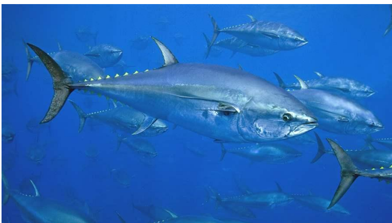
Slika 31 – Tuna

Prema Milišiću (2001:129): „tuna može narasti do 4 metra i težiti 600 kg.“ Većina je jedinki duga oko 1,5 metar i teži oko 50 kg. Tuna je najpoznatija riba među krupnom plavom ribom. Nalazi se po čitavom Jadranu, na svim predjelima i u svim dubinama. Živi u jatima, nekad zbijenim, ponekad više raspršenim. Izvrstan je plivač. Hrani se svim vrstama plave ribe. Tuna je s gornje strane tamnoplave, gotovo crne boje, a bokovi su sivo-srebrnasti. Peraje su sive (Milišić, 2001).