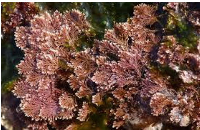
Slika 39 – Coralina spp.

Iz klasificirane pločice u obliku grmića izbijaju kolutičave, do 50 milimetara duge grančice koraljocrvene do blijedoljubičaste boje. Završni, jedinstveni kolutići gotovo su bijeli. Coralina spp. tvori gusta naselja (Turk, 2011).