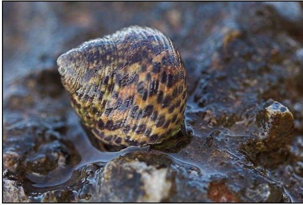
Slika 9 – Ogrc