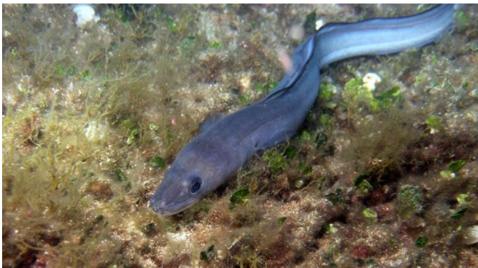
Slika 26 – Ugor

Ugor je riba svojstvenog duguljastog zmijolikog tijela. Njegovo je tijelo glatko, a ljuske su vrlo male. Leđna peraja započinje iznad završetka prsnih peraja i srasla je s repnom perajom. Oči su joj velike. Može narasti više od 2 metra i doseći težinu od oko 20 kilograma. Leđna je strana glave i tijela tamnosiva ili crna, u mužjaka katkad i smeđe-zelenkasta, a u ženki tamnoplava. Ugor je stanovnik kamenitog litorala. Tijekom dana skriva se u dugim i uskim rupama, noću odlazi u lov (Milišić, 2001).