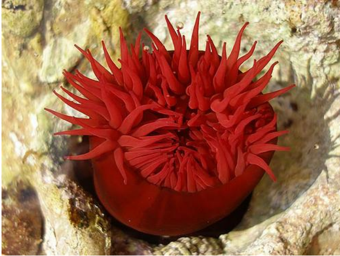
Slika 4 – Crvena moruzgva

(Turk, 2011). Djeca crvenu moruzgvu u ljetnim mjesecima mogu vrlo lako vidjeti. Vrlo vjerojatno da su je i sami već vidjeli ali nisu znali o čemu je riječ.