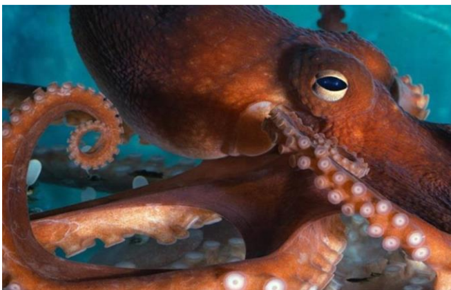
Slika 15 – Hobotnica

Hobotnica ima osam otprilike jednako dugih lovki, a na lovkama se nalaze u dva reda i u cik-cak uzorku raspoređene prijanjaljke. Oči su velike i dobro razvijene. Osnovna boja tijela je smeđa, no životinja može mijenjati boju ovisno o okolini. Kao i sipa ima žlijezdu koja proizvodi crnilo. Može narasti do dužine od 1 metra. Uglavnom živi na tvrdom dnu gornjeg infralitorala. Tijekom dana skriva se u rupama stijena, a preko noći odlazi u lov (Turk, 2011).