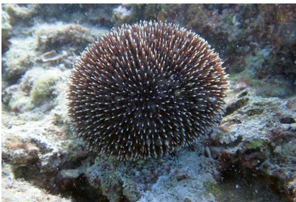
Slika 23 – Pjegavi ježinac

Čahura pjegavog ježinca plosnata je samo na donjoj strani na kojoj se nalaze usta. Sve su bodlje jednake, razmjerno kratke, jake i bolne. Oklop je tamnogrimizne boje, a oko rupica se nalaze bijela polja. Bodlje su uglavnom tamnoljubičaste s bijelim vršcima. Ježinac može narasti do 12 centimetara. Pjegavi ježinac živi na tvrdom ili pješčanom dnu te među livadama morskih trava na dubinama između 5 i 20 metara (Turk, 2011).