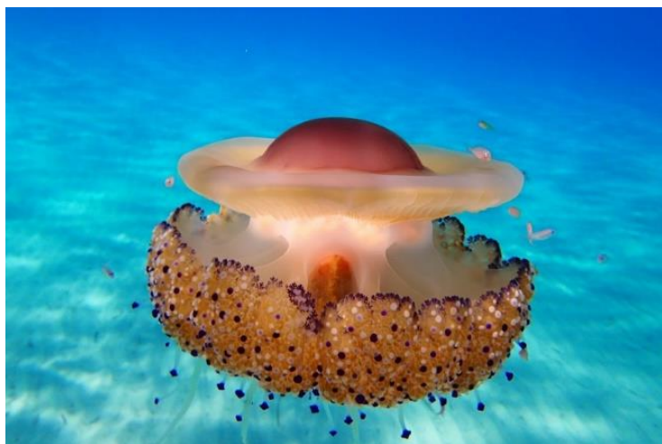
Slika 3 – Mediteranska meduza

Vrsta Cotylorhiza tuberculata ima svojstven oblik prema kojemu je možemo lako razlikovati od ostalih meduza. Klobuk je plosnat i na sredini ima grbavu izbočinu, okruženu kružnim kanalom. Rub klobuka sastavljen je od 16 krpa koje su rascjepkane u više od 100 vrlo malih krpica. Klobuk ima promjer do 20 centimetara, te je zelenosmeđe boje što je posljedica simbioze s algama (Turk, 2011). Ova meduza slobodno pliva, a u kasno ljeto je učestali gost. No, ovo je jedna od onih meduza koje su bezopasne. Dotaknemo li ju ona nam neće nauditi. Ljudi se često plaše ove meduze jer je velika i ne izgleda primamljivo.