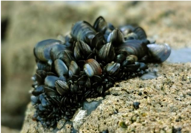
Slika 12 - Dagnja

Dagnja ima oblik sličan bedru, te je tamnoplave, gotovo crne boje. Njezine su ljuštare jednake, ne predebele, no ipak tvrde. Ona može narasti do 7 centimetara. Dagnje se za podlogu pričvršćuju bisusnim nitima. Pričvršćene su jedna pokraj druge i na nekim mjestima tvore prave pokrivače. Dagnje naseljavaju gornji infralitoral, do same granice najniže oseke. Ona je jestiva školjka, kojoj je meso ukusno i vrlo hranjivo. Uzgoj dagnji vrlo je razvijen u nas na Jadranu (Milišić, 2001).