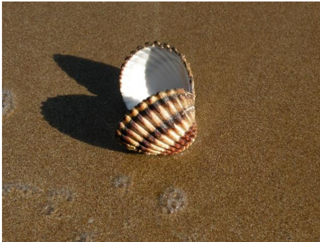
Slika 13 – Kapica prugasta