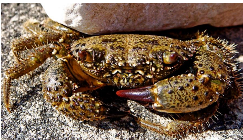
Slika 19 – Grmalj

Grmalj je velika vrsta s jakim oklopom i velikim kliještima. Po sebi ima bradavičaste izrasline. Rakovica (glavopršnjak) je smeđe boje s izraženim žutim pjegama. Može narasti do 20 centimetara. Grmalj je grabežljivac koji se zadržava uz obalu i zalazi do same površine vode, no najčešće je na dubinama oko 5 metara. Živi u rupama stijena. Kada se nalazi u opasnosti raširit će vrlo jaka kliješta kojima može raniti i snažno uštipnuti prst čovjeka (Turk, 2011).