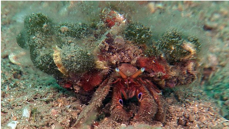
Slika 20 – Rak samac

U tog su raka kliješta otprilike jednakih dimenzija. Lijeva su malo jača. Oči mu se nalaze na stapkama, a antene su duge koliko i kliješta. Životinja je boje hrđe ili opeke, stapke su narančaste, oči svjetlomodne, a antene crvene. Može narasti do 3 centimetra. Rak samac skriva svoj stražnji, meki dio tijela u prazne kućice puževa. Najčešće se nalazi na dubinama između 15 i 30 metara, osobito na muljevitom dnu (Turk, 2011).