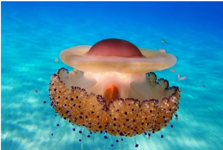
Slika 3 – Mediteranska meduza

Vrsta Cotylorhiza tuberculata ima svojstven oblik prema kojemu je možemo lako razlikovati od ostalih meduza. Klobuk je plosnat i na sredini ima grbavu izbočinu, okruženu kružnim kanalom. Rub klobuka sastavljen je od 16 krpa koje su rascjepkane u više od 100 vrlo malih krpica. Klobuk ima promjer do 20 centimetara, te je zelenosmeđe boje što je posljedica simbioze s algama (Turk, 2011). Ova meduza slobodno pliva, a u kasno ljeto je učestali gost. No, ovo je jedna od onih meduza koje su bezopasne. Dotaknemo li ju ona nam neće nauditi. Ljudi se često plaše ove meduze jer je velika i ne izgleda primamljivo.