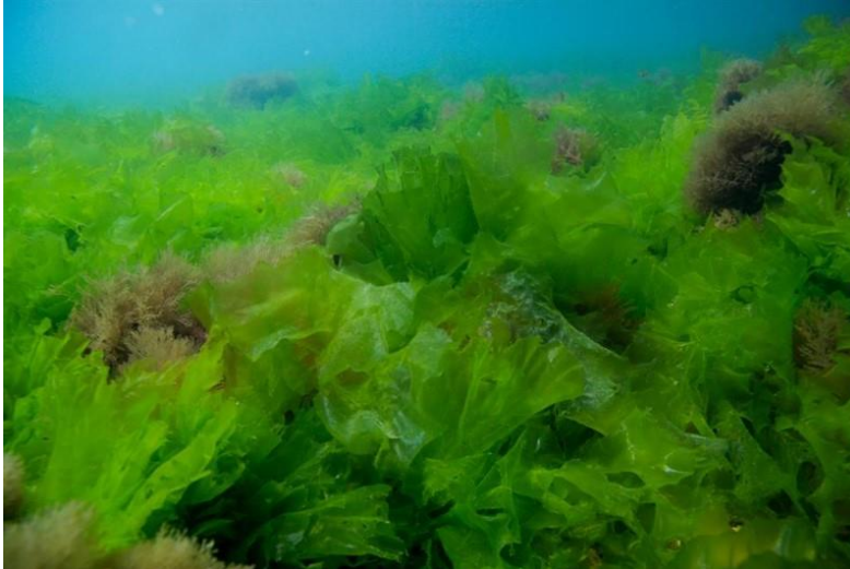
Slika 37 – Morska salata

Morska salata naseljava dobro osvijetljena mjesta u pojasu plime i oseke i u gornjem obalnom pojasu te se pojavljuje tijekom cijele godine. Česta je i u plitkom onečišćenom moru. Steljke cjevastih algi mogu narasti i više od 0,5 metara. Na opip su kožaste i karakteristične živozelene boje (Turk, 2011).