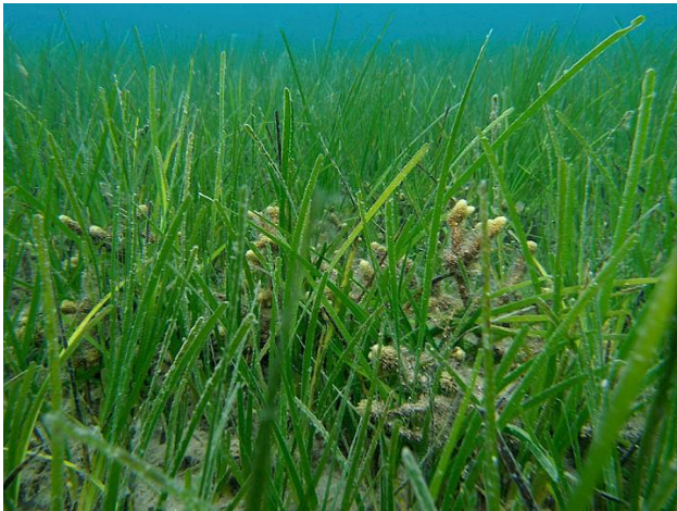
Slika 41 – Čvorasta morska resa

Biljka Cymodocea nodosa ima 15-40 centimetara duge te 3-4 milimetara široke, svijetlo do tamnozeleno listove. Listovi su trakasti, uski sa 7-9 paralelnih žila i na vrhu nazubljenih rubova. Stabalce se razvija paralelno uz morsko dno, debljine 3-4 mm, savitljivo i glatko. Na stabalcu su karakteristični gusto formirani „čvorovi“. Korijen je debljine tek nekoliko milimetara. Ova biljka živi na pjeskovitom i muljevitom dnu, od površine mora do 10 metara dubine. U ljetnim mjesecima često ju možemo vidjeti u plićaku ili nasukanu na morsku obalu ( http://zastitamora.net/podmorje/morske-vrste/angiospermae-morske-cvjetnice/cymodocea-nodosa/ ).