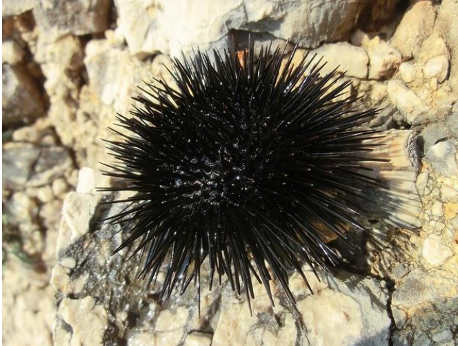
Slika 22 – Crni ježinac

dok hodamo plićakom ne bi li slučajno nagazili na crnog ježinca. Iako njegove bodlje nisu otrovne, ubodi crnog ježinca mogu biti bolni. Ipak, moramo biti zahvalni na njihovom posjetu jer su oni pokazatelji čistog mora.