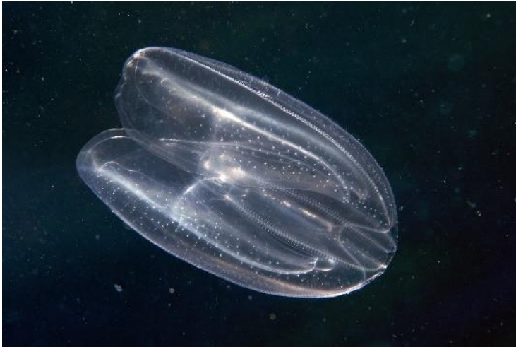
Slika 6 – Morski orah

prozirno i kao u većine rebraša, redovito svjetluca u plavičastim i ružičastim nijansama. Mnemiopsis leidy je deset centimetra dug i dva i pol centimetra širok rebraš koji izvorno obitava u zapadnom dijelu Atlantskog oceana. U posljednjih nekoliko godina Mnemiopsis leidy se pojavio u znatnom broju i u sjevernom Jadranu ( https://www.scubalife.hr/magazin/savjeti/jadranski-rebrasi/ ).