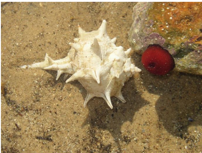
Slika 10 – Volak bodljikavi

Bodljikavi volak ima vapnenu kućicu sa svojstvenim bodljastim izraslinama. Ušće kućice je ovalnog oblika i nastavlja se u kanal u obliku tuljka, dugačak do 6 centimetara. Puž je dugačak do 10 centimetara, a prosječno je dug oko 8 centimetara. Kućica mu je uglavnom svjetlosmeđe, a može biti i sivosmeđe te zelenkaste boje. Bodljikavi volak živi uglavnom na muljevitom pješčanom dnu, a u Sjevernom je Jadranu vrlo čest (Turk, 2011).