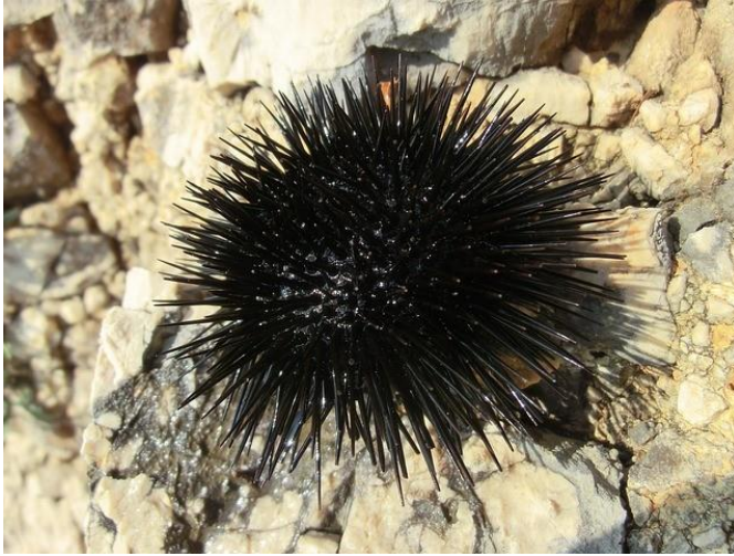
Slika 22 – Crni ježinac

dok hodamo plićakom ne bi li slučajno nagazili na crnog ježinca. Iako njegove bodlje nisu otrovne, ubodi crnog ježinca mogu biti bolni. Ipak, moramo biti zahvalni na njihovom posjetu jer su oni pokazatelji čistog mora.