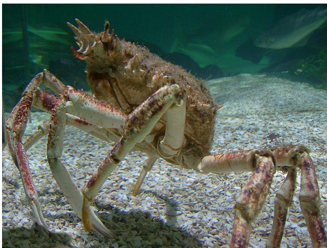
Slika 21 – Račnjak