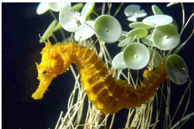
Slika 32 – Konjic kratkokljunić

Morski konjici imaju svojstven oblik tijela koji se uvelike razlikuje od ostalih riba. Plivaju u okomitom položaju. Prsne peraje nalaze se na glavi. Dobro je očuvana i leđna peraja. Rep je vrlo dug i pomoću njega se konjići hvataju za alge i ostale podloge. Prevladava sivo-smeđa ili smeđa boja, a neki su posuti mrljama. Može narasti do 12 centimetara. Živi na pješčanom dnu gdje se vješa za različite alge (Turk, 2011).