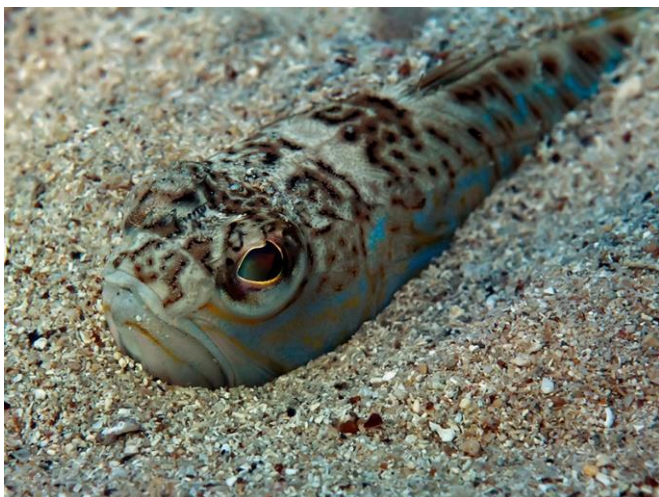
Slika 30 – Pauk bijelac