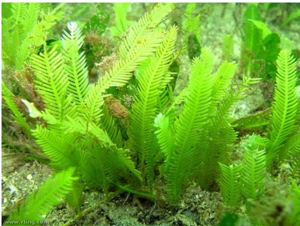
Slika 36 – Caulerpa taxifolia

Caulerpa taxifolia je vrsta tropske alge, iz porodice Caulerpaceae. Prirodna staništa su joj tropska mora i Indijski ocean, ali se brzo razmnožila po čitavom Sredozemlju. Lako može preživjeti u hladnijem moru temperature 5 -10 °C i jednako se brzo širi u čistom, otvorenom moru kao i u zagađenim lukama i zaljevima. Fluorescentno je zelene boje, stabiljka je debljine 2-3 mm. Za površinu je pričvršćena korjenčićima dugim 4-5 cm ( http://www.geografija.hr/hrvatska/caulerpe-i-dalje-u-jadranu/ ).