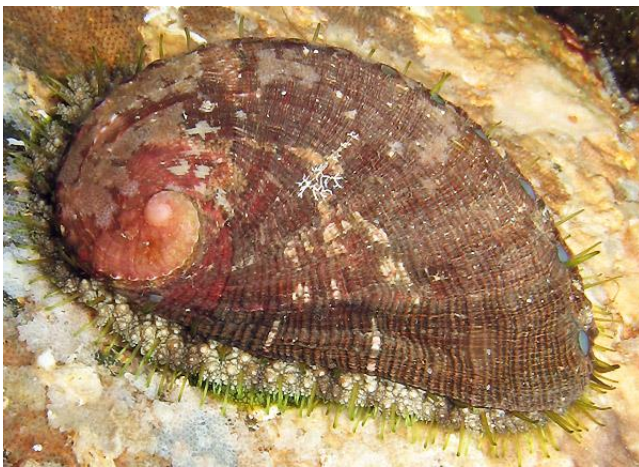
Slika 8 – Petrovo uho

Puzlatka ima ovalnu, uhu sličnu otvorenu i naboranu kućicu. Na njezinu vanjskom rubu leži 14 do 16 malih ovalnih otvora koji se prema vrhu kućice smanjuju. Kućica nema poklopac. Puž ima veliko i snažno stopalo pomoću kojeg čvrsto pranja za podlogu. Iz stopala izrastaju brojne nježne izrasline. Može narasti do 7 centimetara. Vanjska je strana kućice siva s nepravilnim smeđezelenim šarama. Unutarnja je strana boje bisera (Turk, 2011). Puzlatka živi ispod kamenja i pod stijenama u području gornjeg infralitorala, osobito u dijelovima koji su vrlo obrasli algama.