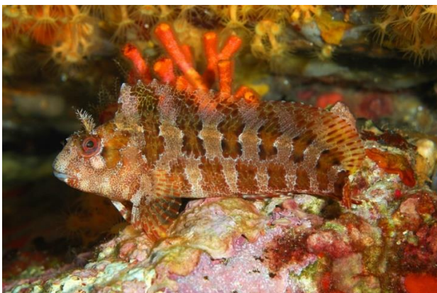
Slika 28 – Slingurica mrkulja

Ova je riba karakteristična zato što ima dvije grmolike izrasline iznad očiju. Osnovna je boja ribe žuto-smeđa, posuta sitnim tamnijim točkicama te većim brojem tamnosmeđih pruga obrubljenih tankim bijelim rubom, koje se produžuju u leđnu peraju. Može narasti do 20 centimetara. Slingurica mrkulja živi na kamenitom infralitoralnom dnu do dubine od 20 metara (Turk, 2011).