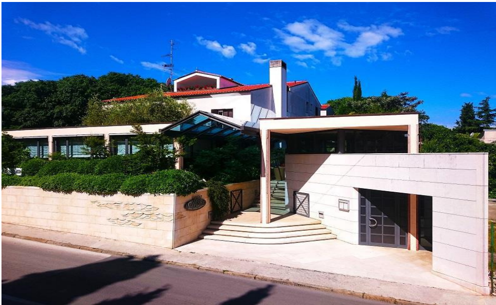
Slika 5. Obiteljski hotel Milan