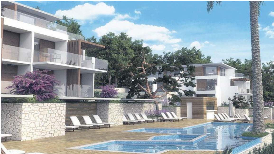
Slika 1. Hotel Valamar Girandella u Rapcu, sa nadolazećim investicijama