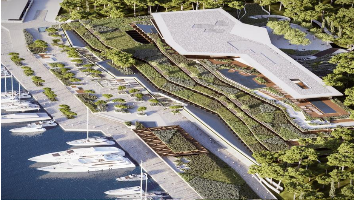
Slika 2. Novi hotel Park u Rovinju