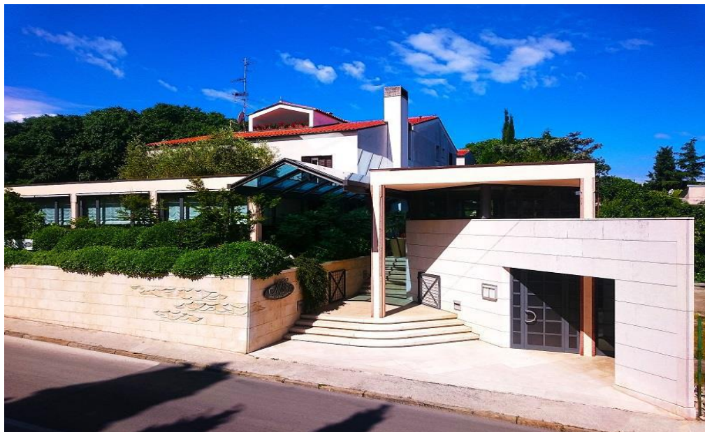
Slika 5. Obiteljski hotel Milan