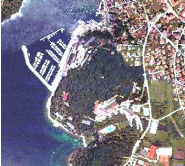
Slika 3. Zona Monte Mulini u Rovinju