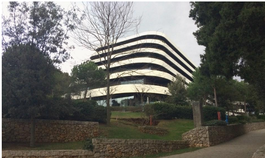
Slika 4. Hotel Lone u Rovinju u zoni Monte Mulini