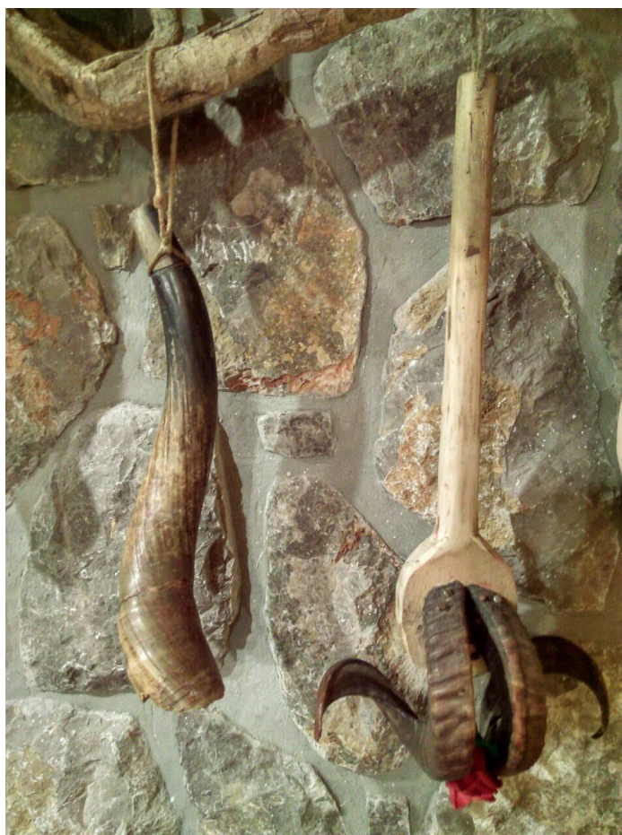
Fotografija 4. 29

Kao i gotovo svaki dio zvončarske opreme, balta također može biti teška. Upravo se zbog toga izradi balte posvećuje puno vremena. Pazi se od kakve će se vrste drva izrađivati, koliko će biti velika, široka. Kada se obrađuju rogovi, procedura je također dugotrajna. Treba obratiti pažnju na vrijeme kuhanja roga, debljinu roga, način brušenja, te mnoge druge faktore.