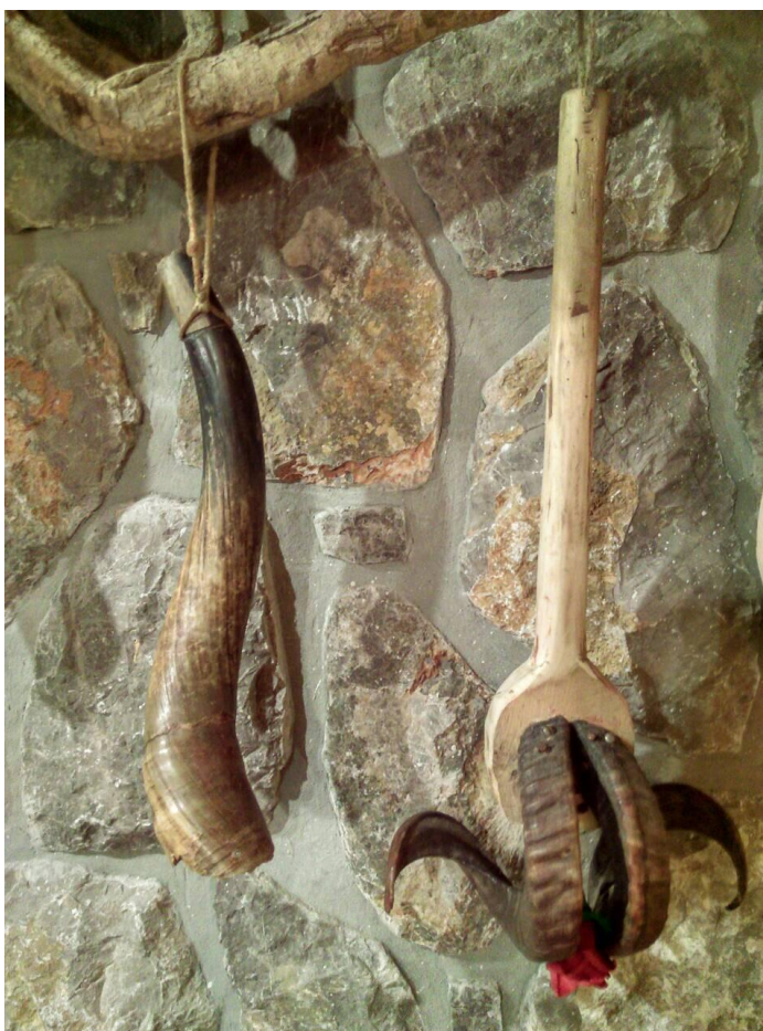
Fotografija 4. 29

Kao i gotovo svaki dio zvončarske opreme, balta također može biti teška. Upravo se zbog toga izradi balte posvećuje puno vremena. Pazi se od kakve će se vrste drva izrađivati, koliko će biti velika, široka. Kada se obrađuju rogovi, procedura je također dugotrajna. Treba obratiti pažnju na vrijeme kuhanja roga, debljinu roga, način brušenja, te mnoge druge faktore.