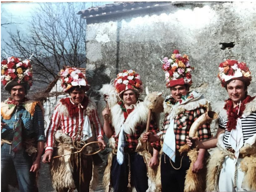
Fotografija 5. 31