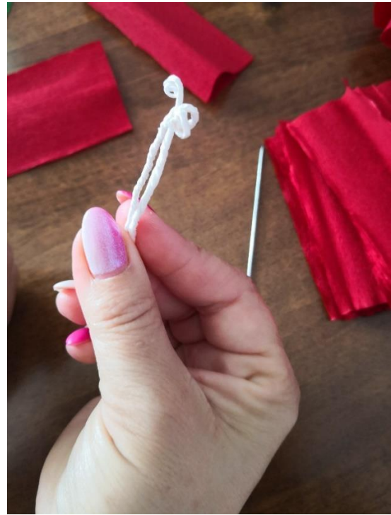
Fotografija 12. 41