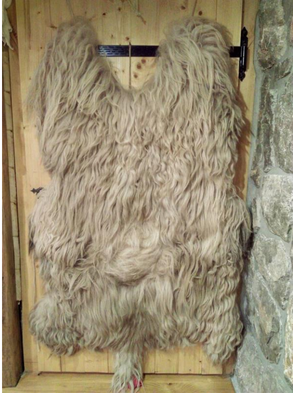
Fotografija 3. 28

da koža bude što pahuljastija, nježnija, svjetlija. U konačnici, problem je i financijske prirode, naime kože nisu nimalo jeftine, mogu dosezati cijenu i od nekoliko tisuća kuna.