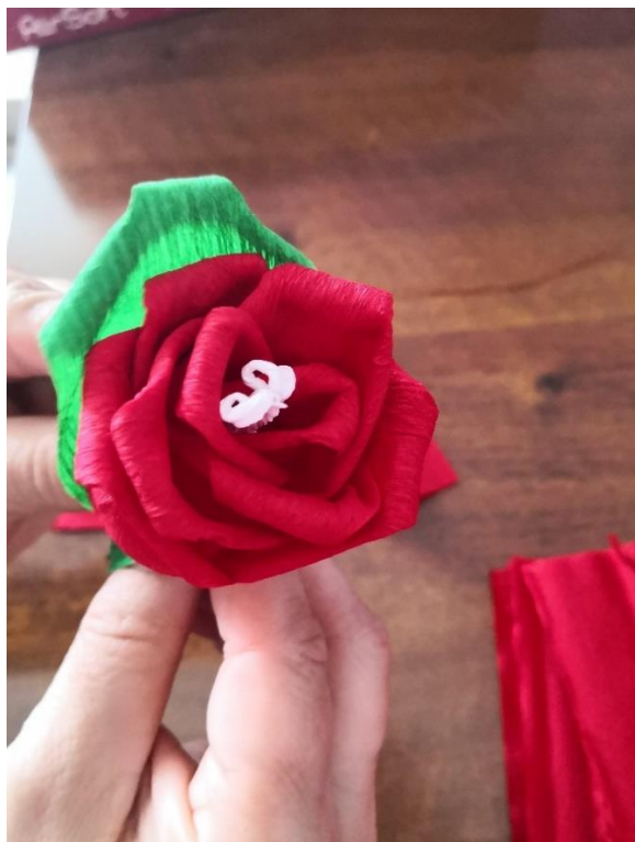
Fotografija 14. 43

6. korak: na samom kraju dodamo list, a zatim sve učvrstimo mekanom žicom.