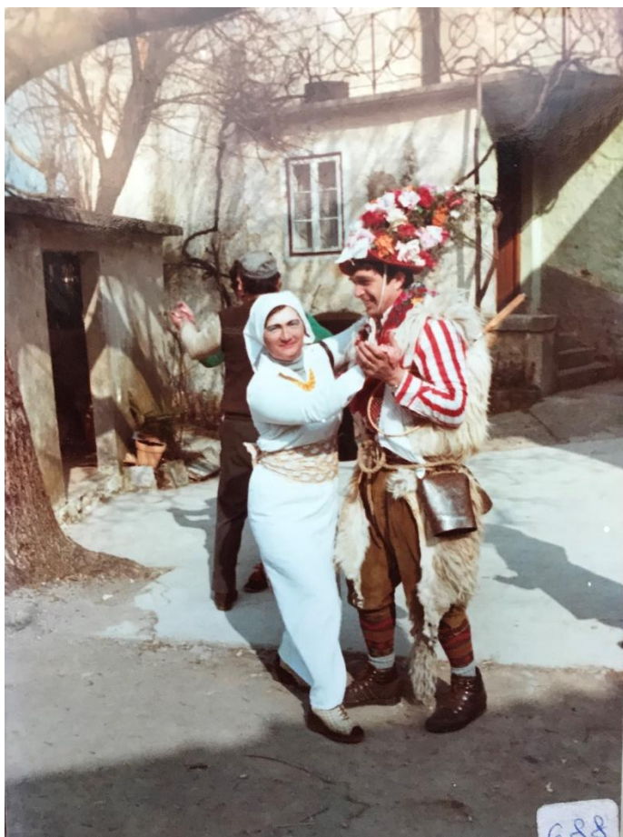
Fotografija 7. 36

deset, pa neki pride Škrapni. Ne gjeda se ki kada pride, i da neku dobu ferma ni nekakova regula. To j' više užanca. Ali i sakako je čuda lagje, imaš jedno kolo va sele i reš po kućah. Dva al tri va jednu, dva, tri va drugu kuću, pak se promene. Dogovori se, do pol uri na kraj sela i remo daje.