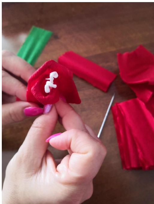
Fotografija 13. 42

5. korak: slaganje započinjemo tučkom, zatim polukružno slažemo laticu po laticu, čvrsto držeći do sad složeni dio.