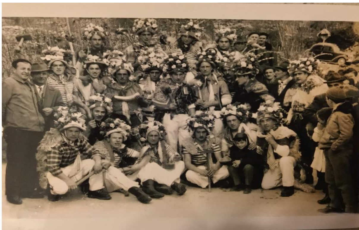
Fotografija 6. 34

Biti zvončar koji odlazi na ovakav pohod, iznimna je čast i zadovoljstvo, to je ponos i dokaz muževnosti, snage i pripadnosti kraju iz kojeg sam zvončar dolazi.