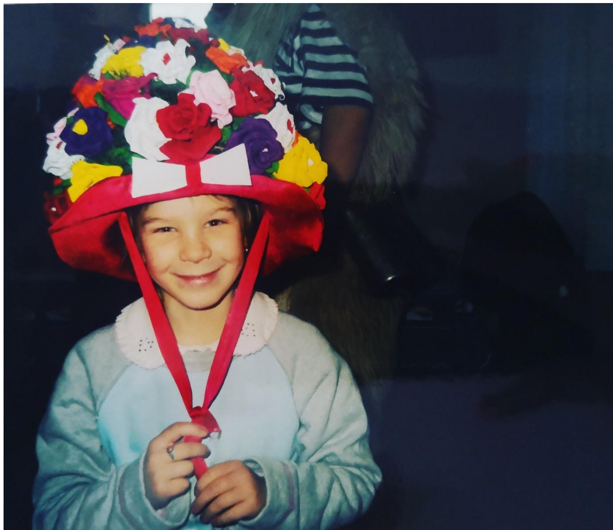
Fotografija 16. 45

prema zvončarima, ona ka zna oprtit i vezat zvonci, ona ka ima mot , ali u konačnici, ona će uvijek biti ona.