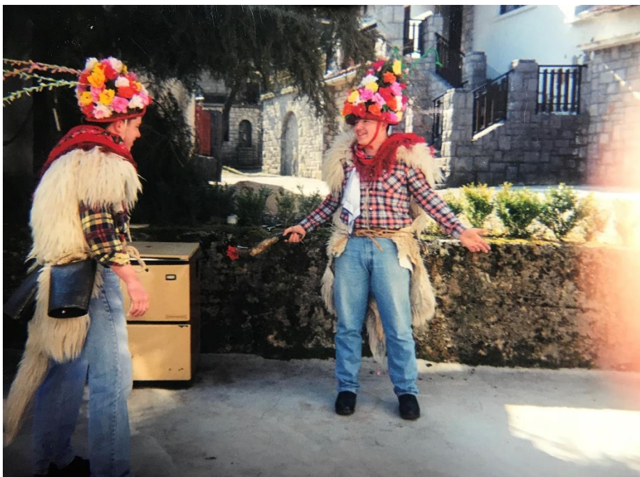
Fotografija 8. 37