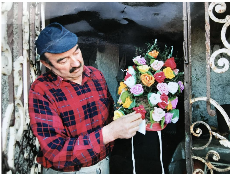
Fotografija 2. 27

Također, zanimljivo je da su Zvonejski klobuki posebni upravo po načinu izrade cvjetova, te je njihova izrada povjerena ženama. Kasnije u radu, biti će pomno opisan i slikovno prikazan postupak izrade zvončarske rožice .