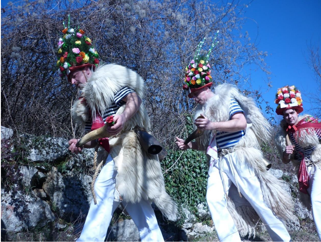
Fotografija 1. 13

kvadri 11 , a umjesto bijelih hlača nose se brageši od trliža 12 , u modernije vrijeme i tamnoplave traperice.