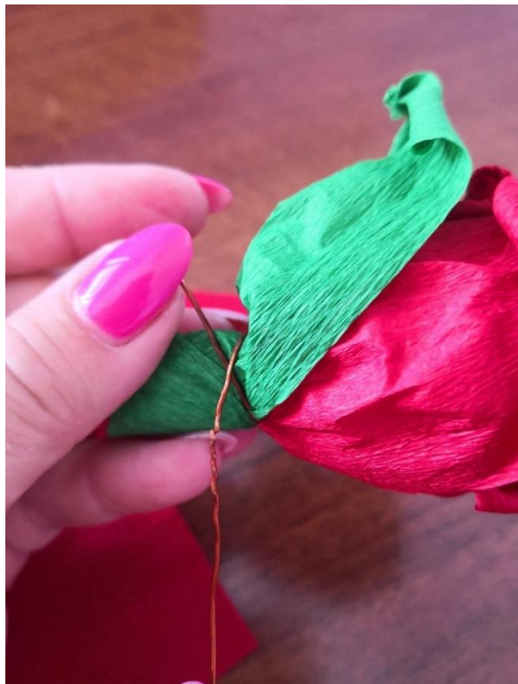
Fotografija 15. 44