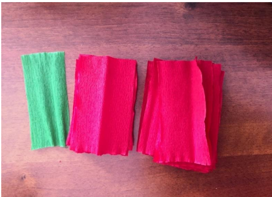
Fotografija 9. 38