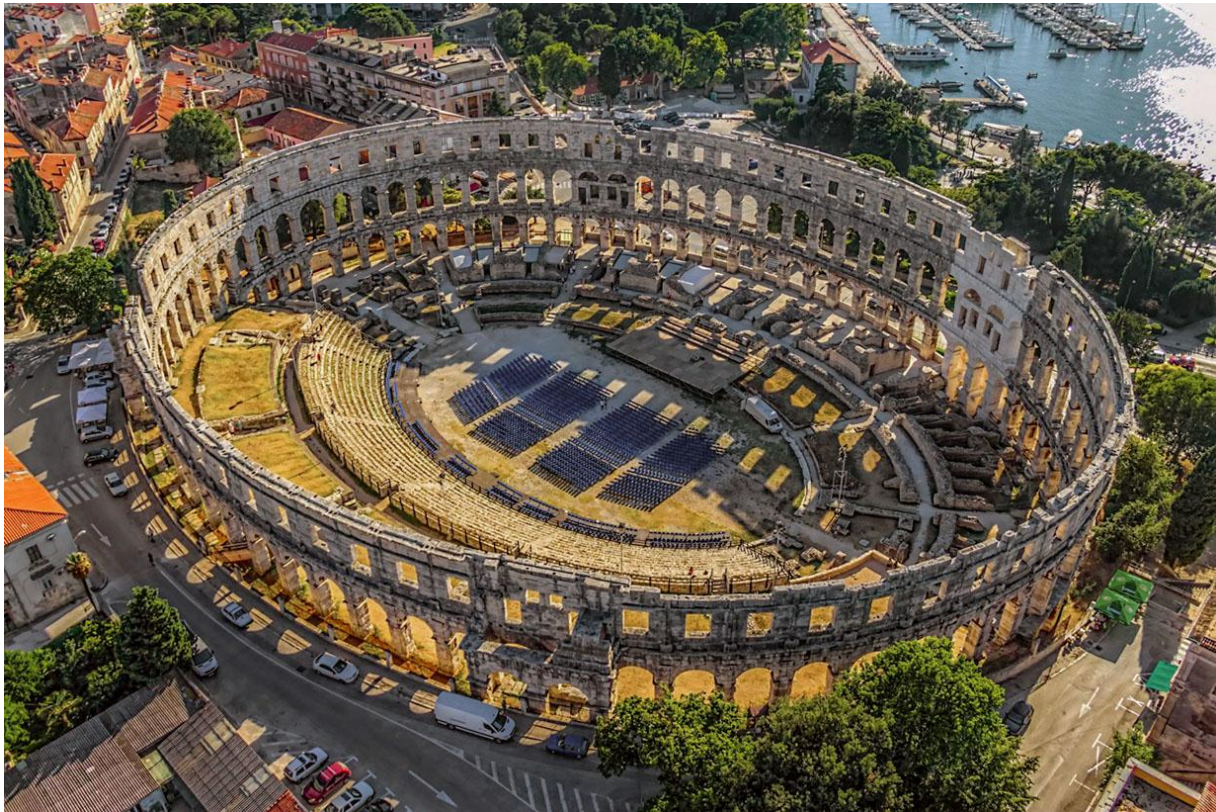
Slika 3 Amfiteatar Pula