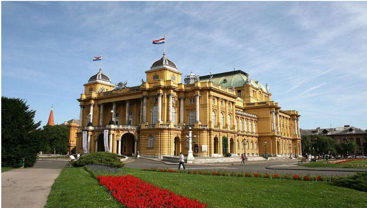
Slika 1 Hrvatsko narodno kazalište, Zagreb