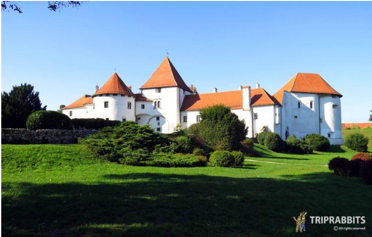
Slika 4 Stari grad Varaždin