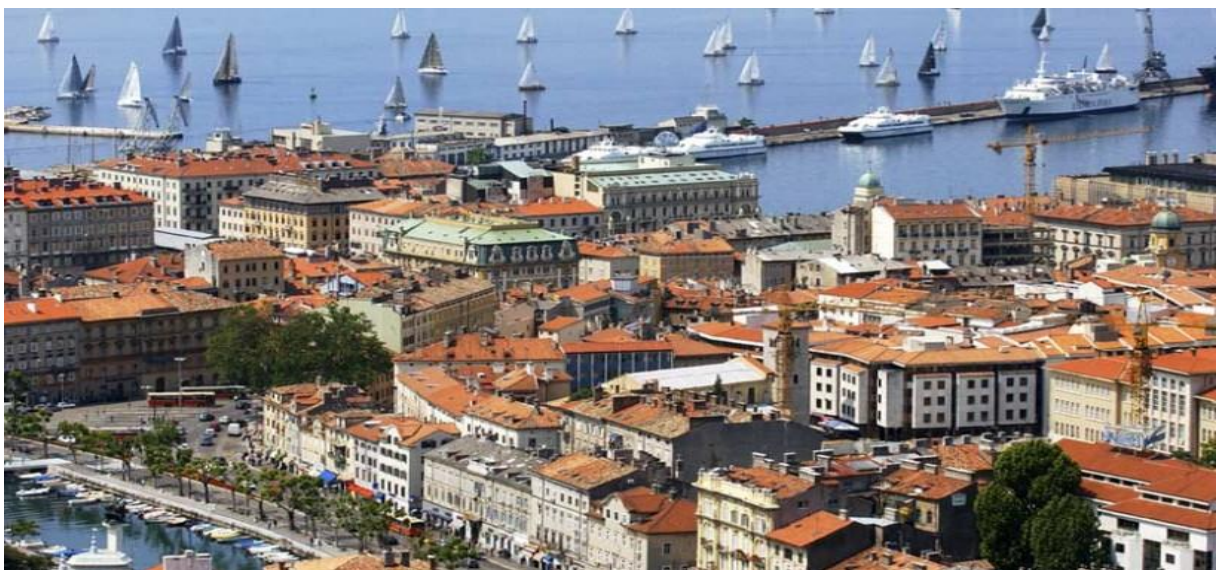
Slika 2 Grad Rijeka – Europska prijestolnica kulture

Rijeka je, također, grad izabran za Europsku prijestolnicu kulture 2020. godine (slika 2). Prestižna titula dodijeljena joj je za program Luka raznolikosti. Dakle, kreiran je program čiji je cilj stvoriti grad kulture i kreativnosti za Europu i budućnost. „Ideja vodilja koncepta je zasnovana na temama rada i prava na rad, prava na različitost, pitanje ekološke održivosti i ugroženih fundamenata Hrvatske i Europe. Osnovne teme Rada, Vode i Migracija razrađene su u sedam dijelova naslovljenih: 27 susjedstva, Ciglena kuća, Doba moći, Lungomare, Dopolavoro, Kuhinja, Slatko i Slano“ (Šaškor, 2017).