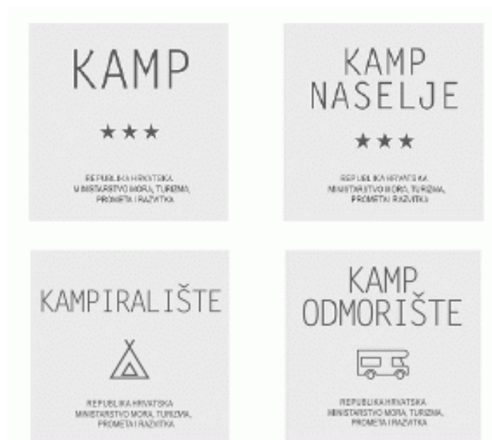
Slika 1. Grafička rješenja standardiziranih ploča za pojedine vrste kampa