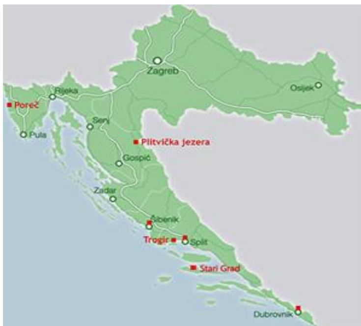
Slika 4: UNESCO odredišta