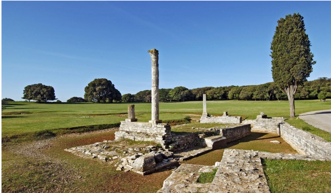
Slika 1: Rimska vila u uvali Verige