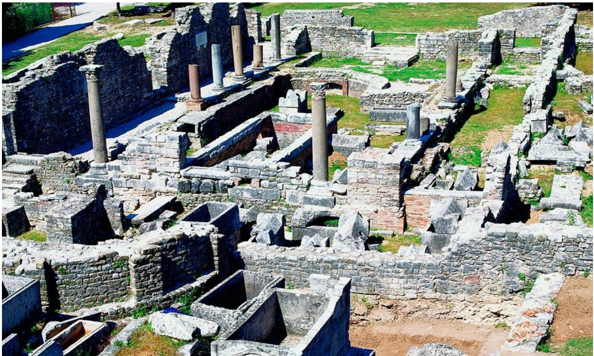
Slika 2. Manastire