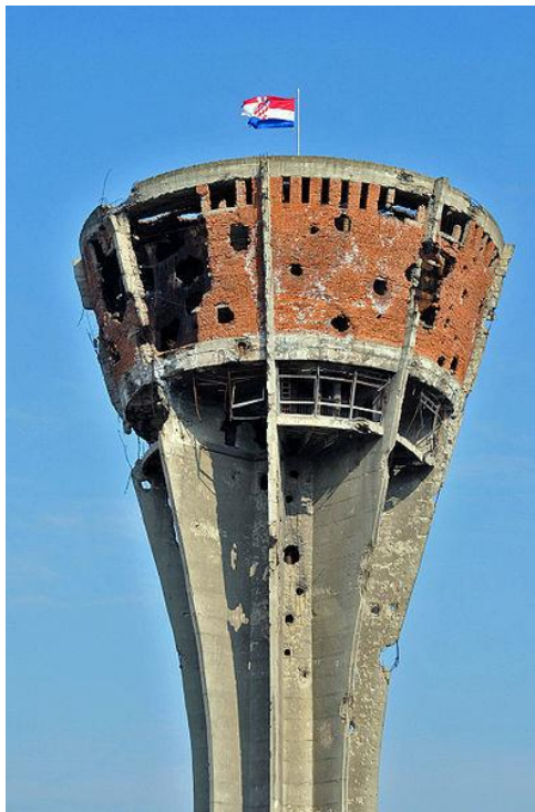
Slika 3. Vukovarski vodotoranj