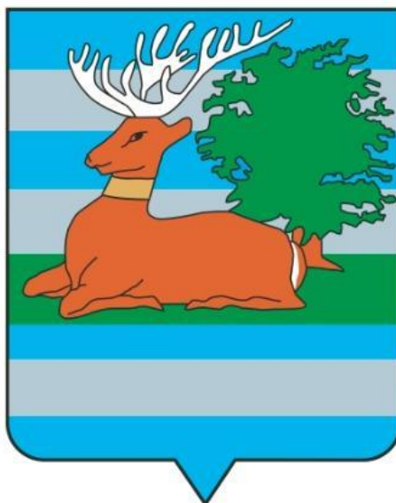
Slika. Grb Vukovarsko-srijemske županije (5.9.2019.)

Slavonija je druga najveća regija Republike Hrvatske te se sastoji od pet županija: Virovitičko-podravske, Brodsko-posavske, Požeško-slavonske, Osječko-baranjske i Vukovarsko-srijemske. Na ovim područjima, koji obuhvaćaju kontinentalni dio zemlje, najrazvijeniji je ruralni turizam, odnosno korištenje vlastitoga gospodarstva za pružanje usluga ugostiteljstva i smještaja za posjetitelje.