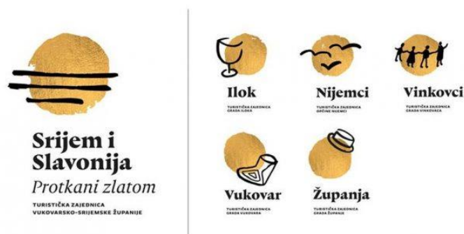
Slika 4. Trenutni logo turističke zajednice Vukovarsko-srijemske županije