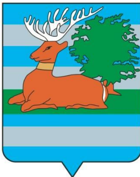
Slika. Grb Vukovarsko-srijemske županije (5.9.2019.)

Slavonija je druga najveća regija Republike Hrvatske te se sastoji od pet županija: Virovitičko-podravske, Brodsko-posavske, Požeško-slavonske, Osječko-baranjske i Vukovarsko-srijemske. Na ovim područjima, koji obuhvaćaju kontinentalni dio zemlje, najrazvijeniji je ruralni turizam, odnosno korištenje vlastitoga gospodarstva za pružanje usluga ugostiteljstva i smještaja za posjetitelje.