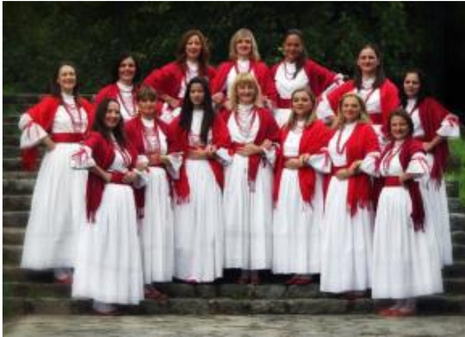
Fotografija 3. Članovi FD Vuga