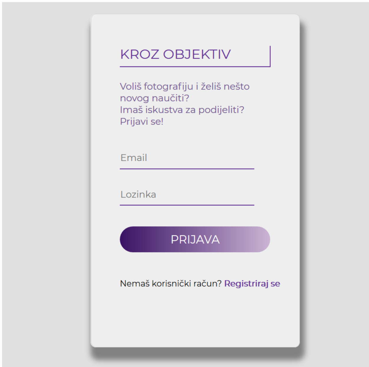
Slika 6. Izgled stranice za prijavu.

Programski kod 4. – Prikaz odjave korisnika