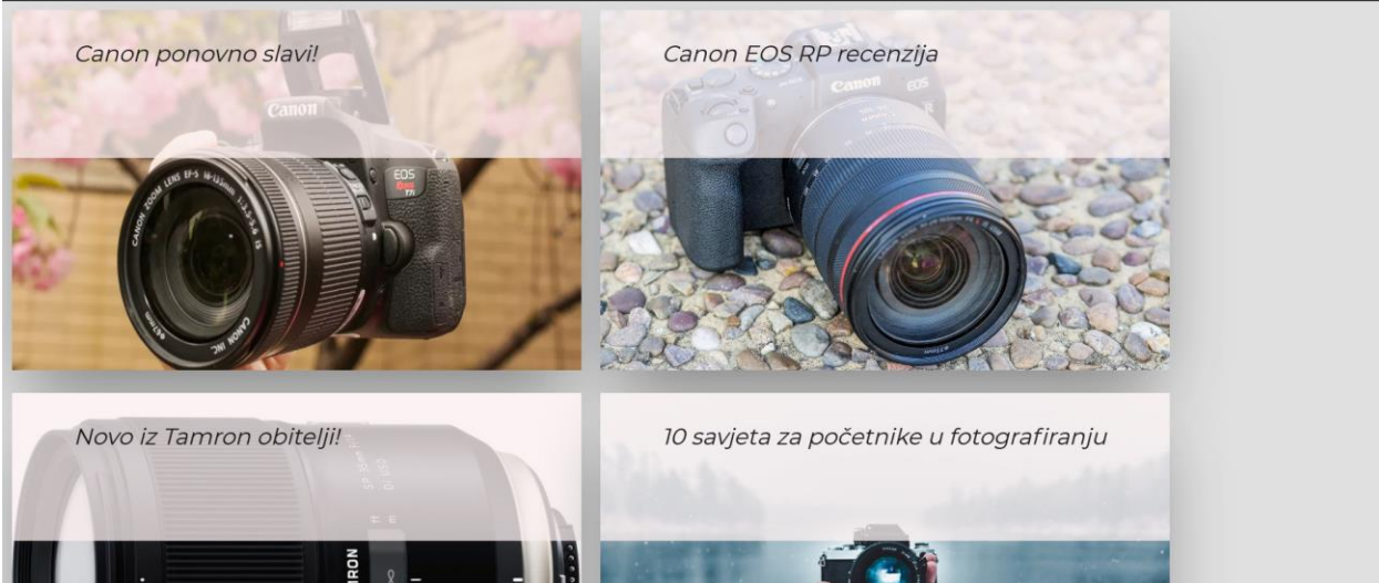
Slika 7. Pikaz početne stranice

Pri pregledavanju određenog članka korištena je ista logika kao i kod komponente ProjectSummary. Proslijeđen je props “project” s kojim smo dohvatili potrebne elemente, to jest podatke s Firebase-a. Svaki korisnik koji je napisao svoj članak, pri pregledavanju, klikom na dugme “Izbriši članak” se okida akcija handleClick() koji briše određeni članak. Komponenta mapStateToProps se koristi svaki put kada se stranica povezuje na Firebase, jer se svi podaci spremaju lokalno preko Redux-a. Službena stranica React-Redux navodi: “kao prvi argument koji se prenosi za povezivanje, mapStateToProps se koristi za odabir dijela podataka iz pohrane u kojem je potrebna povezana komponenta [21]. Ona se zove svaki put kada se promijeni podatak u pohrani, te prima cjelokupno stanje pohrane i vraća object podataka kada je određena komponenta pozvana. U komponentu mapStateToProps je povezan članak s svojim id-om kako bi korisnik mogao obrisati svoj članak, povezani su putem autorizacijskog id-a koji se nalazi u svakom članku (eng. doc). Prilikom svakog spremanja članka, dodan je datum kada je članak kreiran. U Firebase-u, datum je spremljen u HTML format, i kako bi ga preoblikovali u hrvatski standard prikazivanja vremena, korišten je Moment.js s instancom: