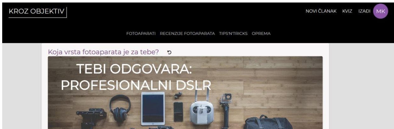
Slika 9. Prikaz rezultata iz riješenog kviza

Metoda reloadPage() je povezana na dugme koje služi za osvježavanje stranice, jer ako korisnik nije zadovoljan sa svojim rezultatom ili samo želi znati koji bi rezultat dobio sa drugačijim odgovorima, window.location.reload() ga vraća na prvo pitanje.