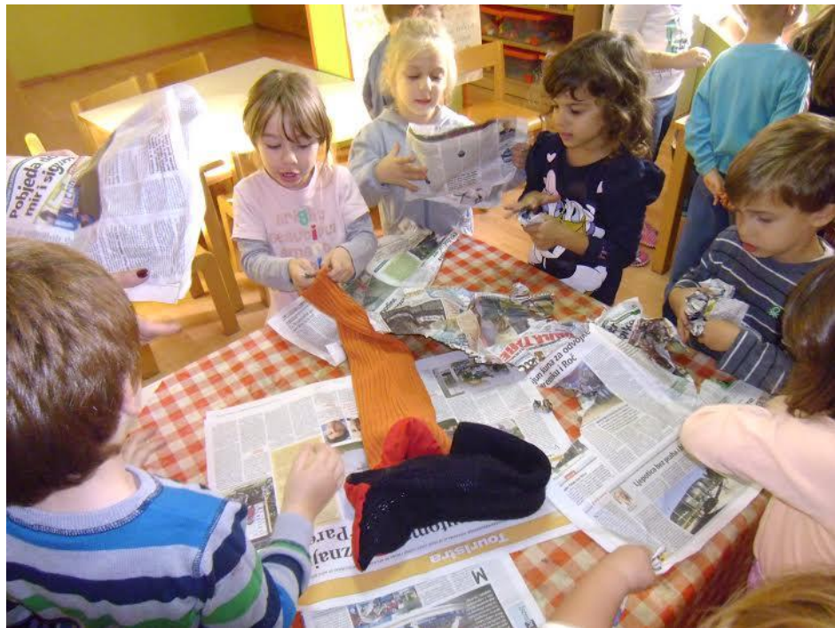
Slika 17. Gužvanje novina i punjenje štapnih lutaka i lutka zijevalica