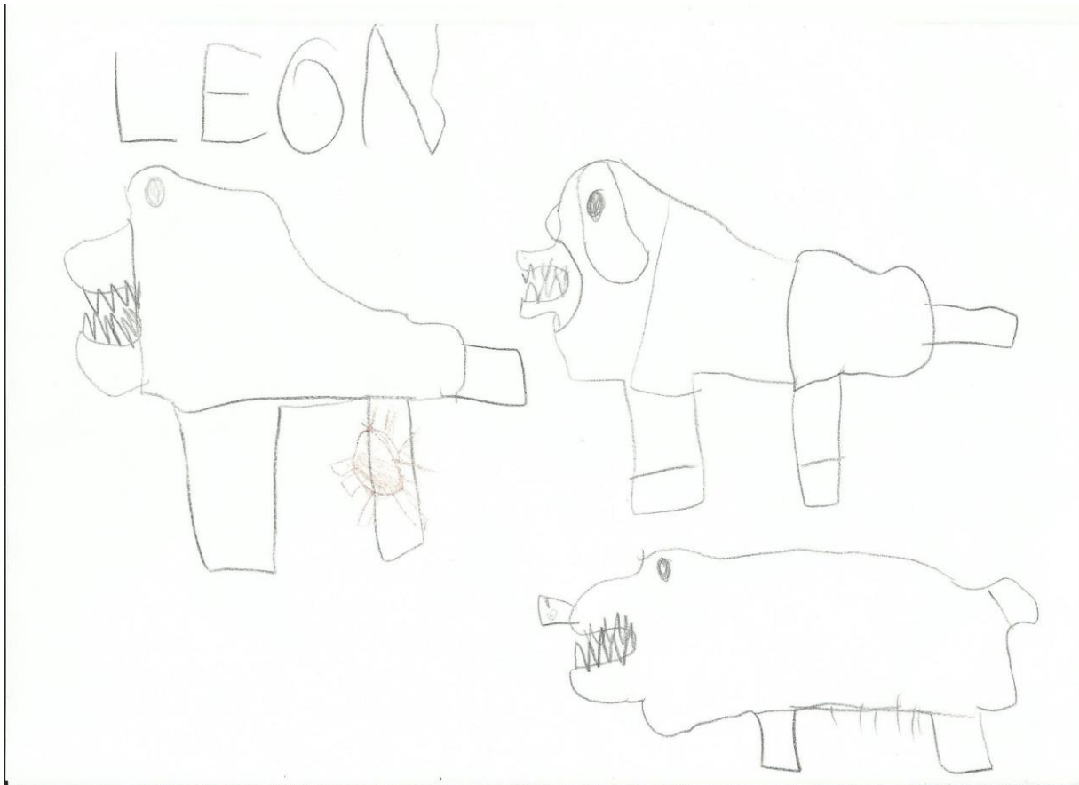
Slika 32. L. A. 5, 5 god., „Divlja svinja“ – u ovom radu vidimo da su linije čiste i potezi su čvrsti, dijete je tri puta nacrtalo lik divlje svinje, na što možda možemo zaključiti da se boji da će pogriješiti. Prikazana je istaknutost zubi što često može ukazivati na agresivnost. Također, vidimo ježa koji je nacrtan u drugoj boji i to veoma laganim linijama. Tehnika: olovke u boji.