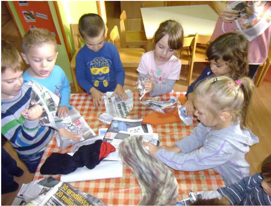
Slika 16. Gužvanje novina i punjenje štapnih lutaka i lutka zijevalica