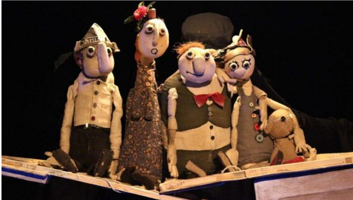
Slika 3. Lutkarska predstava

U Jugoslaviji lutkarsko kazalište gotovo da i nije imalo tradicije, tek nakon Drugoga svjetskog rata počinju pokušaji ozbiljnijih umjetničkih pretenzija. U našim je krajevima prva predstava održana u Ljubljani 1913. godine, a priredio ju je slikar Josip Klemenčić.