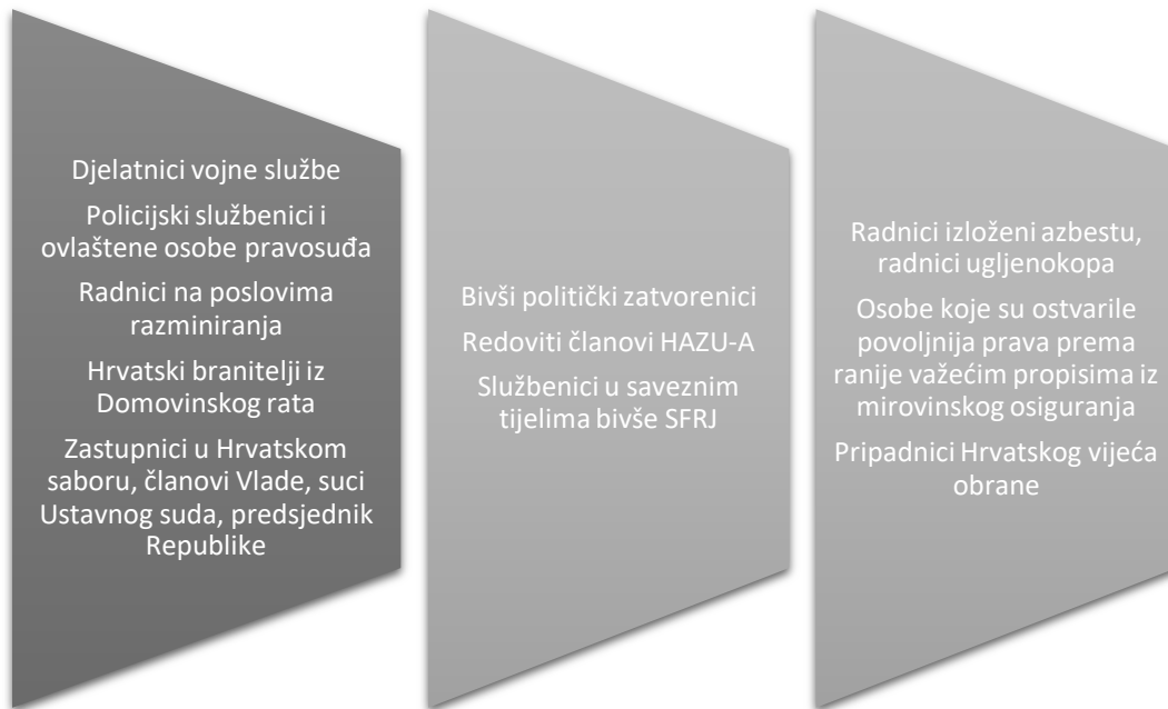
Graf 2.: Popis korisnika koji ostvaruju prava na mirovinu prema posebnim propisima