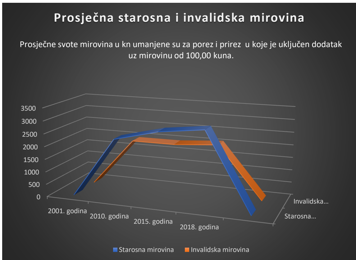
Graf 4.: Prosječna starosna i invalidska mirovina u Hrvatskoj za razdoblje od 2001. do 2018. godine