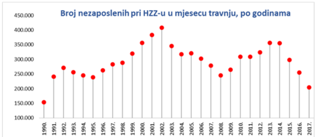
Graf 6.: Broj nezaposlenih u mjesecu travnju, po godinama u RH