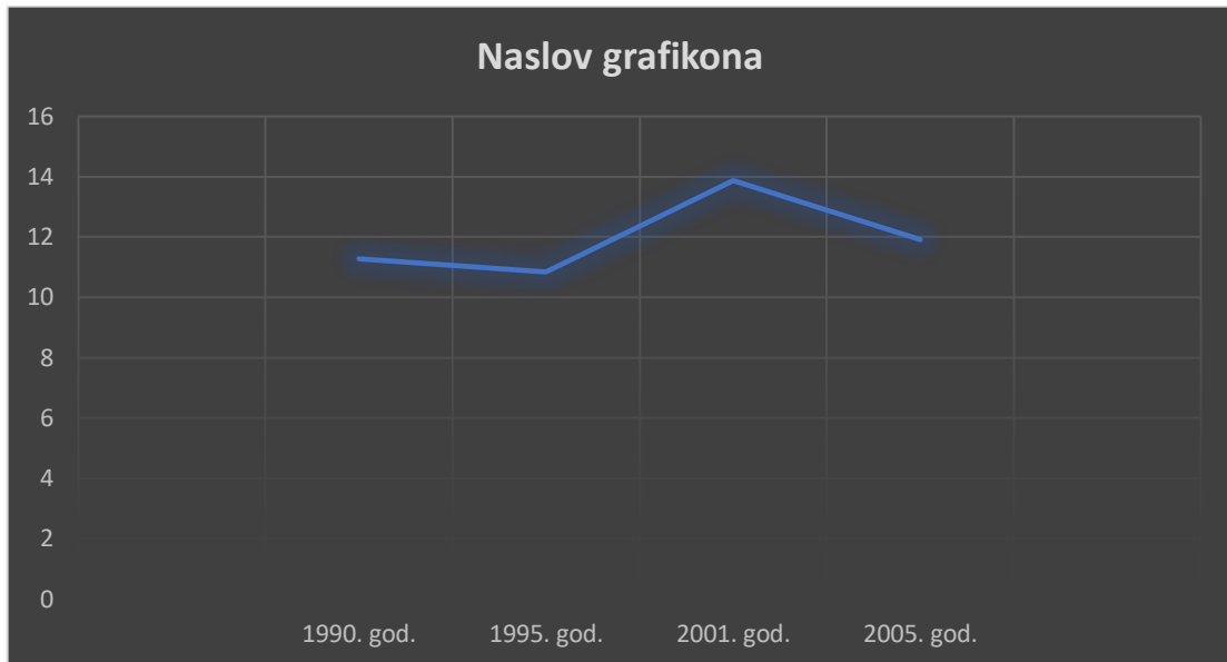
Graf 3.: Udio mirovinskih troškova u BDP-u u promatranim godinama