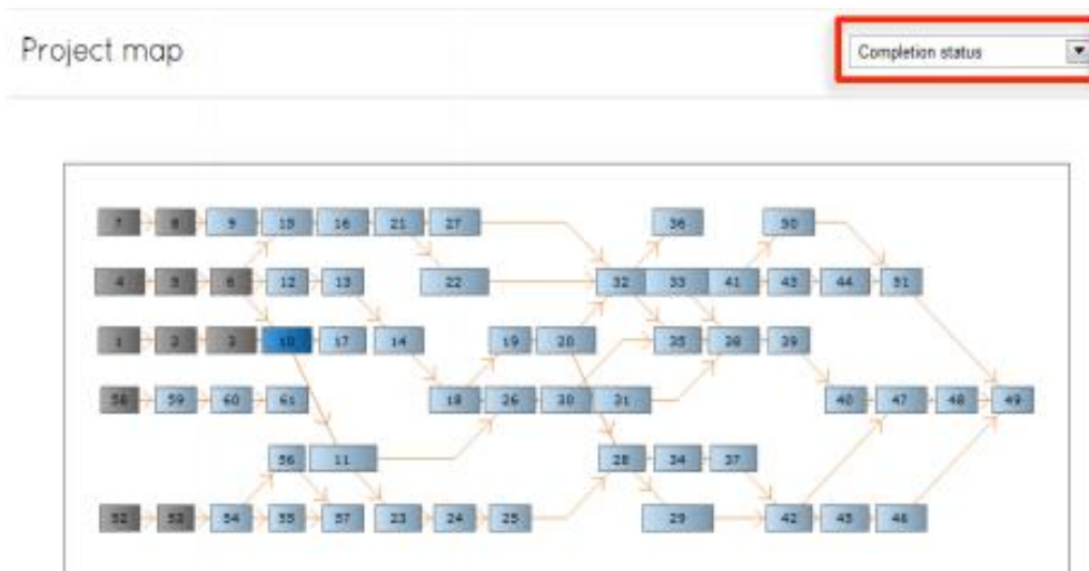
Slika 3. Dijagram dostupan na stranici "Progress"