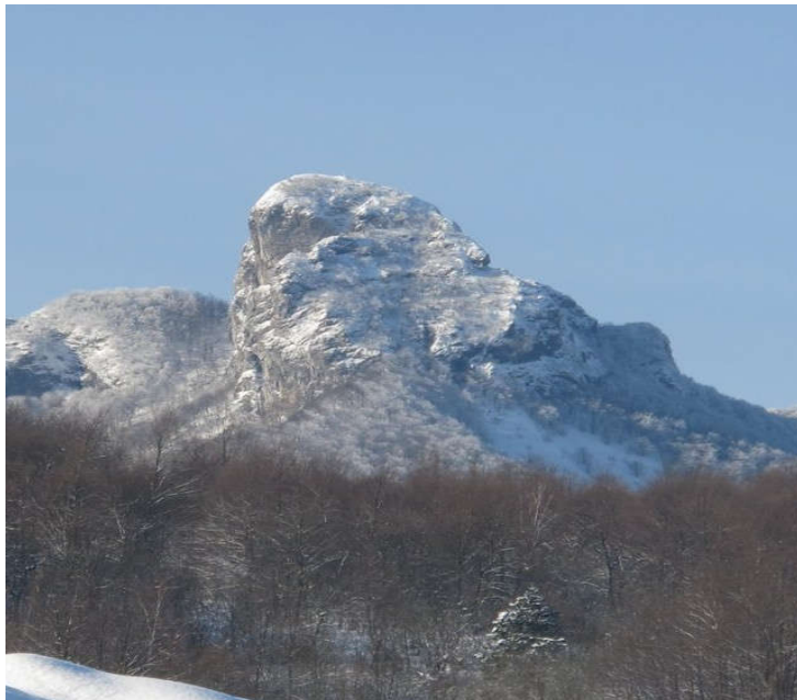
Slika 8. Vrh planine Klek

Na temelju geografskog položaja, Ogulin krasi i prirodne vrednote. Jedna od njih je i planina Klek koja je visoka 1181 m (Slika 8.). Klek je poznat mnogim planinarima, alpinistima, botaničarima, putopiscima i ljubiteljima prirode. Sa samog vrha planine pruža se pogled na okolicu, a ako je vrijeme čisto može ga se vidjeti iz Zagreba. Upravo njegova okomita stijena predstavlja kolijevku hrvatskog planinarstva i alpinizma. Prva ideja o utemeljenju planinarskog društva je nikla u Ogulinu 1874. godine. Klek je također bogat zaštićenom florom i faunom, pa se tako mogu pronaći kitajbelov jaglac, dlakavi sleč, malijevo devesilje, hrvatska bresina, srčanik, klauzijeva sirišta, alpski ranjenik, crveni zlatan, kranjski ljiljan, alpska pavitina i dr. Među zaštićenim vrstama pronađeni na Kleku su i kaćun (planinska orhideja), a od životinja su vuk, medvjed, ris, tetrijeb gluhan i divlja mačka.