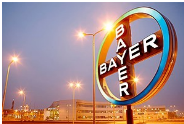
Slika 4. Logo i glavni simbol tvrtke Bayer