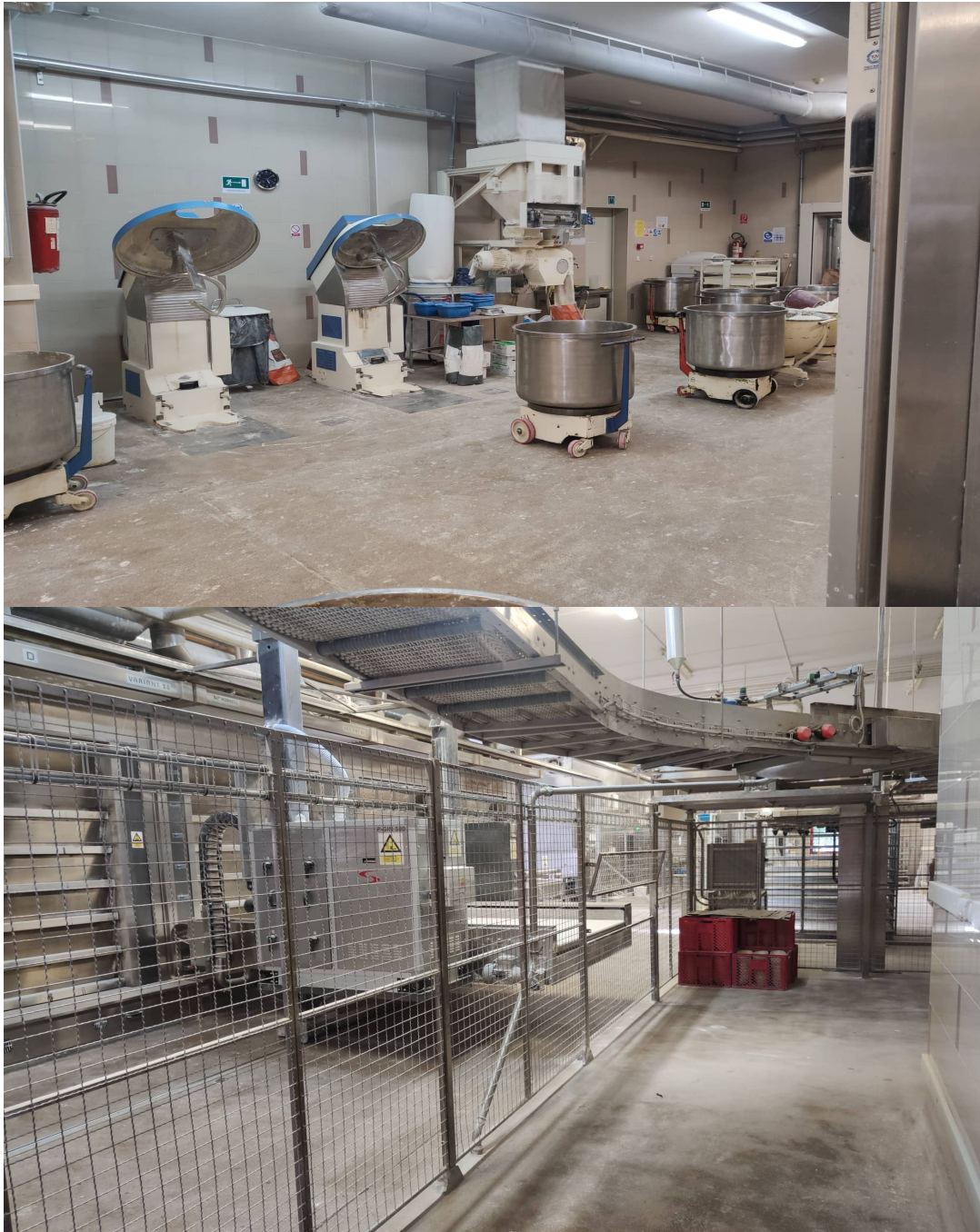
Slika 4. Proizvodni pogon – miješalice i roboti za proizvodnju poduzeća Čakovečki mlinovi d.d. u Oroslavlju (Krapinsko-zagorska županija)