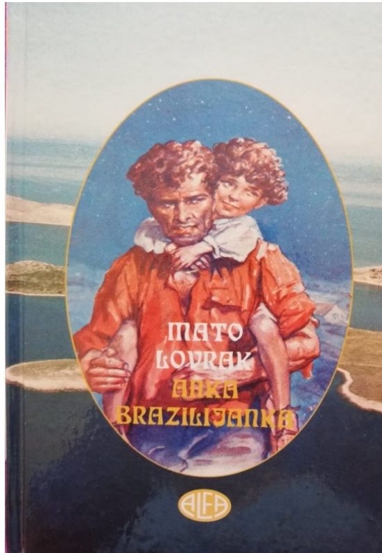
Slika 1: Naslovnica knjige Mate Lovraka Anka Brazilijanka u izdanju Alfe iz 1995.