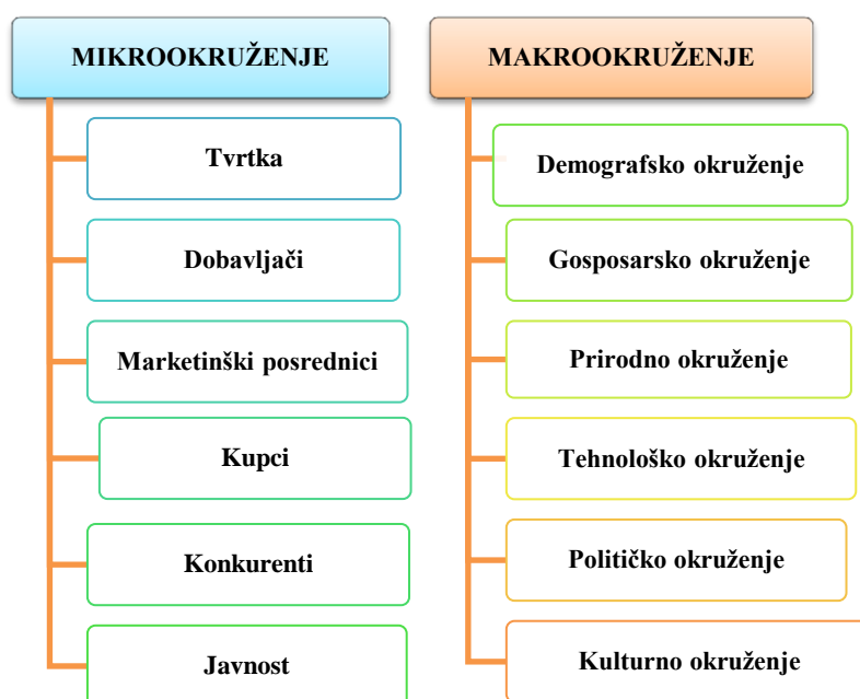
Slika 1 Mikro i makro okruženje marketinga