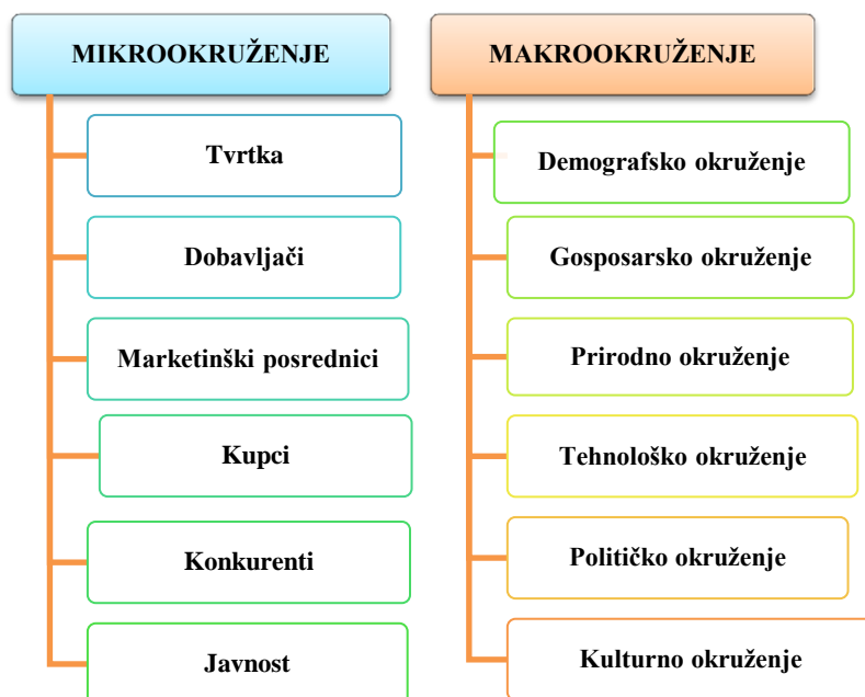
Slika 1 Mikro i makro okruženje marketinga