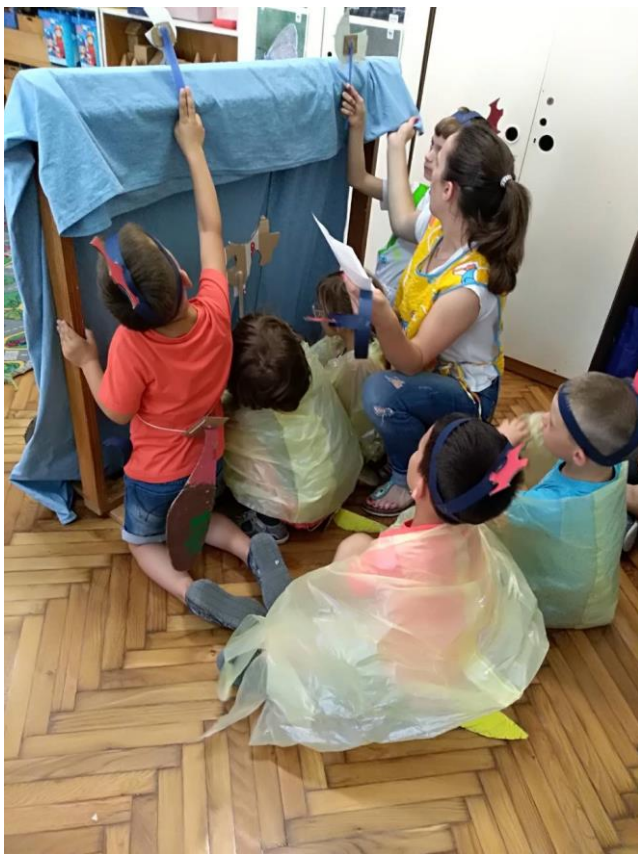
Slika 28. Prikaz animaciju lutke i odvijanje radnje iza scene.