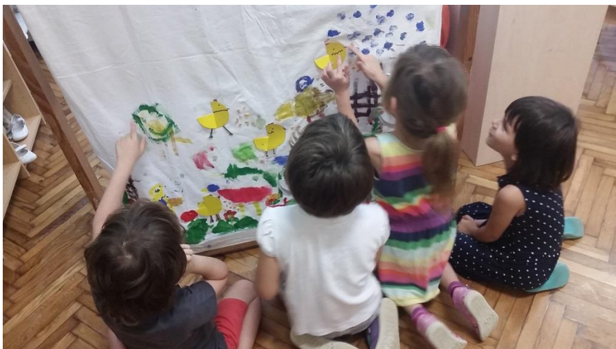
Slika 21. Djeca oponašaju zvukove životinja koje borave na seoskom dvorištu i prepričavaju na svoj način radnju koja se odvija u priči „Nikad nisi sam“.