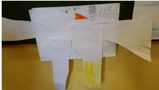
Slika 30. Likovni uradak djevojčice L. D.