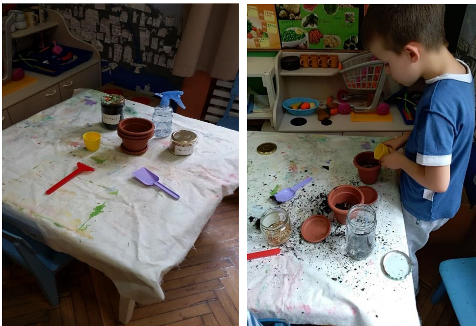
Slika 5. Istraživački centar, 2. dio