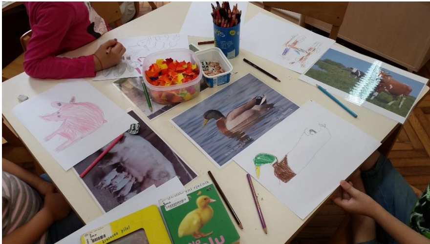
Slika 12. Djeca dovršavaju bojanje i crtanje svojih likovnih radova koji su potrebni za izradu lutaka.