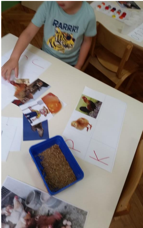
Slika 7. Središte početnog čitanja, pisanja i računanja, 2. dio