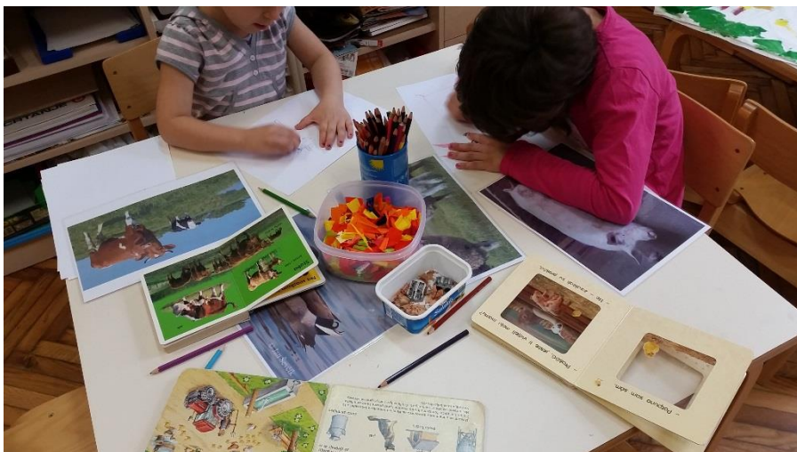
Slika 11. Prikaz materijala za poticaj dječje kreativnosti i mašte tijekom izrade crteža za lutkarski igrokaz.