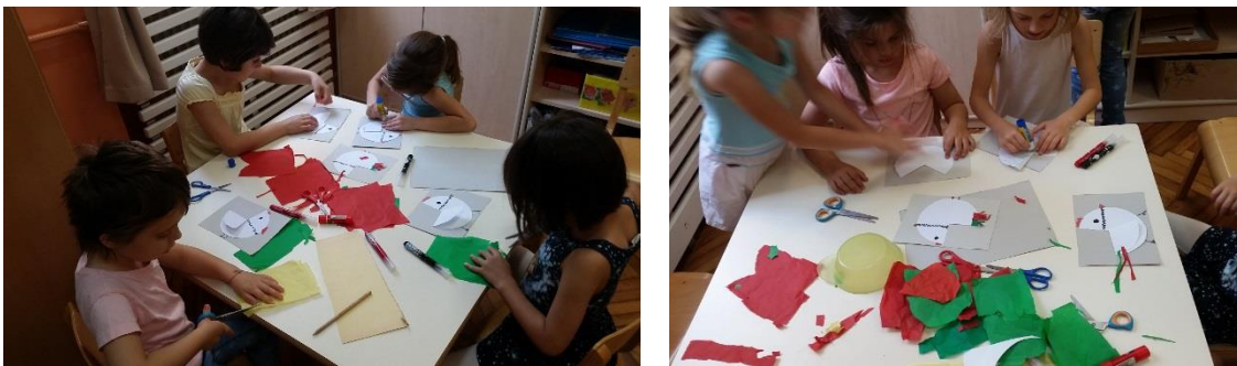
Slika 9. Ukrašavanje koka i pijetlova s perjem od trakica krep papira.

Djeci sam na stolu pripremila koke i piliće koje su izrađivali u prethodnoj likovnoj aktivnosti te su tu likovnu aktivnost povezali sa ovom u kojoj su djeca izrađivala lutke. Koke i pilići su izrađeni od papira. Djeca su im crtala dijelove tijela i samostalno radila sa škarama i ljepilom, što je jako važno za razvoj motorike šake i ruku. Djeca su imala zadatak da već izrađene koke i piliće ukrase perjem, te da obrate pažnju kako će se perje od pijetla razlikovati od perja ostalih koka. Na stolu im je bio ponuđen krep papir kojeg su trebali izrezati na trakice, te od trakica izraditi perje. Kada su djeca završila s ukrašavanjem koka, pilića i pijetlova, radove su plastificirali i od njih napravili lutke na štapu.