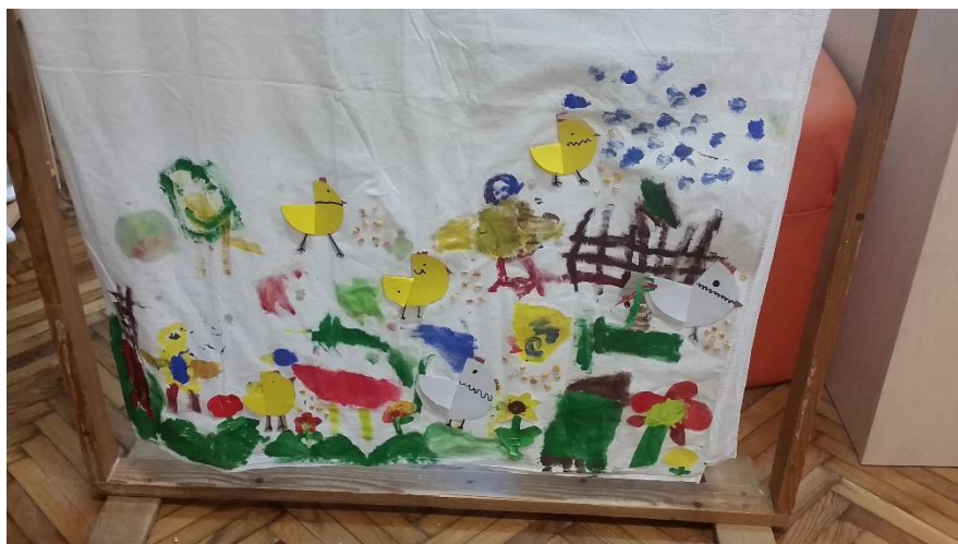
Slika 20. Dio scenografije koji prikazuje odvijanje radnje na seoskom dvorištu.