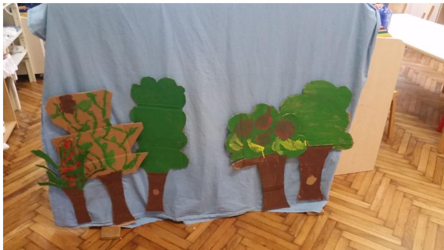
Slika 19. Dio scenografije koji prikazuje odvijanje radnje u šumi.

Prikaz gotove scenografije slijedi u nastavku kroz nekoliko slika.