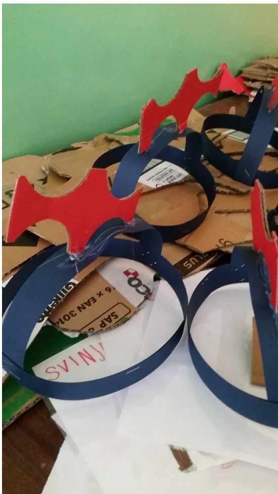
Slika 23. Prikaz izrađenih kapica s krijestom koja je dio rekvizita u igrokazu.