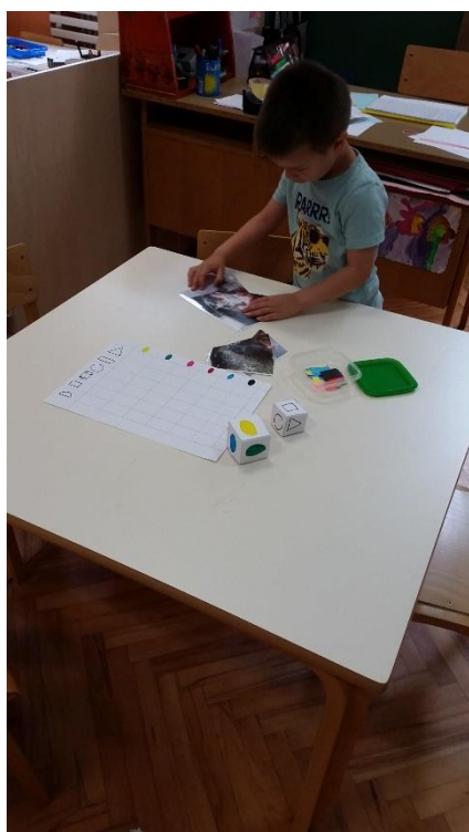
Slika 3. Stolno-manipulativni centar