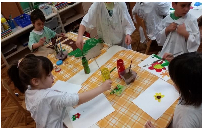
Slika 16. Oslikavanje stabala i cvjetova.