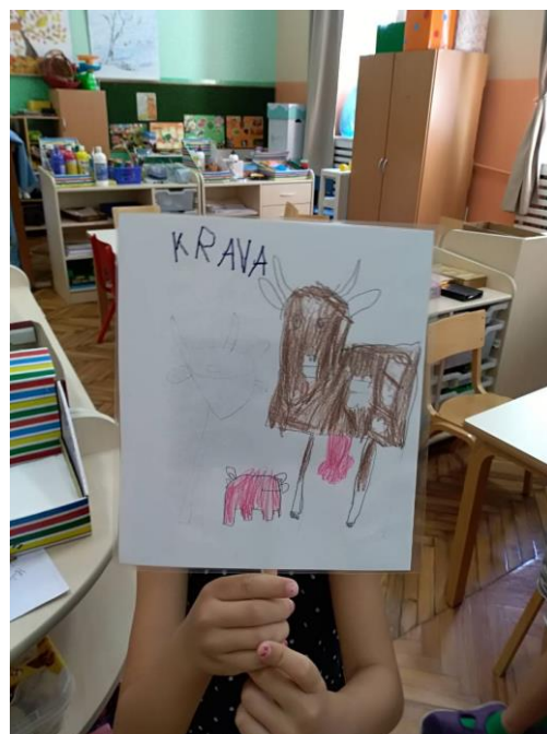
Slika 13. Prikaz gotovih lutaka na štapu koje su napravljene od dječjih likovnih radova.