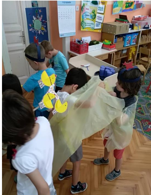
Slika 26. Djeca si međusobno pomažu u pripremi rekvizita za igrokaz.