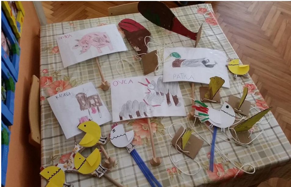
Slika 14. Prikaz dovršenih lutaka na štapu za igrokaz „Nikad nisi sam“.