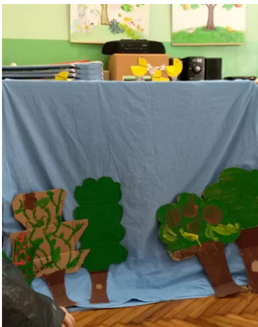
Slika 29. Prikaz animacije lutke i odvijanje radnje iz perspektive gledališta.