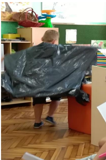
Slika 25. Prikaz rekvizita koje ima jastreb tijekom uloge u igrokazu „Nikad nisi sam“.