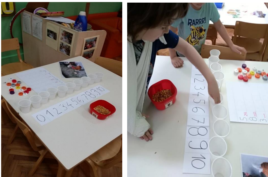
Slika 6. Središte početnog čitanja, pisanja i računanja

Zadatak ovog istraživačkog centra bio je da djeca zasade zrno kukuruza i zaliju ga vodom, te ga nakon toga stave na sunčevu svjetlost i promatraju što će se dogoditi s tim klipom kukuruza.