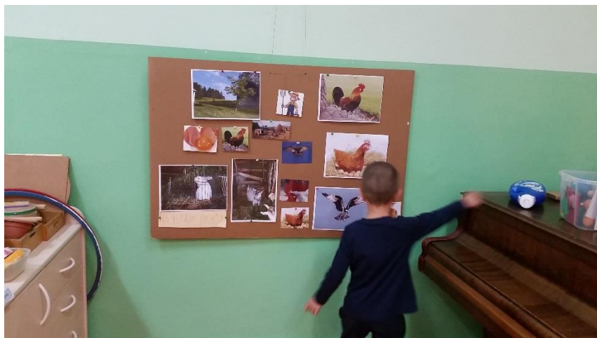
Slika 2. Materijali za poticaj unutar dječjeg boravka

U nastavku slijedi slikovni prikaz materijala za poticaj unutar dječjeg boravka (Slika 2) i stolno-manipulativnog centra (Slika 3).