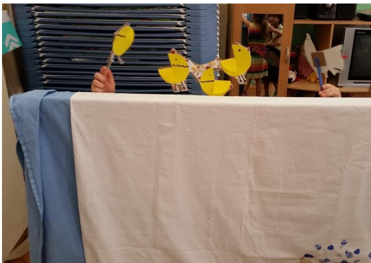
Slika 10. Djeca se samoinicijativno igraju s lutkama prije samog igrokaza.