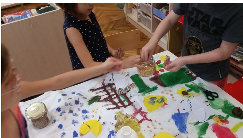
Slika 18. Prikaz timskog rada kod djece tijekom lijepljenja cvjetova, zrna kukuruza i pšenice na dijelove scenografije.