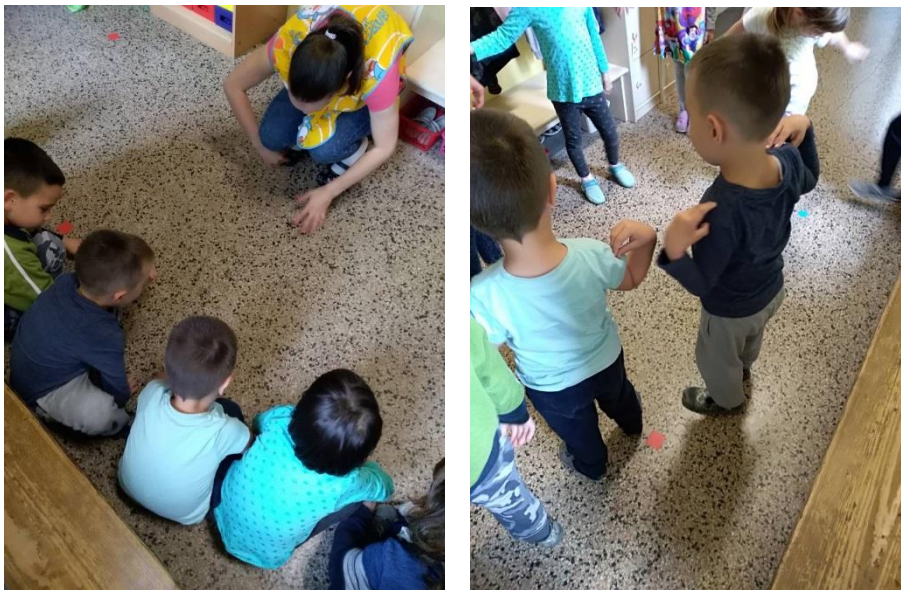
Slika 8. Sportski centar