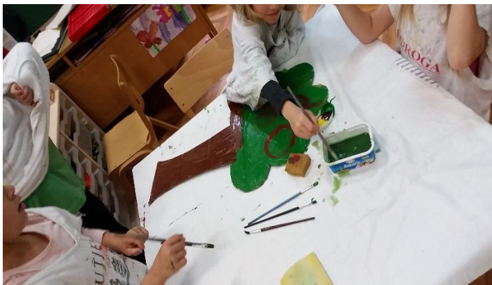
Slika 15. Djeca slikarskom tehnikom oslikavaju stabla.

Scenografiju smo izrađivali prema mjestu radnje u priči „Nikad nisi sam“. Zadatak je bio prikazati na platnu šumu i seosko dvorište. Za izradu scenografije bile su potrebne dvije plahte, karton koji izrezan u obliku stabala, tempere, poticajni materijal (slikovnice), zrna kukuruza, pšenice i likovni radovi.