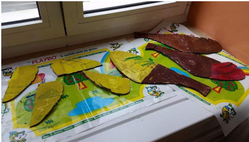
Slika 22. Oslikana perja koja će biti rekviziti za uloge koke, pilića i pijetla.

Rekvizite sam izrađivali od vreća za smeće, kartona i hamer papira. Vreće za smeće koristili sam za izradu krila. Od žutih vreća za smeće izradila sam krila za piliće, a od crne vreće za smeće krila za jastreba. Karton sam iskoristila za izradu perja za koke, piliće i pijetla. Karton je izrezan u obliku perja, a djeca su ga oslikala temperama. Hamer papir koristila sam za izradu kapica, a prije same izrade kapica svakom sam djetetu izmjerila opseg glave. Nakon što sam djeci izmjerila opseg glave, izrezala sam Hamer papir na trakice. Trakice sam izrađivala pomoću mjera opsega glave za svako dijete posebno. Kada sam od trakica napravila za svako dijete kapu, onda sam na svaku kapu zalijepila krijestu koju sam prethodno izradila od crvenog kartona.