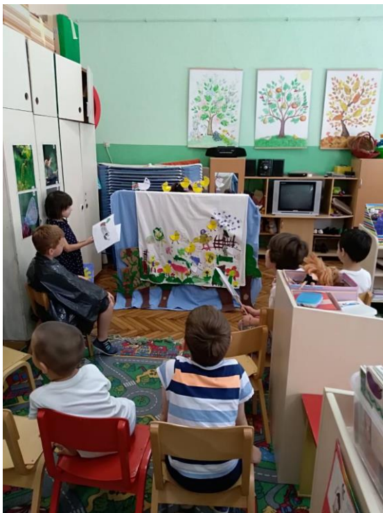
Slika 27. Gledalište.