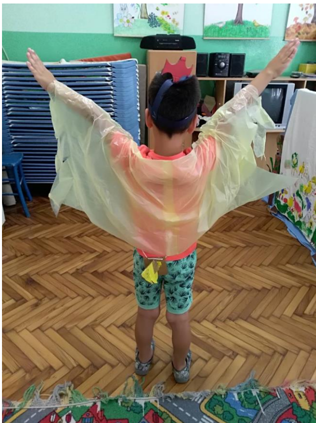
Slika 24. Prikaz rekvizita koji su izrađeni za ulogu pilića u igrokazu „Nikad nisi sam“.