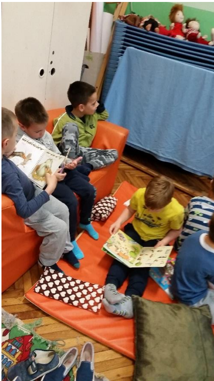
Slika 1. Djeca proučavaju i listaju slikovnice kao poticajni materijal

Prikaz aktivnosti koje sam odrađivala s djecom pomoću metoda kao pripremu za igrokaz slijedi u nastavku (Slika 1).