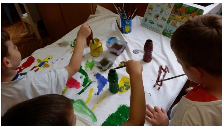
Slika 17. Djeca oslikavaju plahu s motivima koji se nalaze na seoskom dvorištu.