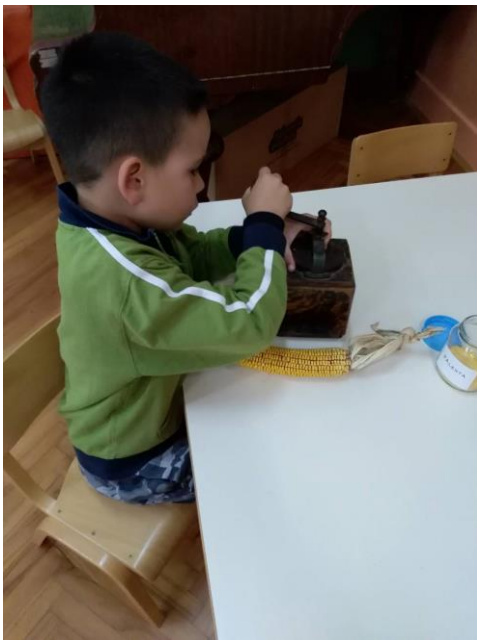
Slika 4. Istraživački centar

Djeci je bilo ponuđeno unutar stolno-manipulativnog centra da pokušaju složiti pomoću puzzli sliku kokošinjca. Također imali su ponuđenu društvenu igru u kojoj je bio cilj da geometrijski lik ili geometrijsko tijelo spoje s odgovarajućom bojom. U nastavku slijedi slikovni prikaz istraživačkog centra (Slika 4).